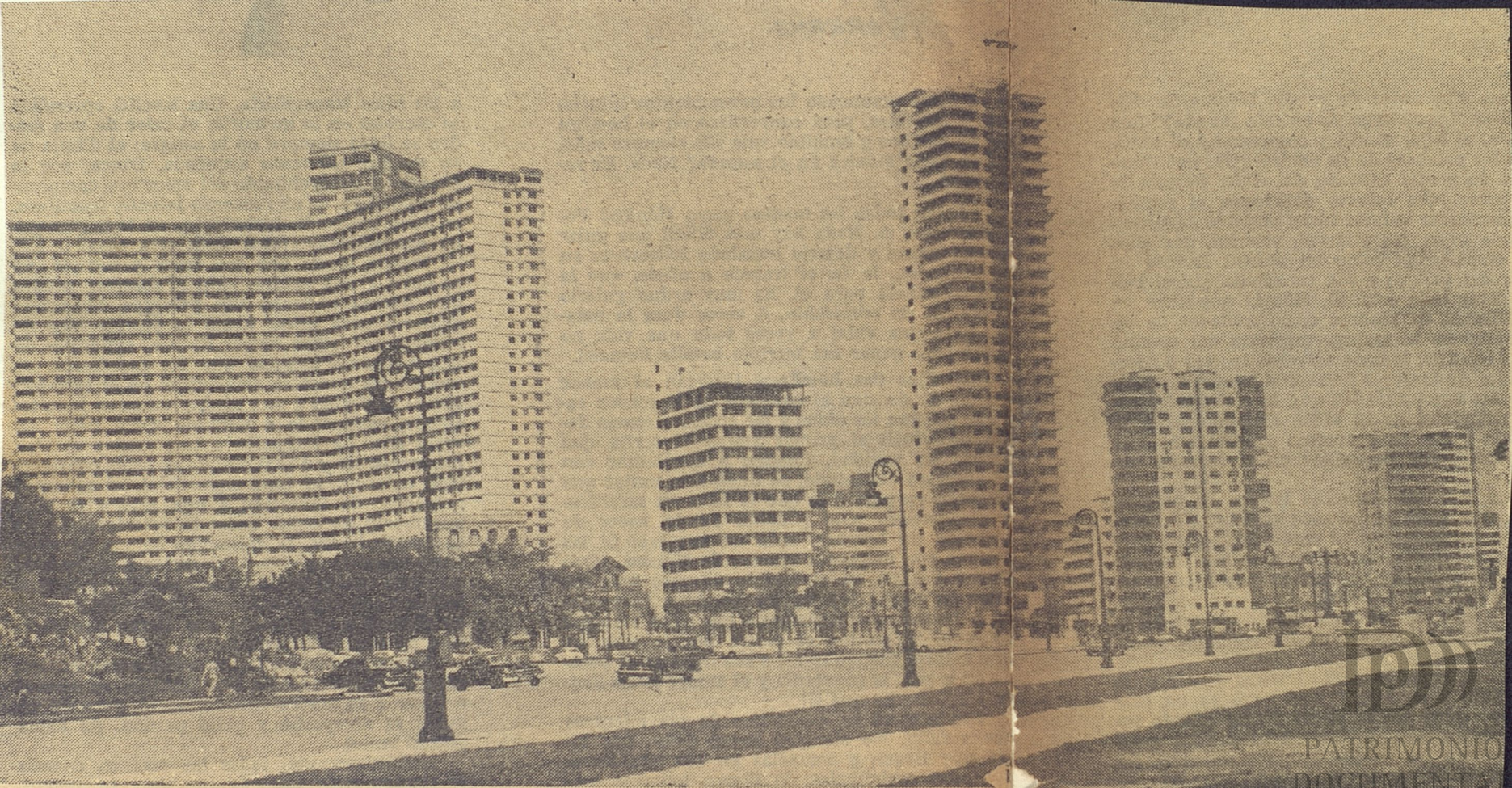
HERMOSA VISTA que ofrecen los rascacielos en la Zona del Vedado