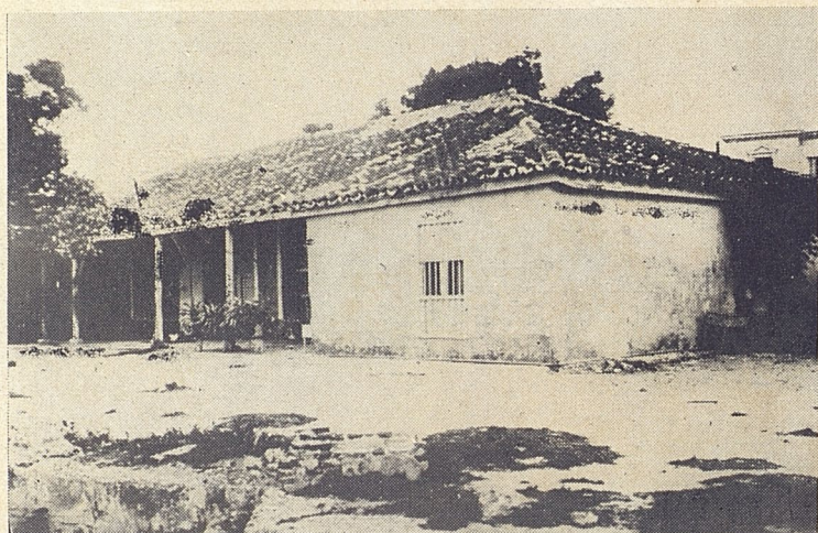
Residencia veraniega del Conde de Pozos Dulces, en el Vedado.