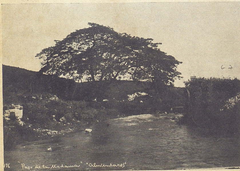
El "Paso de la Madama", por el río Almendares.