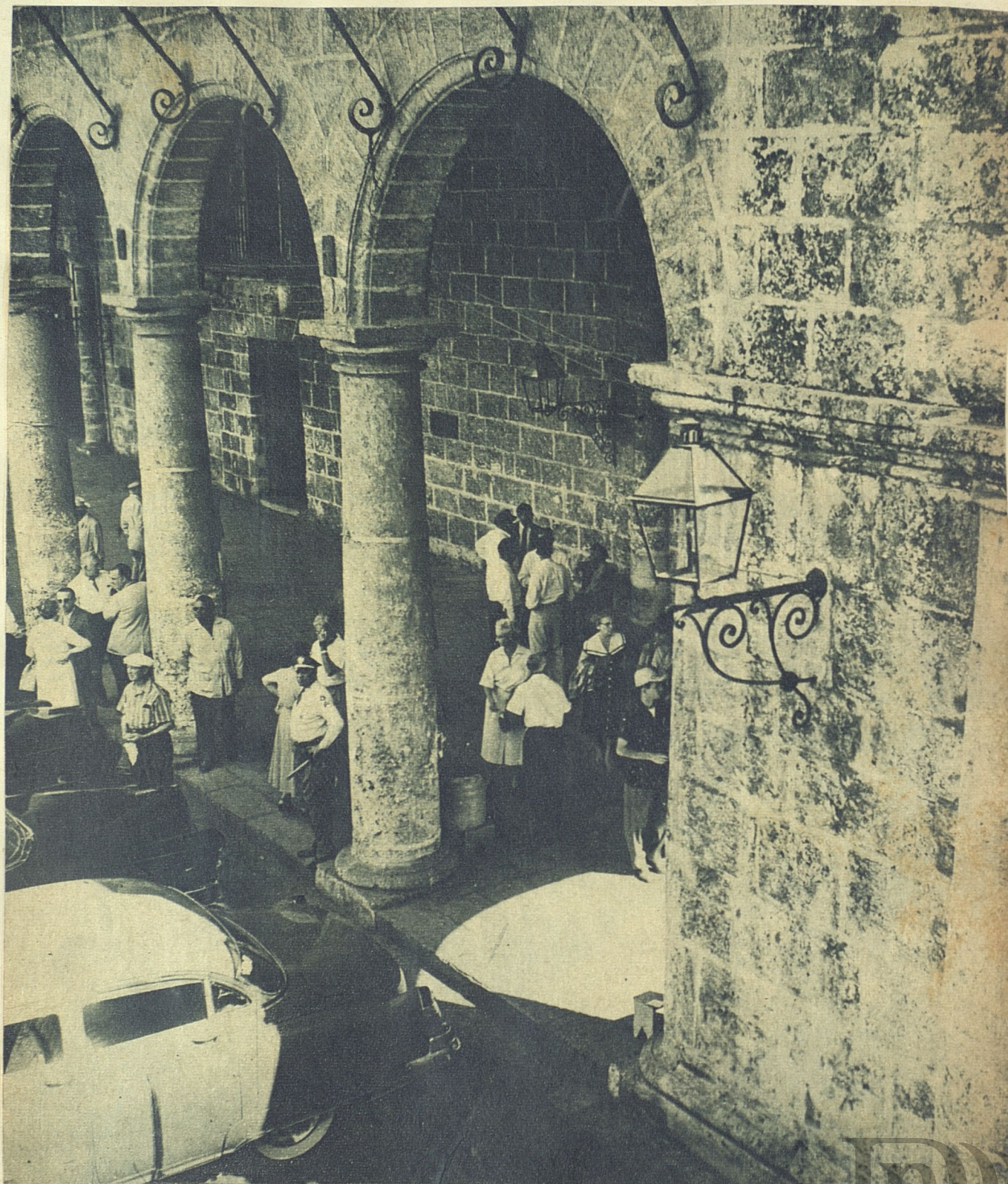
La antigua Habana no es sólo curiosidad para turistas. Hay que asomarse a ella con sensibilidad, cultura y amor.