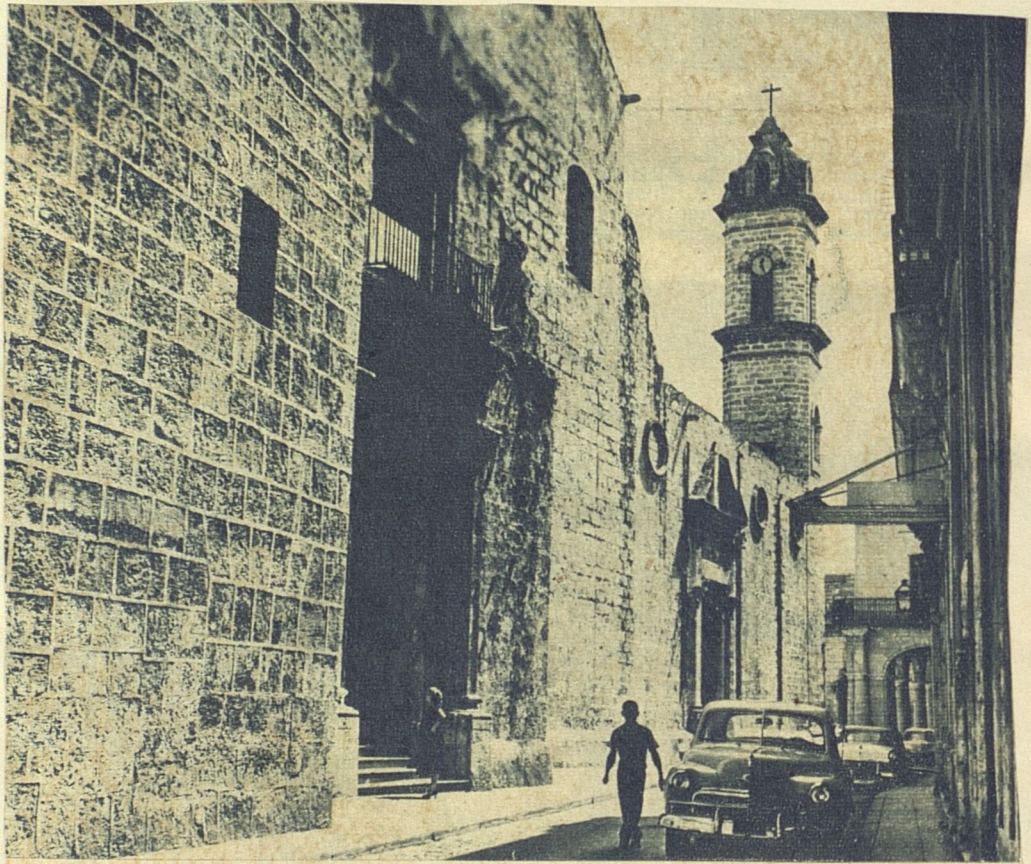
Una Habana de geométricos muros escorialenses.