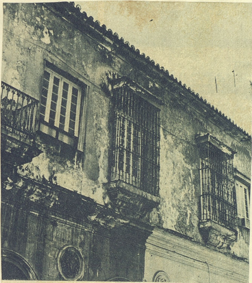
Una Habana de rejas y balconadas en la que los nobles materiales del hierro y la piedra se espiritualizan con una perenne vocación de eternidad.