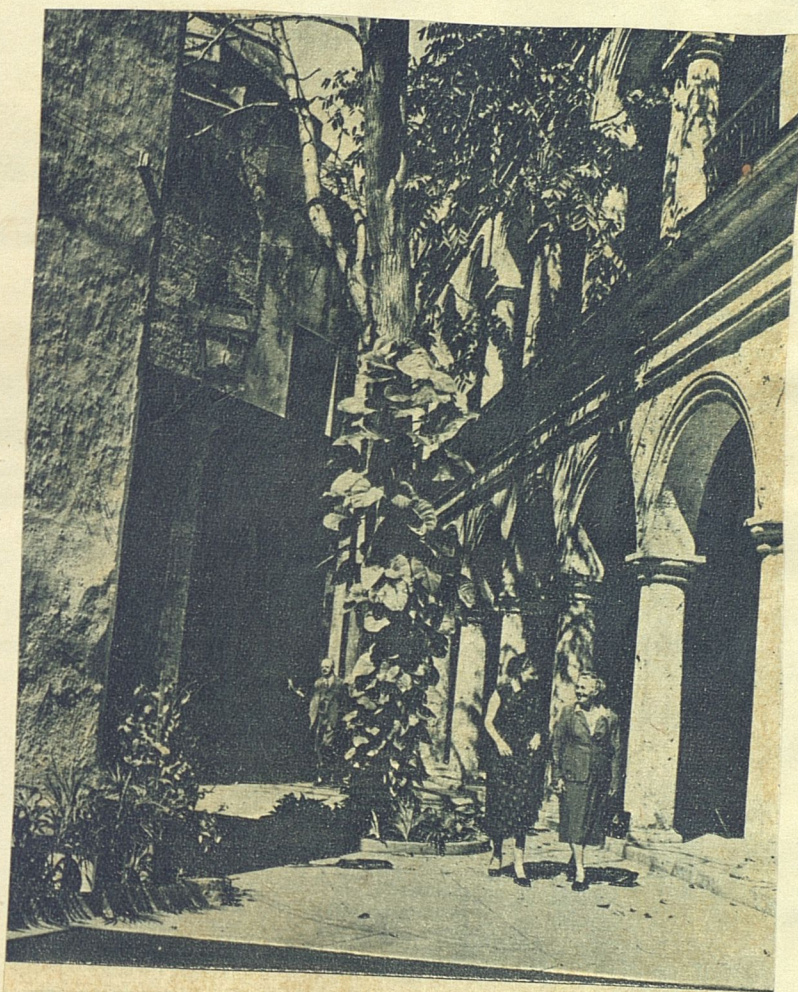
Una Habana silente y recoleta, donde la arquitectura vegetal del árbol juega con la pétrea arquitectura del arco y la columna.