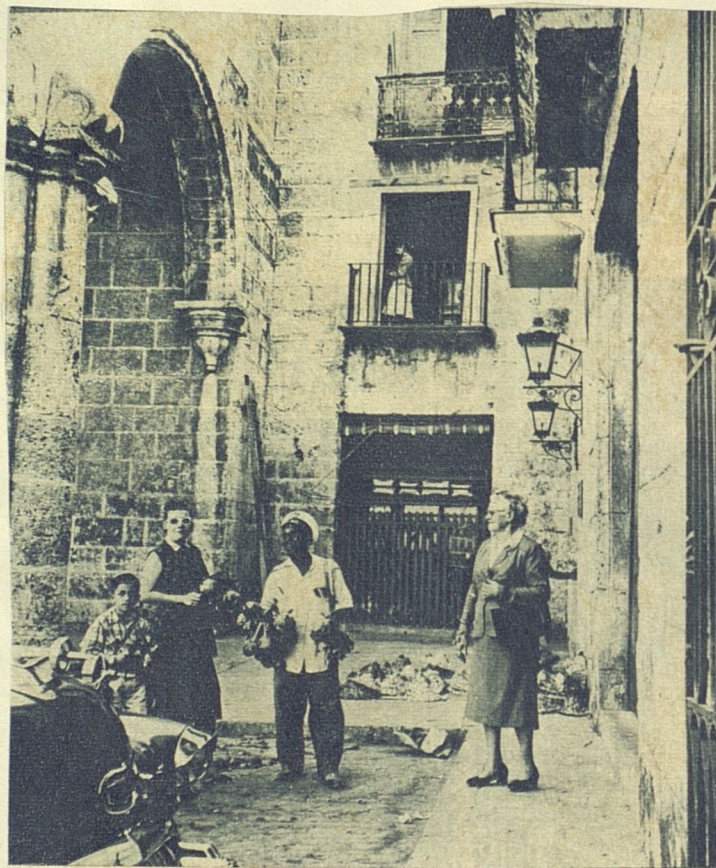
Una Habana monumental, que es como un trasplante de Compostela, Toledo o Salamanca.