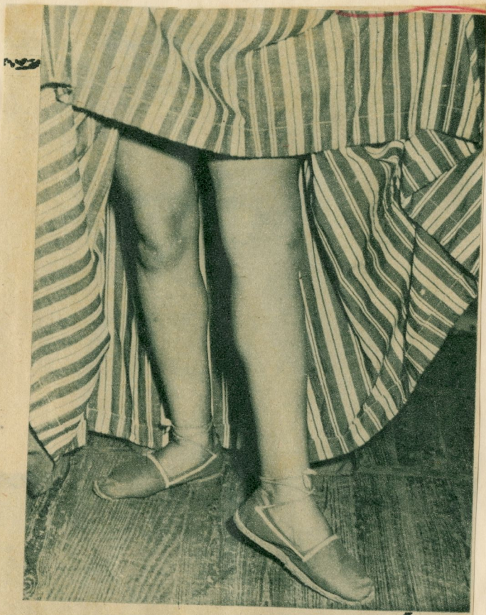
El arte típico español de Lola Montoya, de Cabalgata, hizo vibrar junto con el tablado de "La Comedia", el corazón de los aficionados.