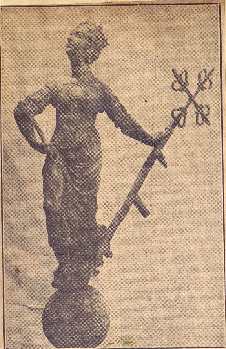
Figura en bronce con la efigie de doña Inés de Bobadilla, mujer de don Hernando de Soto.