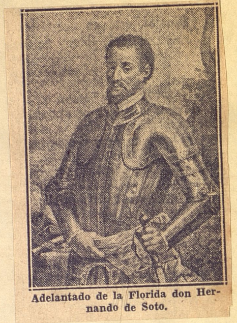
Adelantado de la Florida don Hernando de Soto.