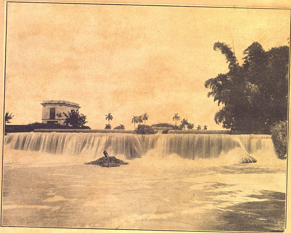
EL HUSILLO, RÍO ALMENDARES, ANTIGUO ACUEDUCTO