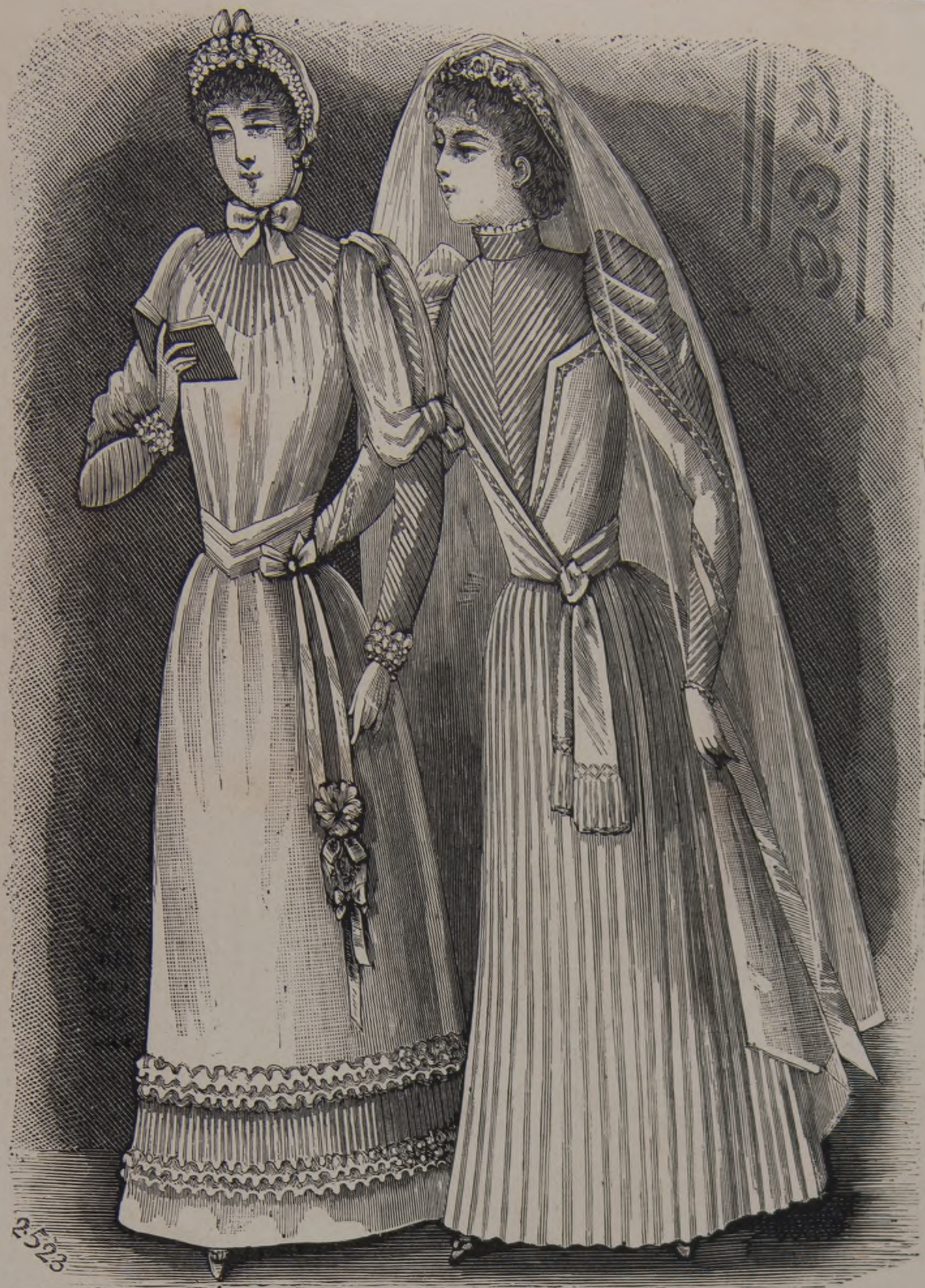
A. 16 y 17. — Toilettes de primera comunicacion.