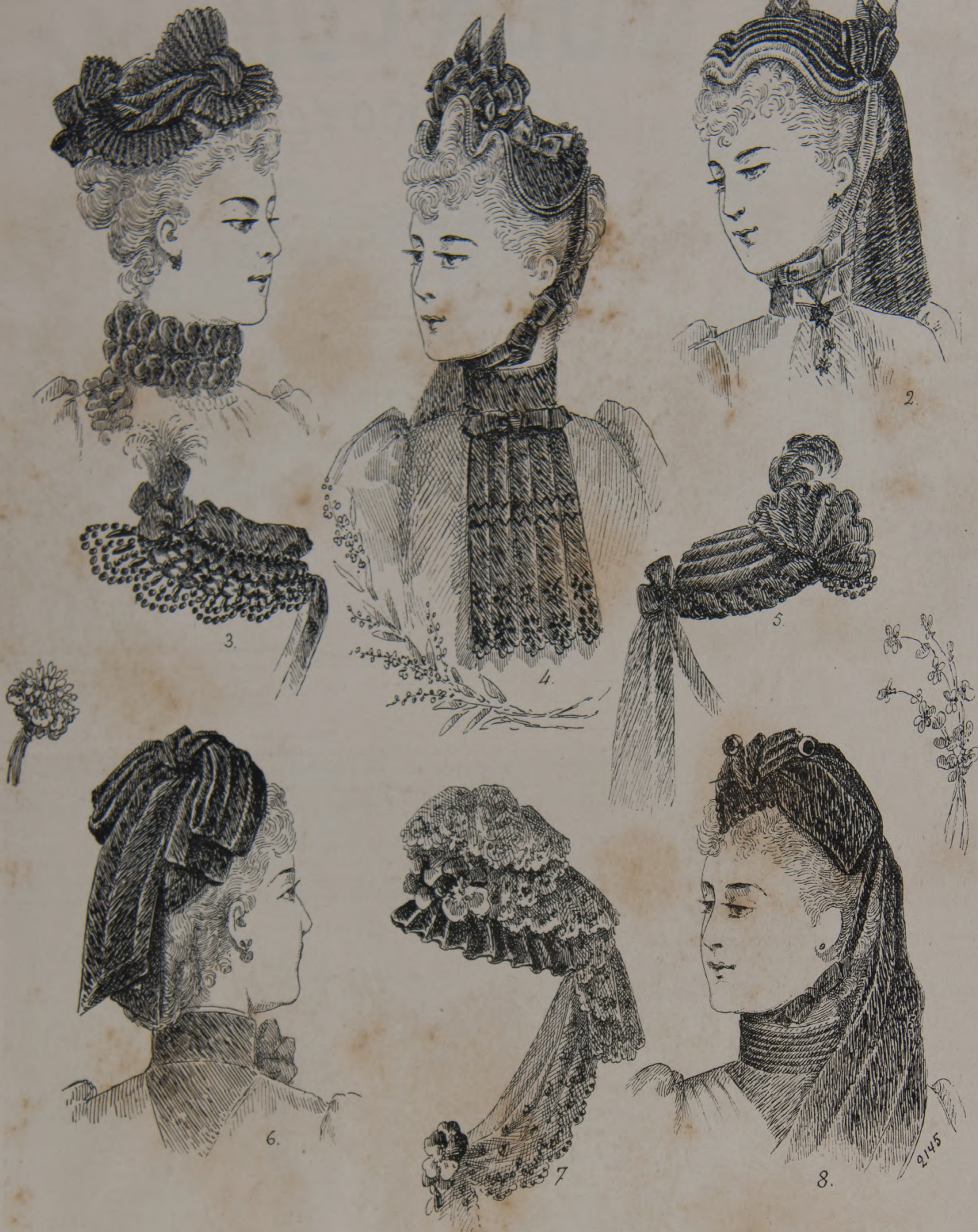
3. — Sombreros y adornos de luto.

2. —Toilette de novia. —Falda con paneaux levita en raso brillante, abierta sobre un de delantero ondulado en crepa de seda cola cuadrada en raso brillante montada en gruesos pliegues en la punta del cuerpo y forrada de seda ligera. Cuerpo-corsete en raso abierto sobre un fichú plegado y cruzado en crepa de seda. Mangas es-