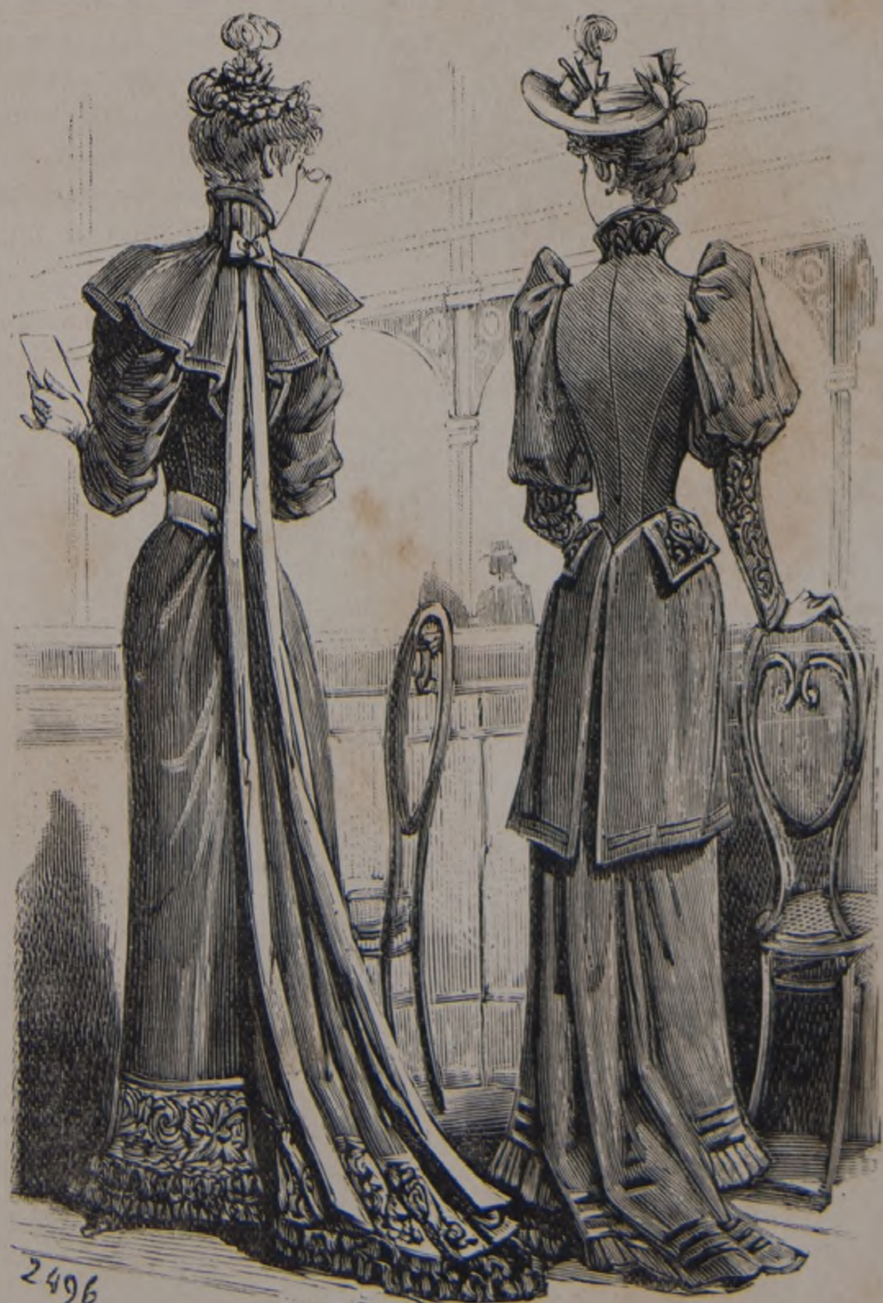
Toilettes del Concurso hipico, espalda del figurin en color n° 31. (Véase los explicaciones, pagina 218.)