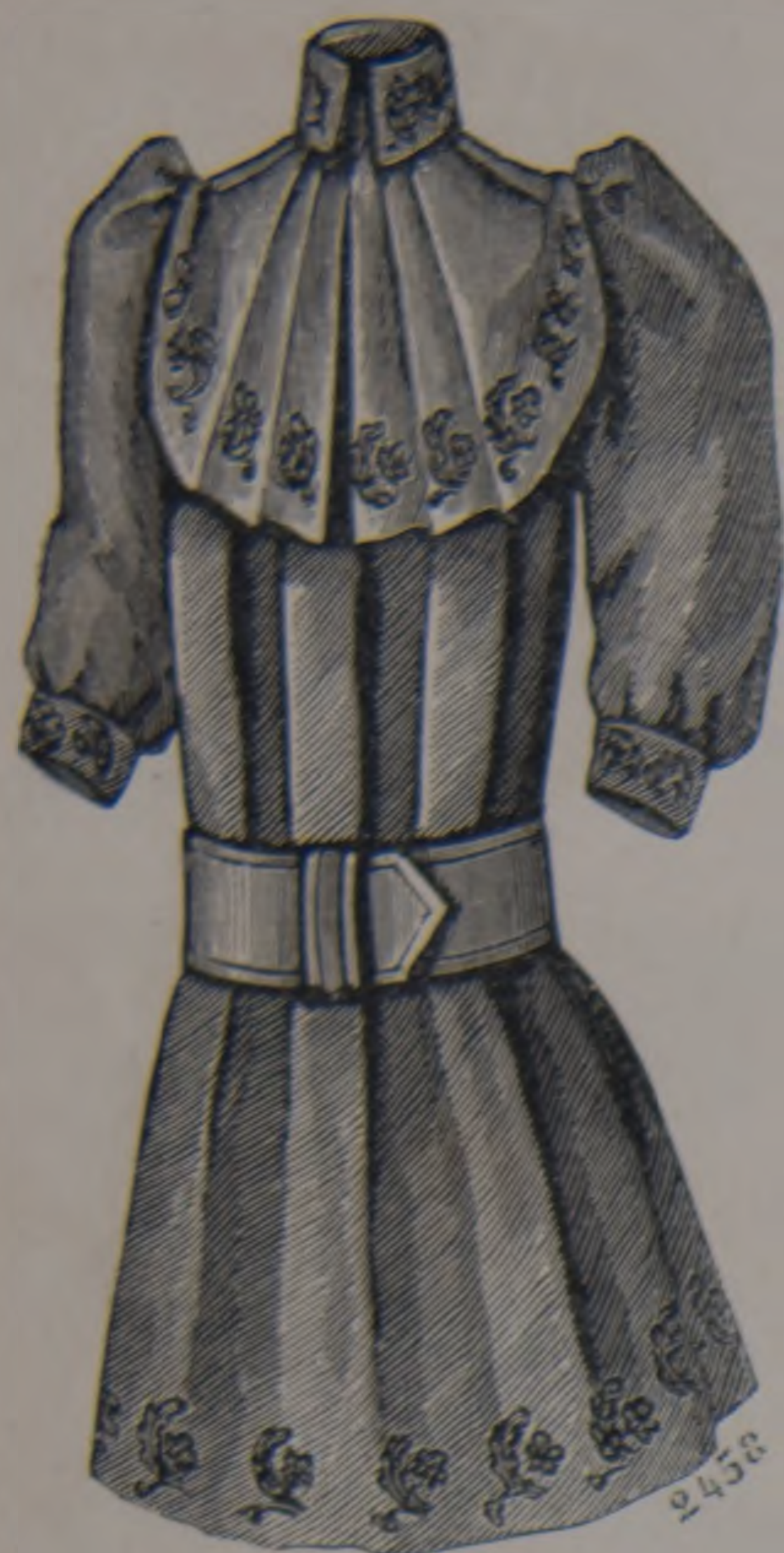
10. — Traje de niño.

13. — Otra Toilette de primera comunión . — Falda redonda en muselina y adornada en los bajos de pliegues de lencería alternados de entredoses. Cuerpo enteramente plegados á pliegues de lencería collar plegado en bordados. Cintura Imperio, anudada de lado, en faille blanca. Mangas abolladas con altos puños adornados como en los bajos de la falda. Velo y gorra en muselina. Guantes de cabritilla blanca.