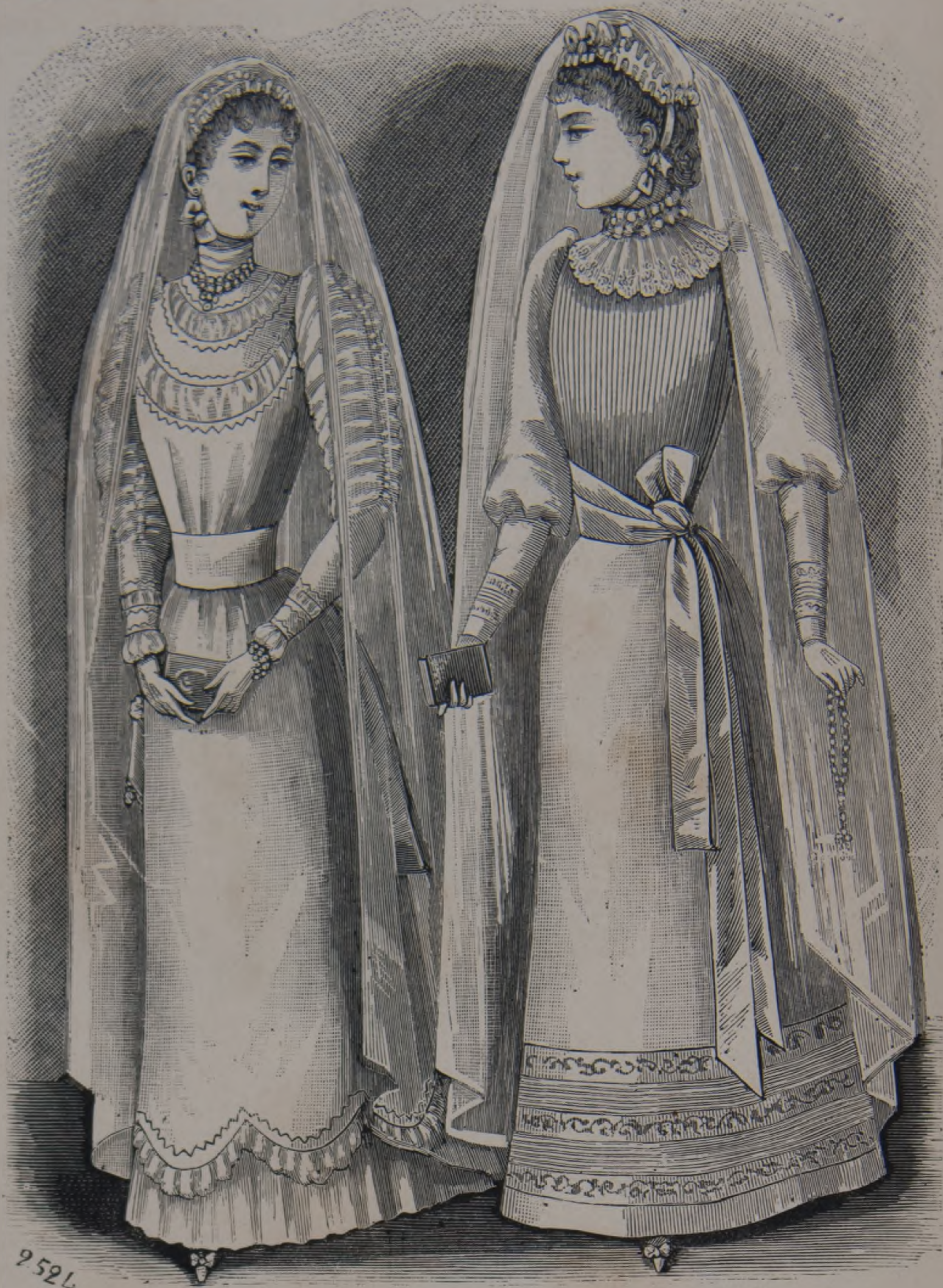
12 y 13. — Toilettes de primera comunión.

12. — Toilette de primera comunión . — Falda funda en muselina blanca cortada en los bajos en dientes redondos adornados de una pequeña tira festonada sobre un volante de muselina. Cuerpo ligeramente fruncido en el talle, abrochado detrás y adornado de abollados de muselina dibujando un canesú. Cintura en faille blanca, con largos cintas colgando detrás. Mangas abolladas en muselina. Velo y gorra en muselina. Guantes de cabritilla blanca.