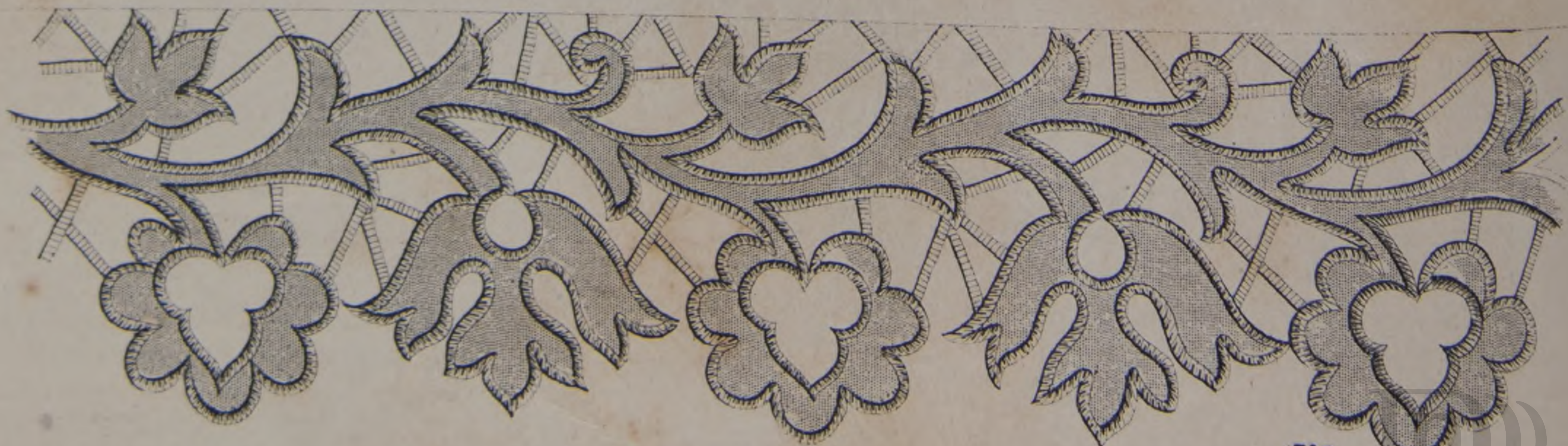
4. — Tira de bordado Rechele.

Hoja de Bordados n° 34. —Veintisiete Dibujos variados. —(Ver las explicaciones sobre la misma hoja.)