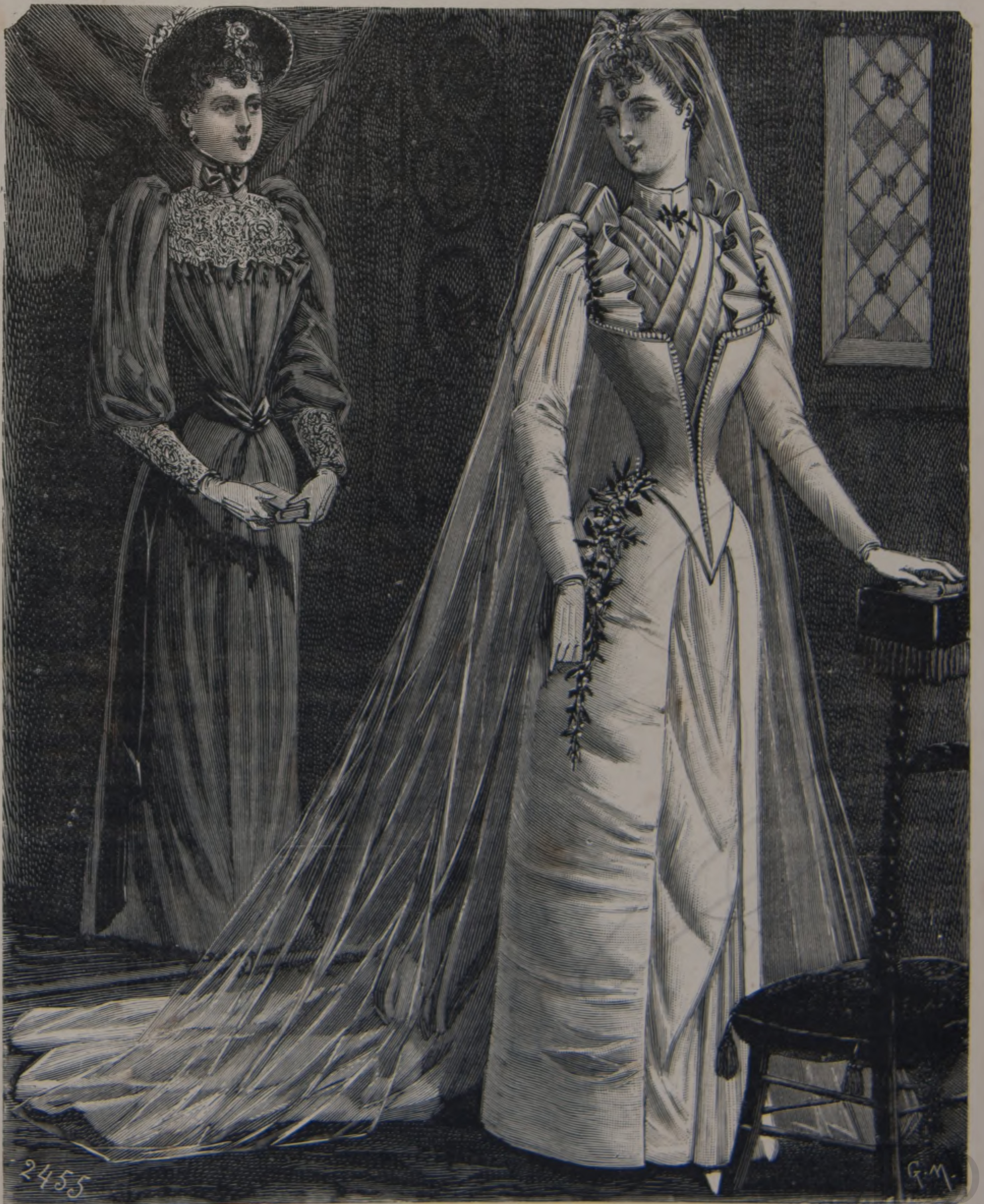
1. Toilette de demoiselle d'honneur. — 2. Toilette de novia.

La Mi-Carême cuyo nombre lo indica el titulo, sirve para cerrar con llave las fiestas populares de los Carnestolendas. El Paris