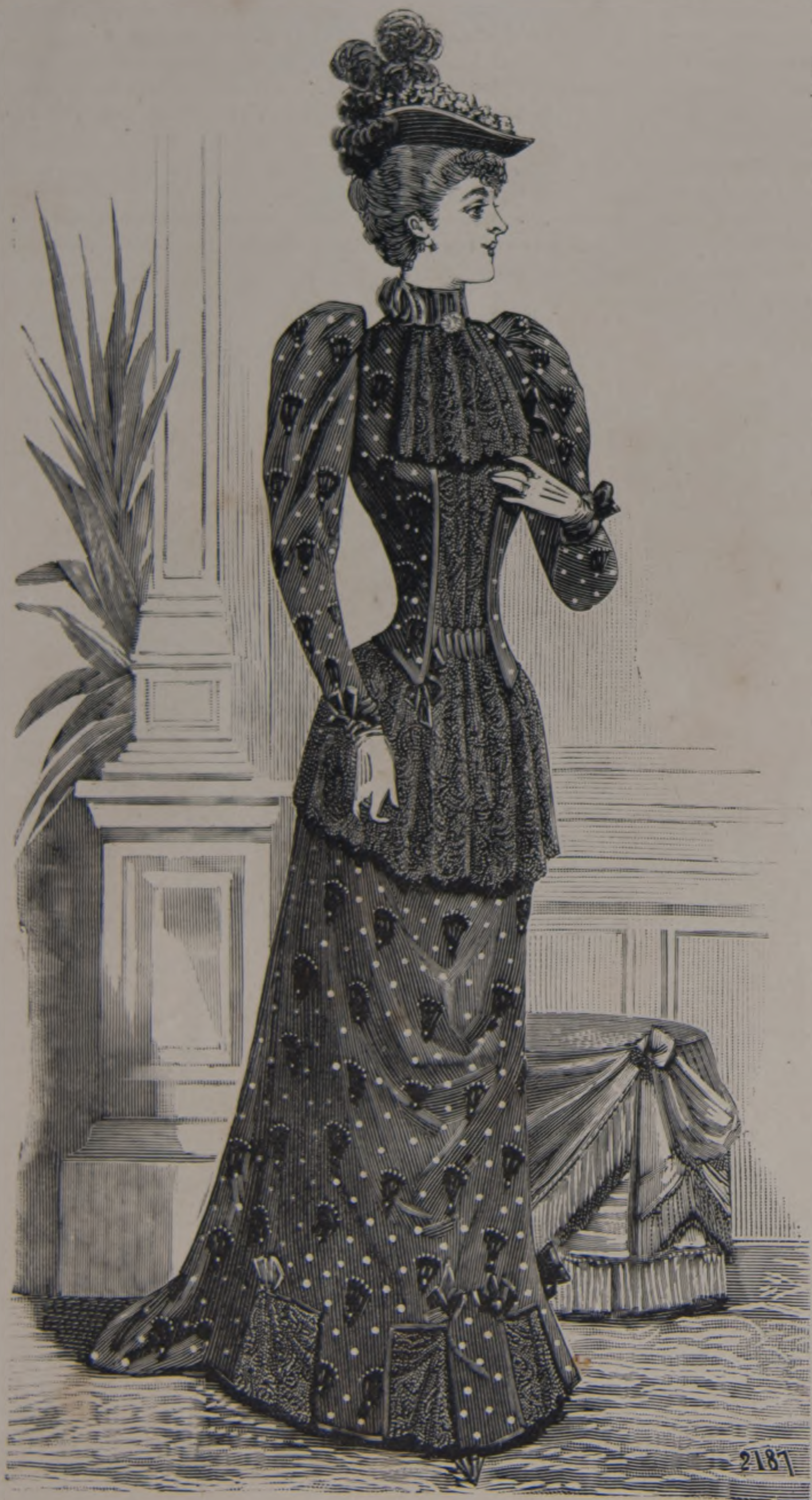
11. — Toilette de vestir.