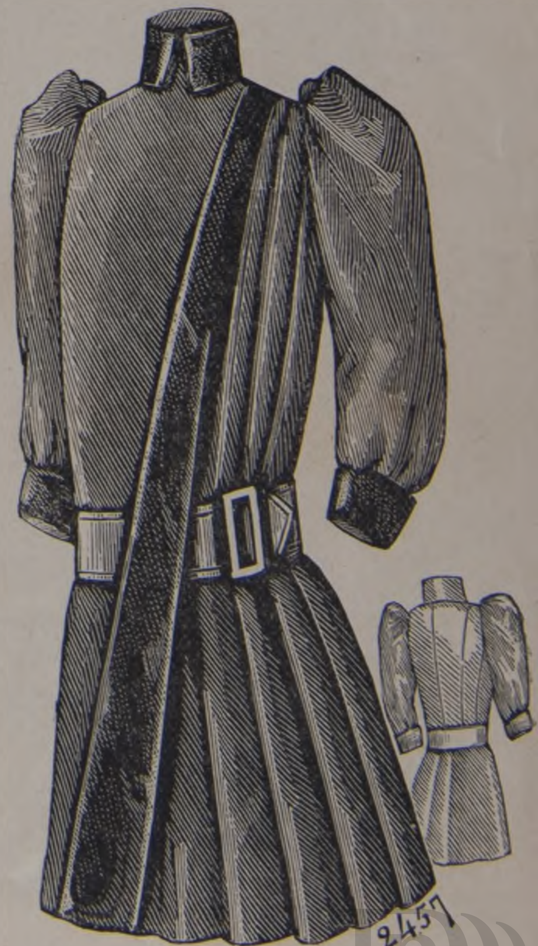
14 y 15. — Traje de niño (delante y detrás).

D. 22. — Toilette de calle . — Falda funda con cola al biés, en diagonal bucles grises, rayados de pequeñas tiras de plumas y bordeado en los bajos de una trenchilla de seda negra. Chaqueta larga en el mismo género que la falda, cerrada derecha delante por dos corchetes y bordeada de una trenchilla negra; la misma guarnición en las mangas, espaldadas y estrechas en los puños. Sombrero en paja gris, adornado de plumas y de crestas de cinta gris. Guantes gris perla. (El patron de la chaqueta está dado en la hoja de patrones dibujados nº 34.)