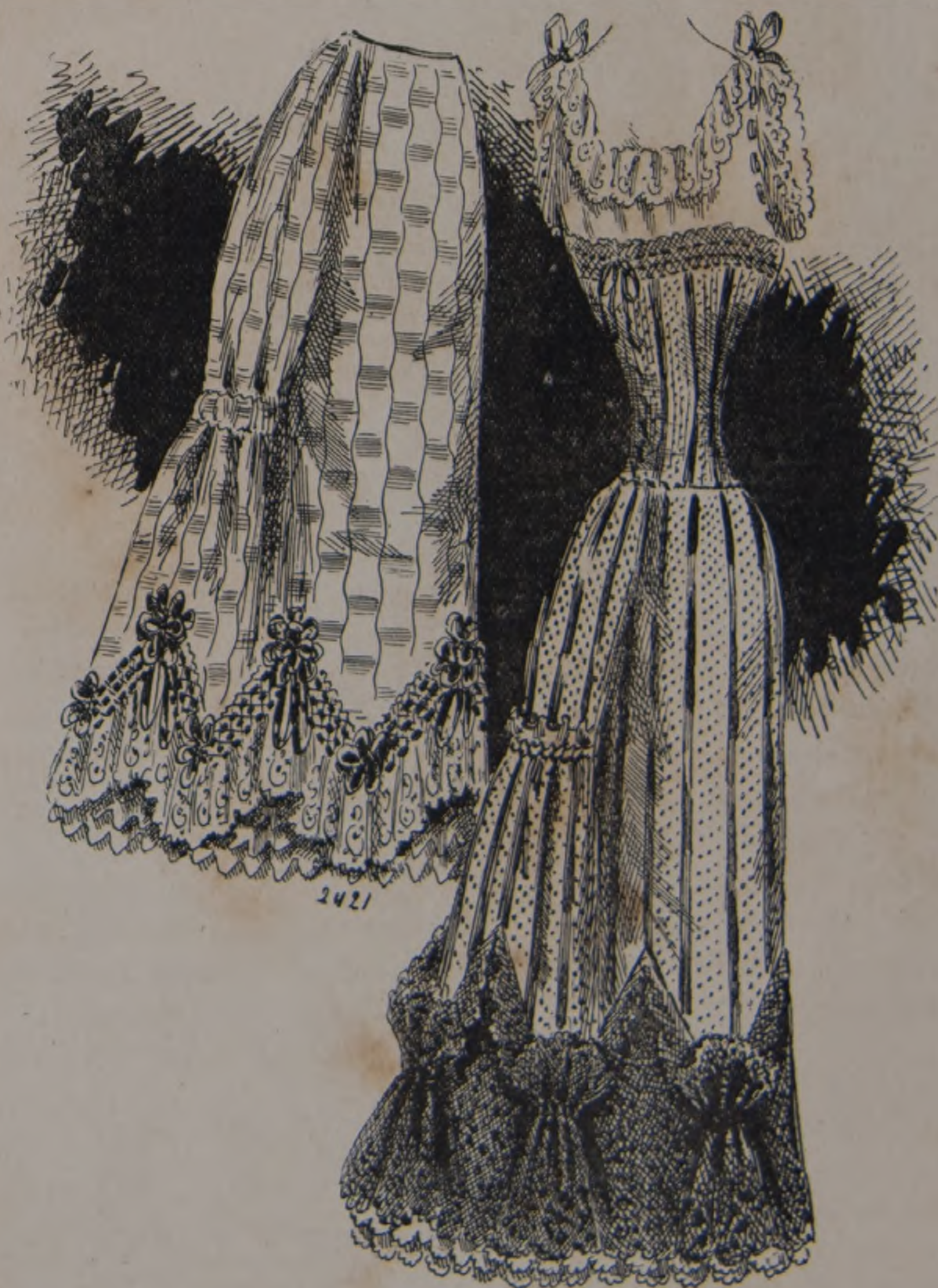
8. Falda interior. — 9. Oculita-Corset-Falda.

9. — Oculita-Corset-Falda en fular pequiné rosa y negro adornado en el bajo con volante de encaje negro coquillé. Bordura de encaje negro en el oculita corset.