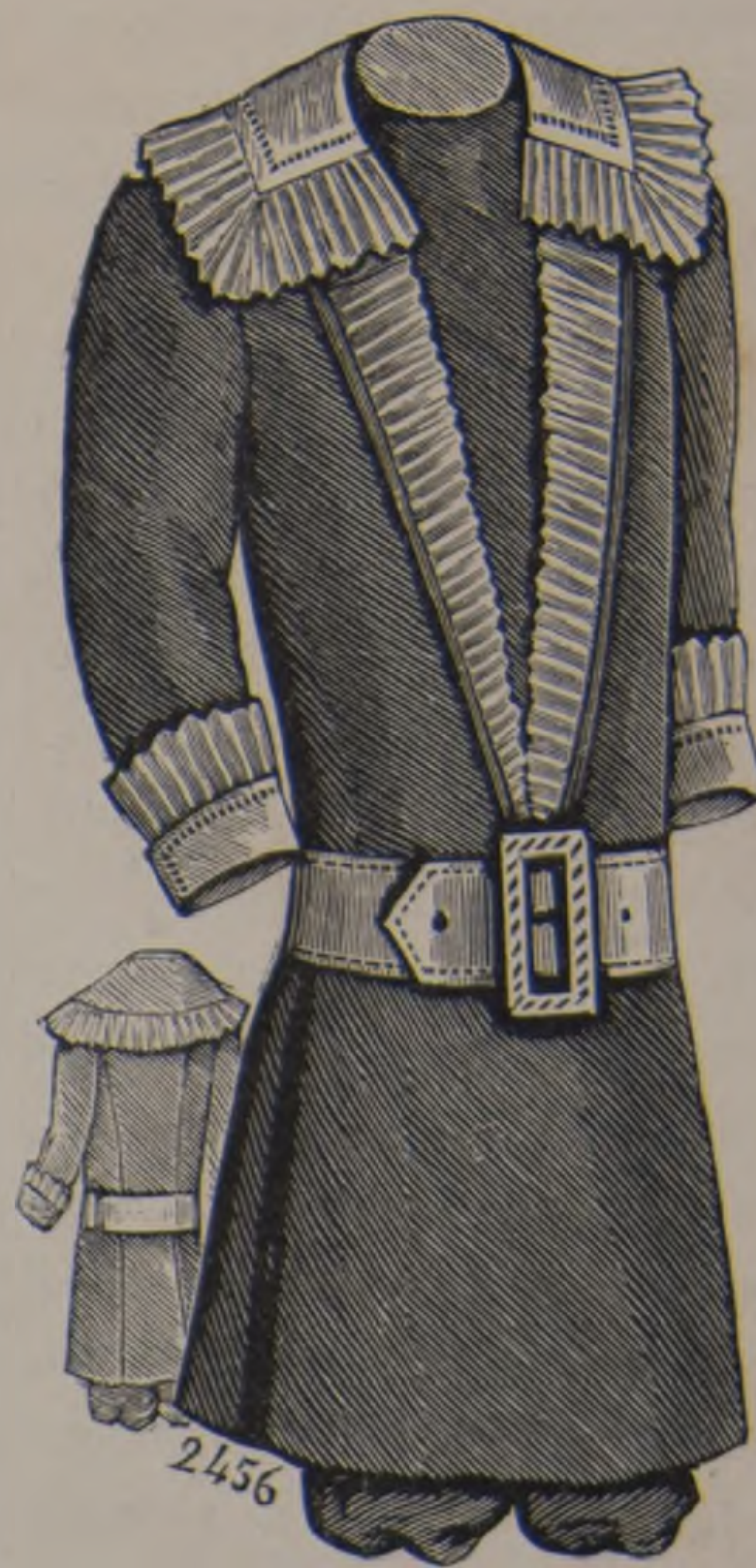
C. 20 y 21. — Traje de niño (delante y detrás).

van ha abrir la marcha. Tienen una gran importancia porque si la manera de interpretarlas es el todo como dicese corrientemente, no es menos