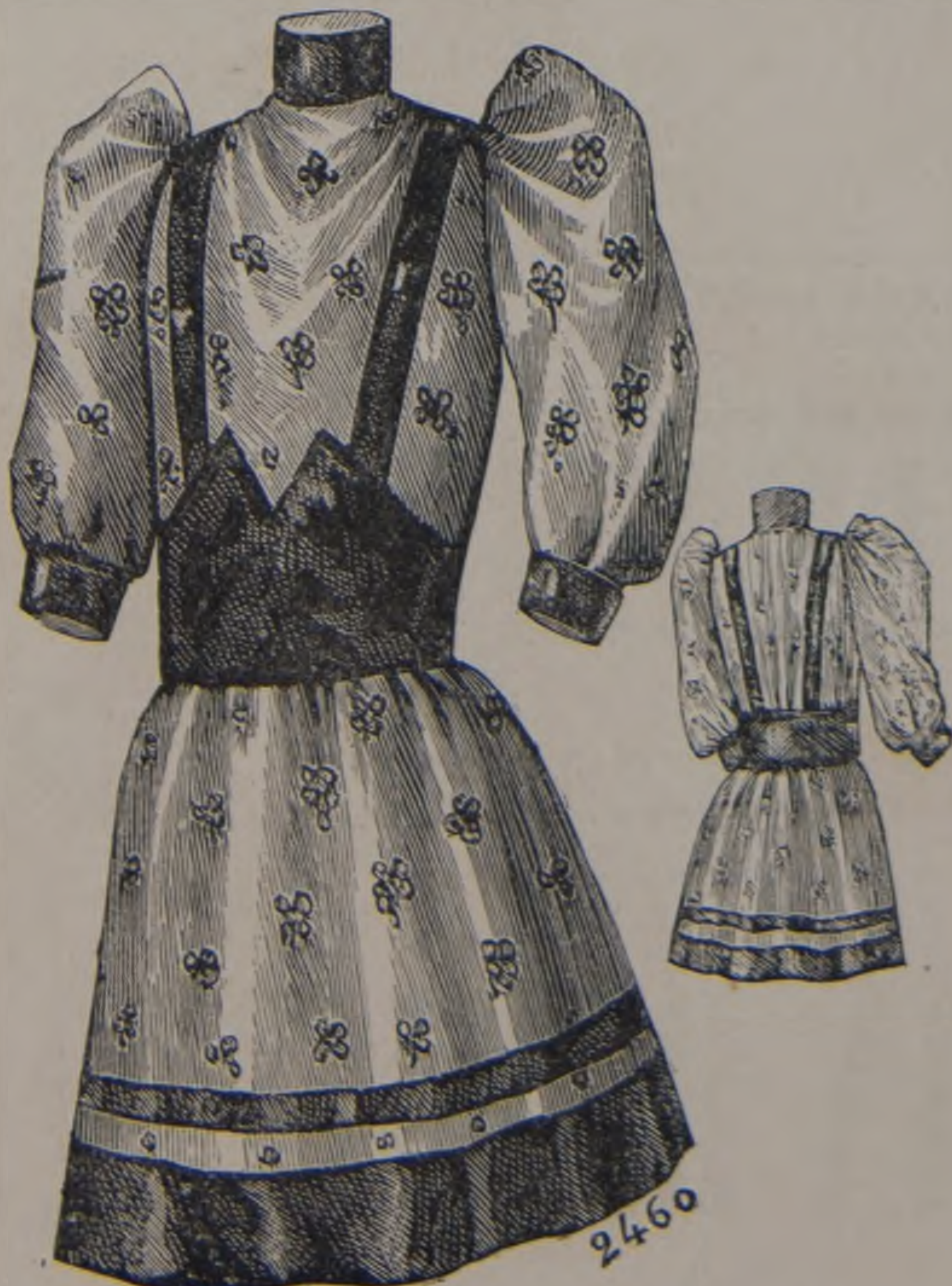
B. 18 y 19. — Traje de niño (delante y detrás).

Y aquel tonto de Pepe Primo, que había pasado su vida dejándose engañar por las mujeres aristocráticas cuya elegancia le seducía tanto, se encontraba ahora entre dos infelices, como su conquista y su criada, que no pensaban sino en hacerle dichoso, evitándole toda molestia moral y