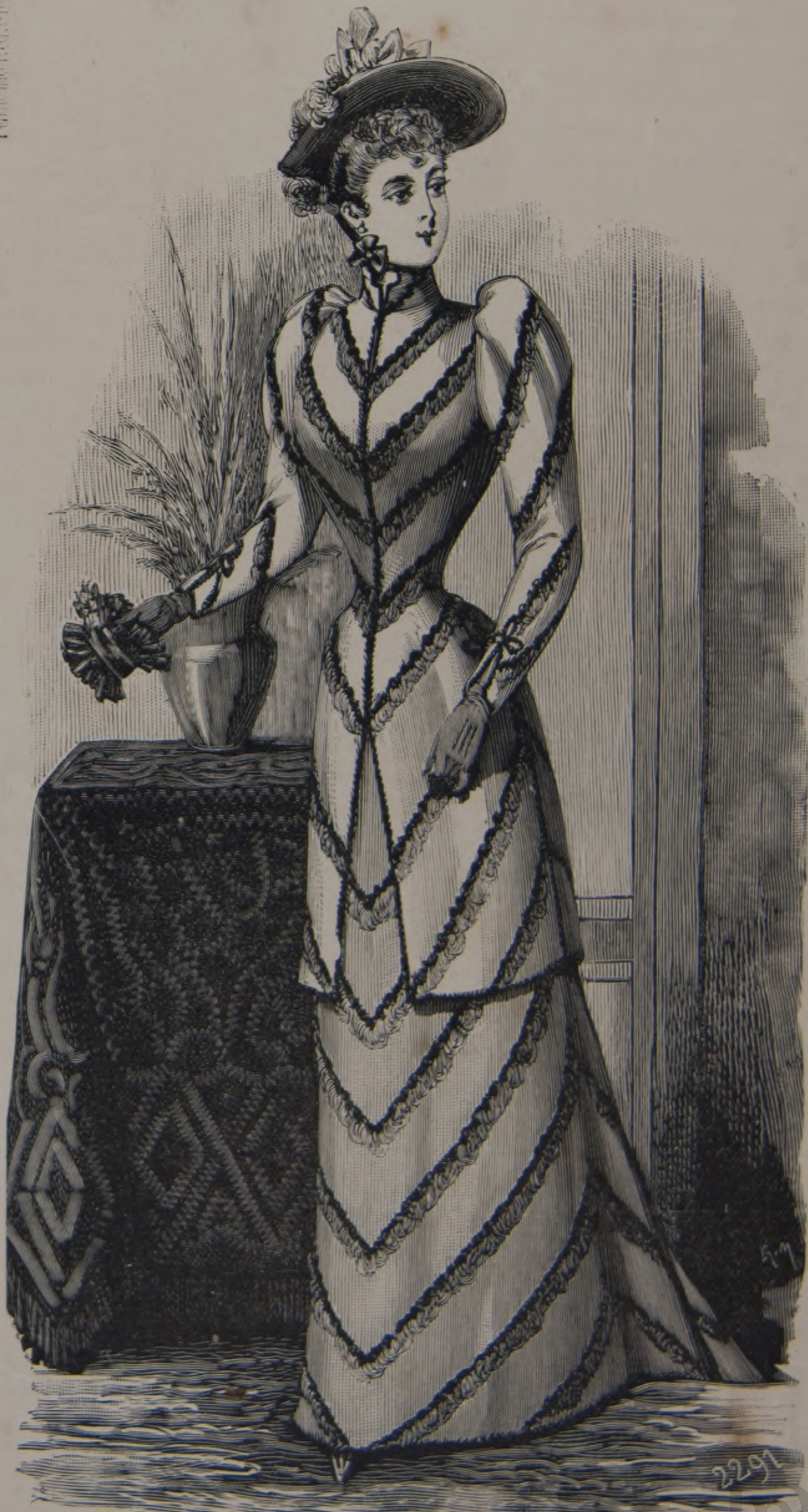
D. 22. — Toilette de calle.