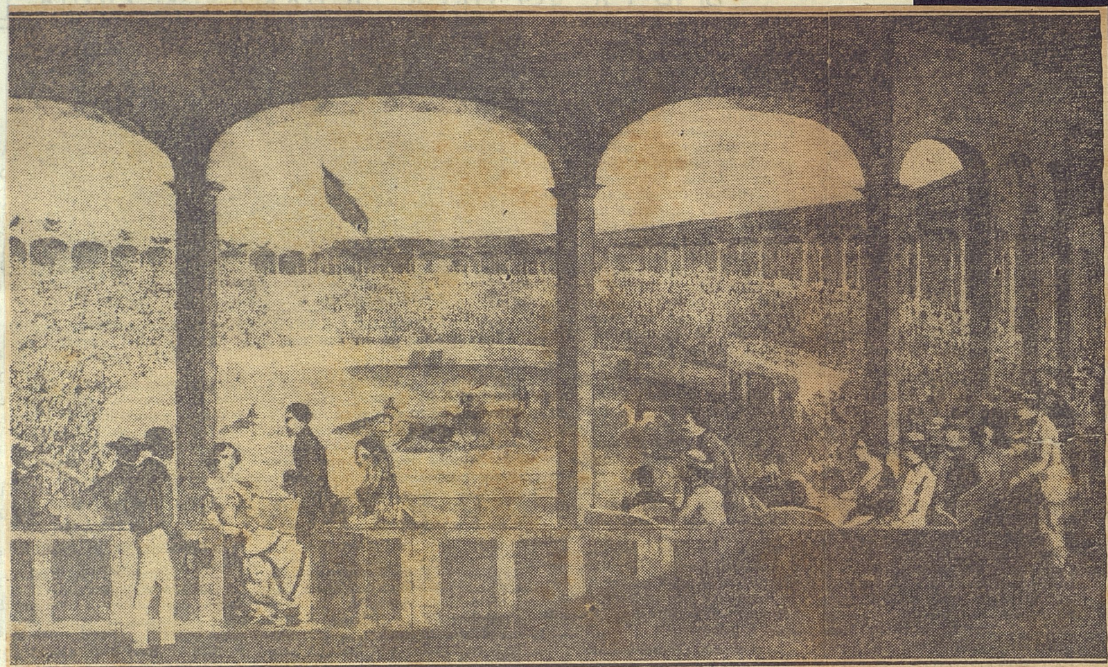
LA PLAZA DE DON ANGEL. — El ruedo taurino de La Habana se hallaba en la vieja Calzada de Infanta, en su cruce con Carlos III. En esta bella estampa de Marquier y Laplante, se ve a la "élite" habanera concurriendo a una "tarde de beneficio". Se puede notar en las indumentarias la presencia del jipi, el dril 100 y el uniforme del oficial de Su Majestad.