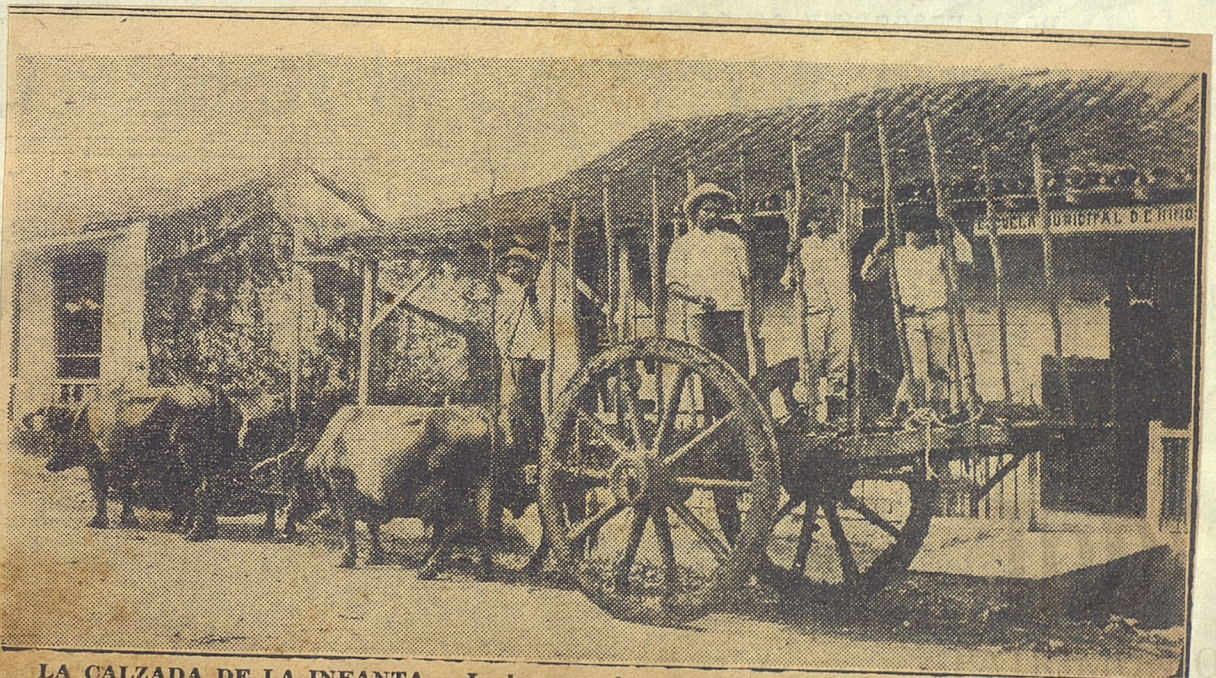
LA CALZADA DE LA INFANTA.— La hoy populosa Avenida del Presidente Menocal, era hace treinta años un camino real lleno de crugientes carretas, pasivos bueyes, y fango en abundancia. (FOTO Blaine).