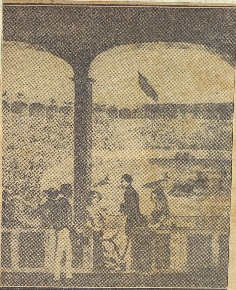
LA PLAZA DE DON ANGEL.— El ruedo taurino de La Habana III. En esta bella estampa de Marquier y Laplante, se ve a notar en las indumentarias la presencia del jipi, el dril 100 y e

...njo de Antiohenes Mene... dez, hecho este que recuerda Gu... tavo Robreño.