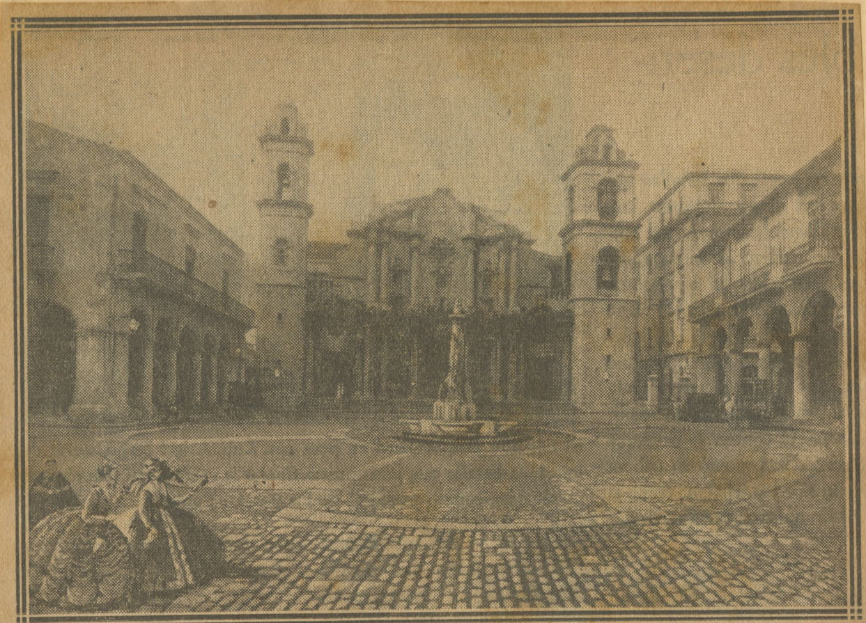
Vista general del proyecto concebido por el urbanista Forestier con la colaboración del Arquitecto Ramirez Orando y de otros proyectistas del Departamento de Construcciones Civiles y Militares de la Secretaría de Obras Públicas.