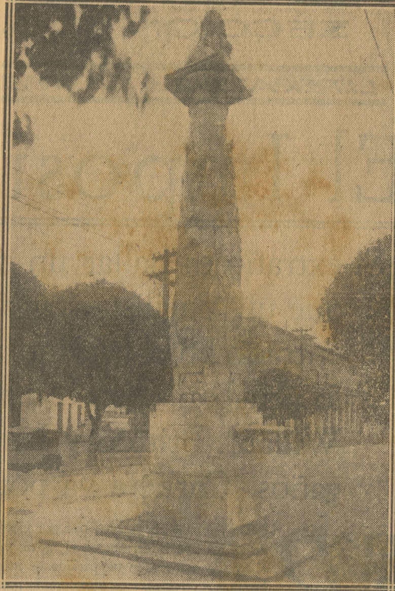
Vista de la fuente de mármol que se encuentra en la Alameda de Paula, y que se ha pretendido trasladar a la Plaza de la Catedral.

INSTITUTO VENEZOLANO DE INVESTIGACIONES LINGÜÍSTICAS Y LINGÜÍSTICAS COMISIÓN NACIONAL DE COOPERACIÓN INTELLECTUAL DE LA REPÚBLICA DE CUBA COMISIÓN NACIONAL DE COOPERACIÓN INTELLECTUAL