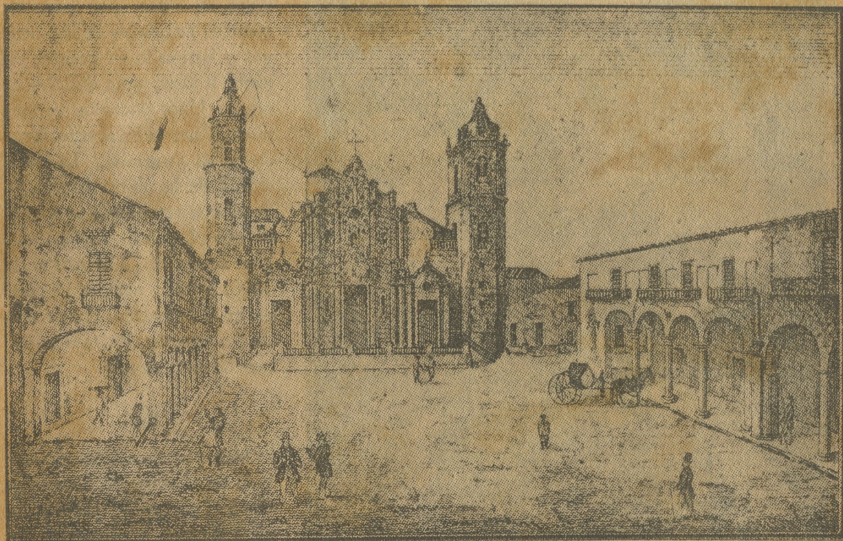
Otro grabado antiguo de la Plaza de la Catedral, en el cual puede apreciarse que antiguamente no hubo nada en el centro de la Plaza.