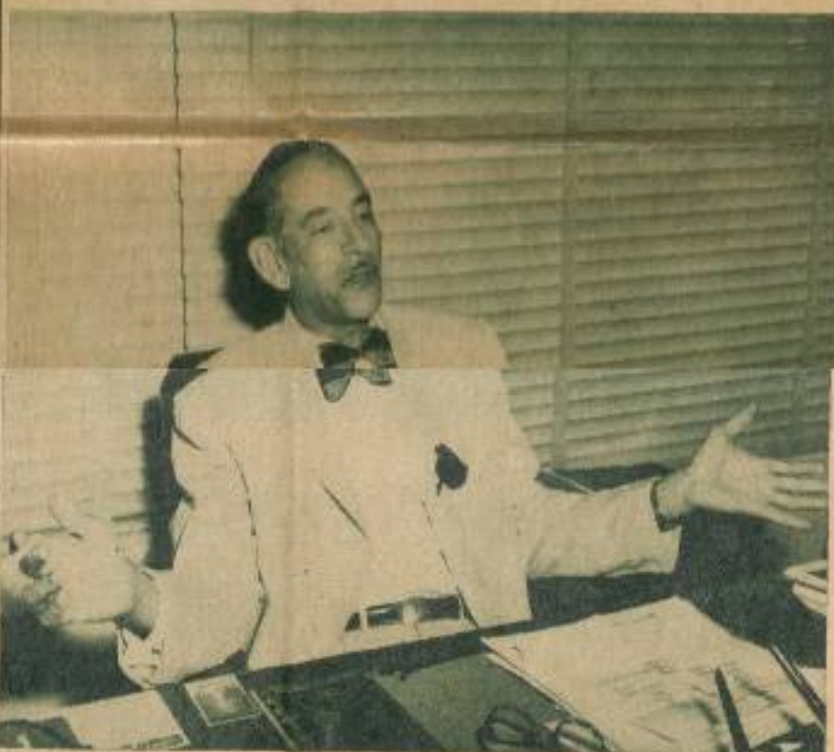
"Una técnica bancaria totalmente nueva es factor importantísimo en el desarrollo económico nacional".

Banco Nacional, la política de créditos se ha ampliado no sólo en la cuantía, sino en el tiempo; esto es, la banca comercial cubana está haciendo préstamos a largo plazo a comerciantes e industriales, lo que ha dado un impulso de muy estimable consideración al fomento industrial, a la diversificación agrícola y, en suma —termina nuestro entrevistado—, al desarrollo económico de Cuba.