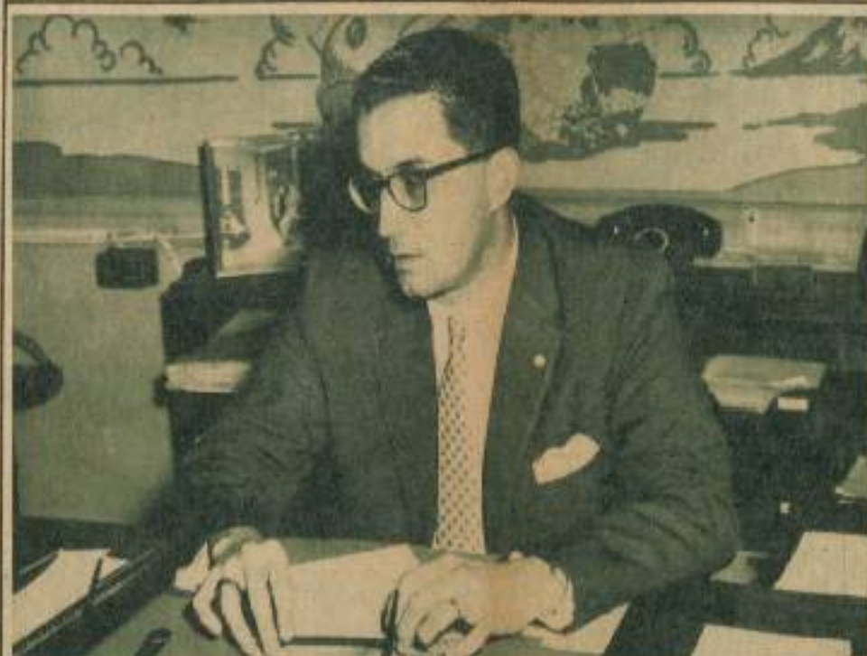
"Con la legislación bancaria, en vigor, no existe el peligro de que los bancos confronten dificultades".

(De la redacción de INFORMACION.)