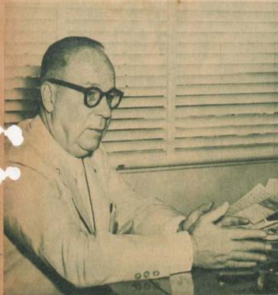
"Dada la estructura económica y financiera actual, los bancos cubanos no pueden tener serios problemas".