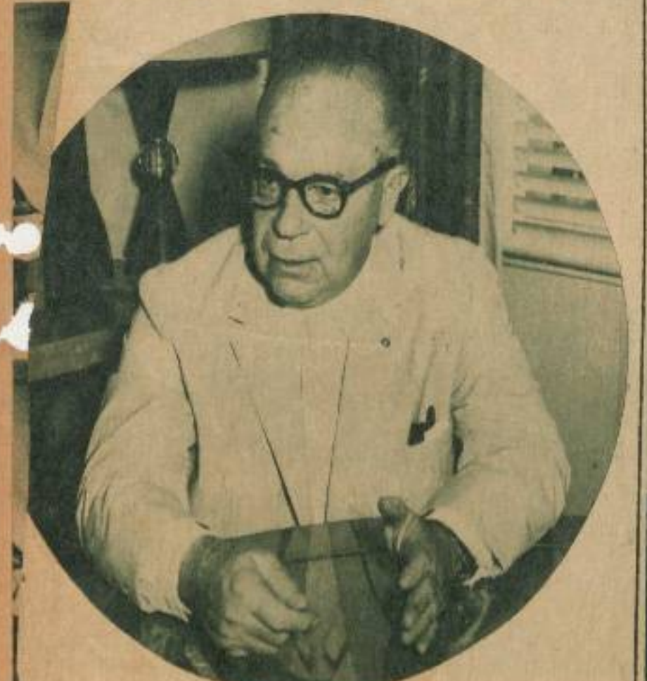
"La eficacia del sistema bancario ha impulsado el desarrollo económico nacional".