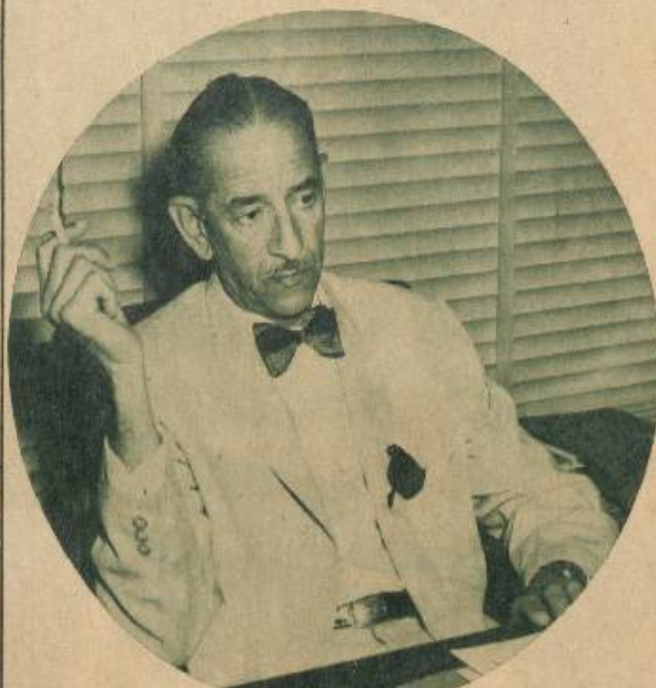
"Se demostró que en Cuba había una gran reserva de banqueros".

—Precisamente, cuando le hablaba de que en virtud de la existencia del Banco Nacional, no era de gran importancia el hecho de que los bancos comerciales tuvieran un gran monto de efectivo, porque pueden reedentarse sus valores en cualquier momento, apunté otro de los grandes beneficios del sistema bancario cubano que tan directamente han contribuido al desarrollo de la economía nacional. Antes la tendencia de los bancos era a préstamos a corto plazo, precisamente para no comprometer su efectivo. Desde la creación del