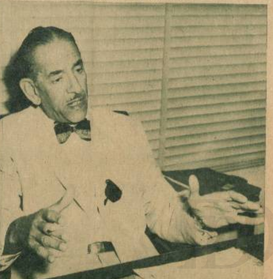
"La economía de guardar se transformó en economía de gastar".