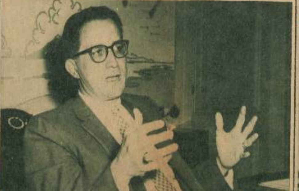
"Cualquier banco cubano puede tener el efectivo que necesite en caso de emergencia".