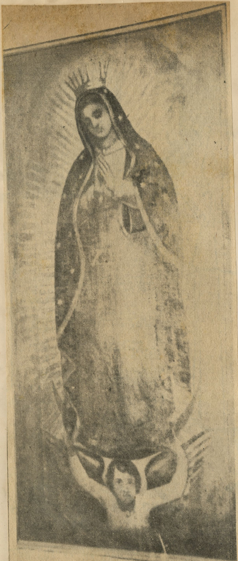
Antiguo óleo de Nuestra Señora de Guadalupe, que se conserva en la sacristía de la iglesia de La Caridad. Se le concede gran valor histórico y artístico.