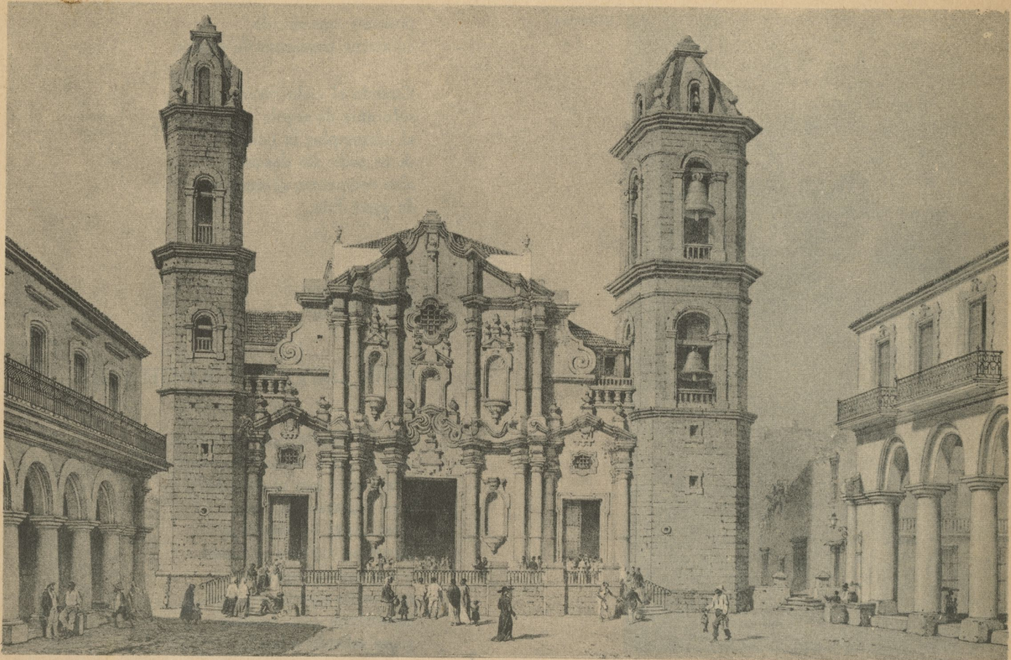
LA CATEDRAL DE SAN CRISTOBAL DE LA HABANA Y PARTE DE LA PLAZA DE SU NOMBRE Espléndido grabado en el que aparecen, no sólo la Iglesia Catedral, tal como se encontraba a mediados del siglo XIX con las primitivas terraza y escalinata, sino también las casas del Marqués de Aguas Claras (izquierda), y del Marqués de Arcos (derecha), según dibujo de Hoefler, litografiado sobre piedra por Eugenio Cicéri y Felipe Benoist, impreso por Lemercier, París, y editado en 1854 por M. Knoedler, de Nueva York.