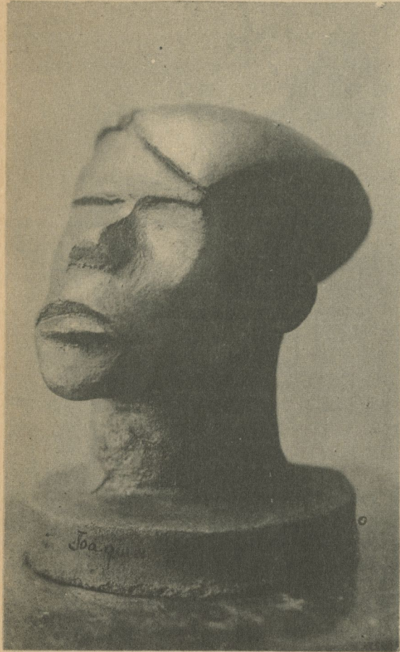
Típico indígena nicaragüense. Escultura en barro, de Zavala Urtecho.

Quizá hasta deseaba que yo dijera la expresión abierta.