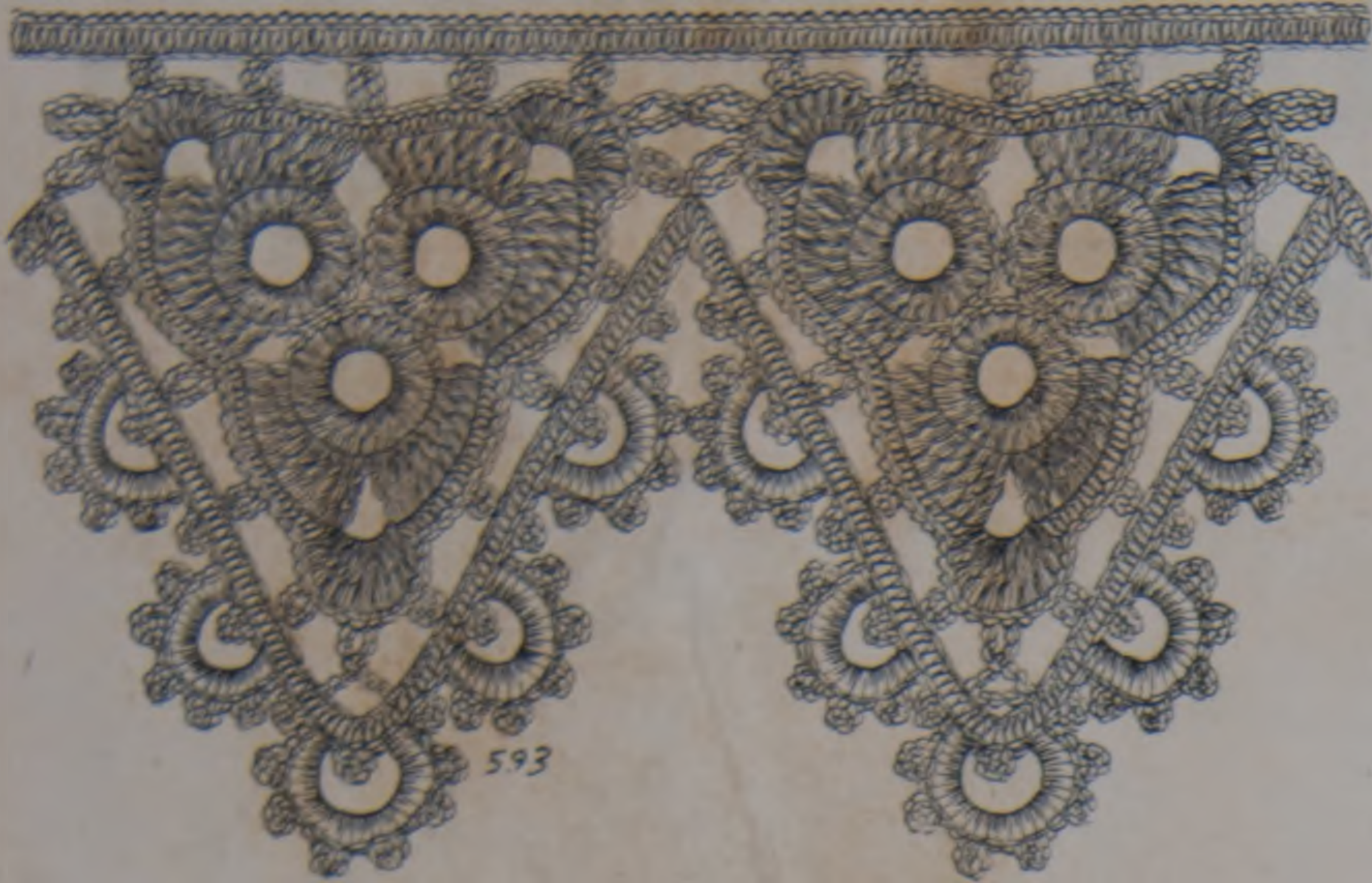
4. — Encaje al crochet.

más variados surtidos, que de seguro quitarán el sueño á las cubanas. Por el L. Diaz sabemos que La Granada abrirá próximamente sus nuevos almacenes en la finca que de nueva planta ha construido y que constituirán una verdadera novedad; pues los propietarios de La Granada , rompiendo con antiguas tradiciones, inungurarán con la nueva casa, nuevo sistema de venta á la moderna, esto es á precios fijos, sin el rutinario regateo y vendiendo generos tan buenos como siempre los ha vendido á precios ventajosísimos. En una palabra, La Granada se transforma en un establecimiento verdaderamente fin de siècle al estilo de los mejores de Paris y Londres.