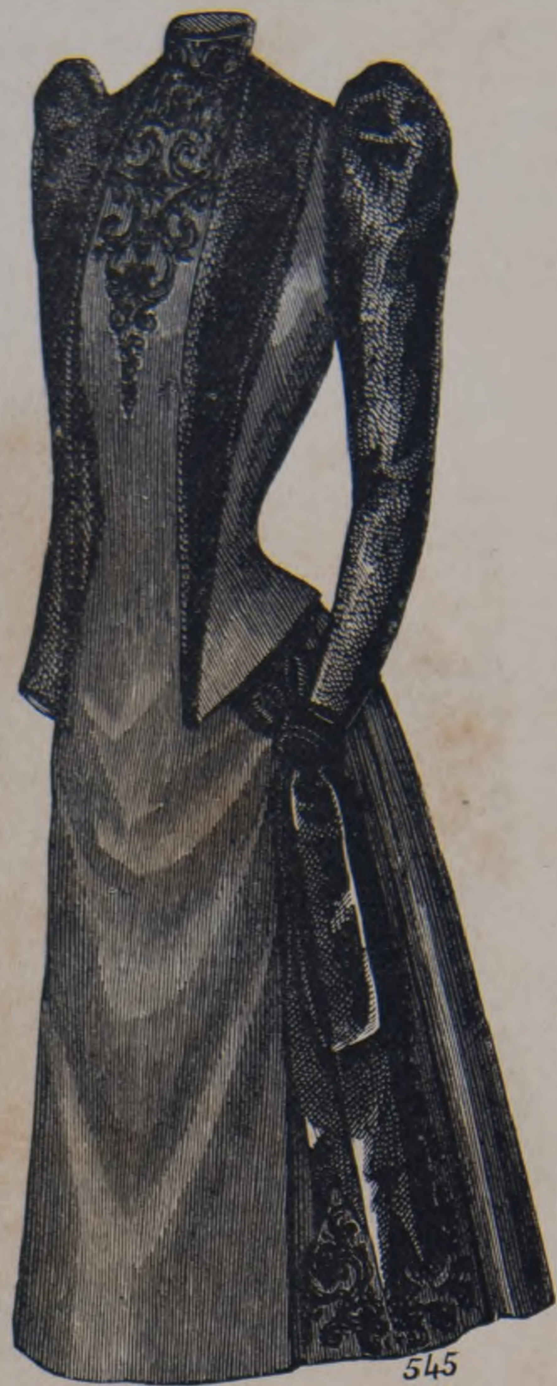
18. —Vestido de jovencita.

doble barra en el redondo y reunirlo con dos primeras pasando el crochet por encima; 5 puntos al aire y continuar las ramas como en la primera estrella. Cuando se tenga un largor suficiente, trabajar á lo largo haciendo de cada lado, una primera vuelta de la manera siguiente: Entrar en el primer agujero; hacer una barra, 5 puntos al aire, 1 media barra en el agujero de la estrella que sigue; continuar desde la señal. — 2ª vuelta: barras intercaladas de dos puntos al aire. — 3ª vuelta: Entrar en el primer agujero; hacer dos barras intercaladas de dos puntos al aire; 3 puntos al aire; pasar un agujero, 1 media barra, 3 puntos al aire; pasar un agujero, 2 barras intercaladas de dos puntos al aire. En la vuelta que sigue se hacen 12 triples