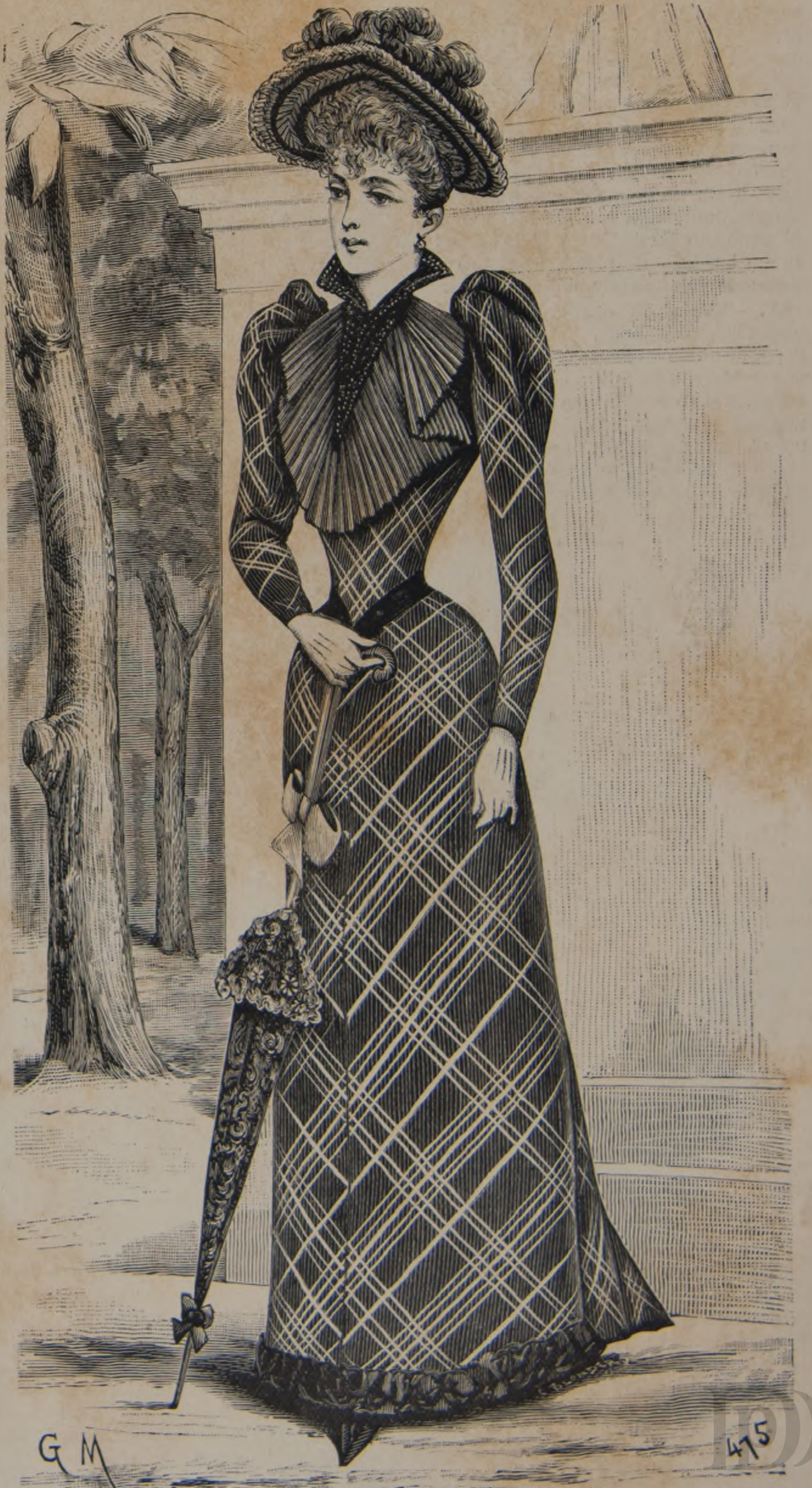
22 y 23. — Trajes de otoño.