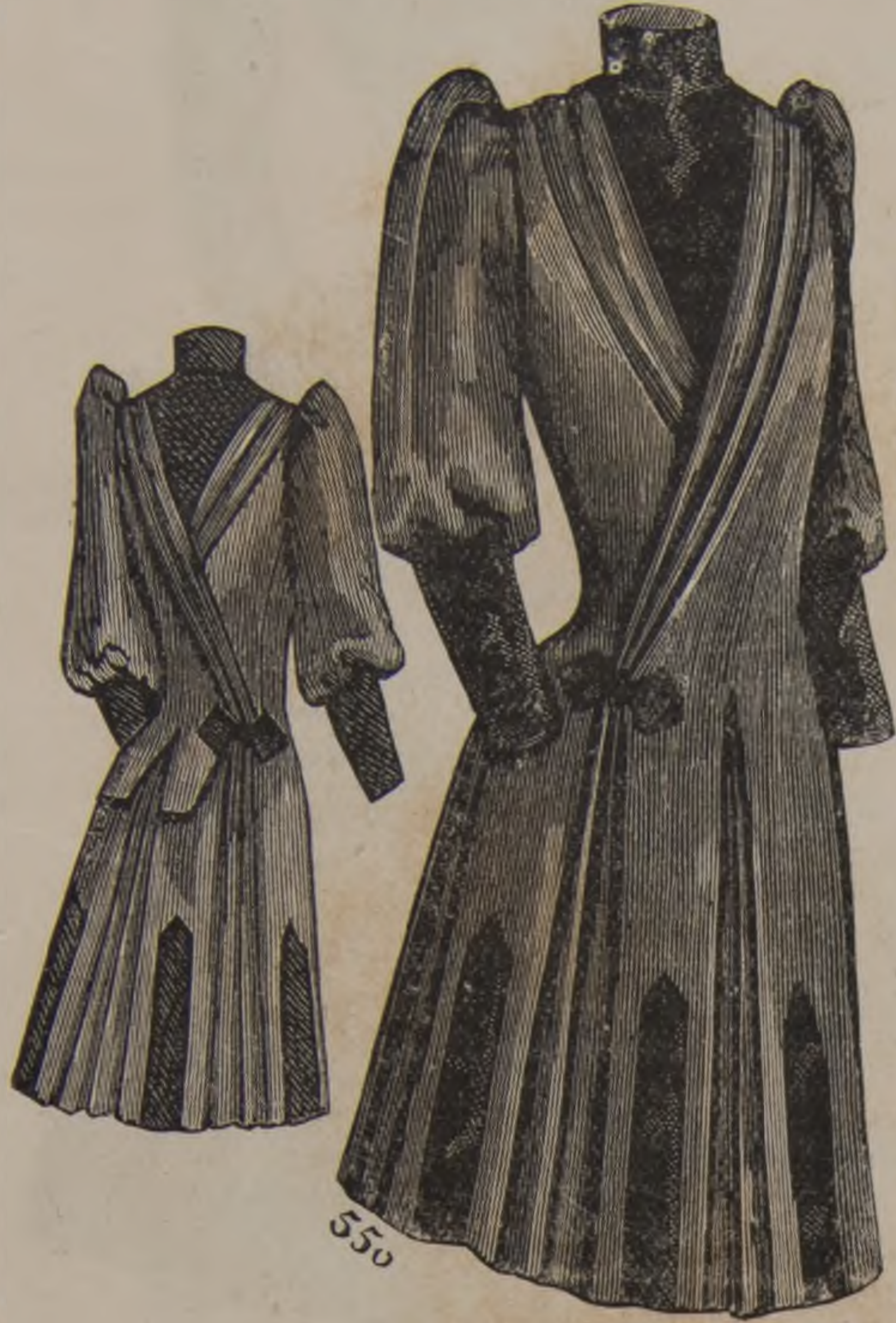
A. 9 y 10. — Traje de niña (espalda y delantero).

Entre los principales que durante todo el verano han permanecido abiertos, ofreciendo en los dias de recido de sus respectivos dueños gratisimas reuniones de confianza à los amigos de la casa, los de la preciosa quinta, con verdadero dechado de exquisito gusto, que saludan en el barrio del Cerro nuestro distinguido amigo, el Exmo. Sr. D. Francisco de las Santos Guzman y su bella y distinguida esposa, donde acude todos los jueves la pri-