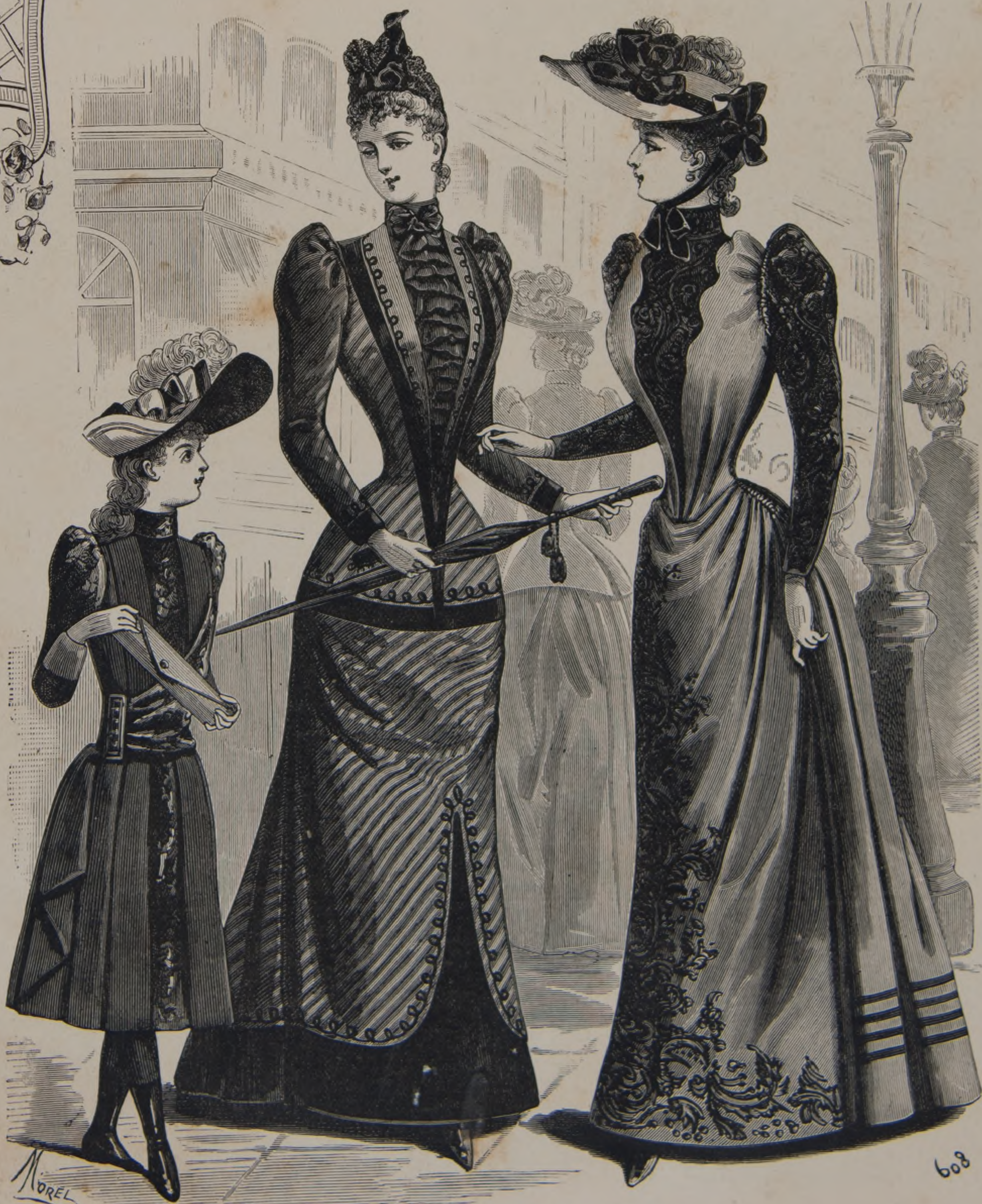
1. Niña de 10 años. — 2 y 3. Trajes de otoño.

invencion que éste año han desplegado las modistas y costureras para presentar en los escaparates todo género de vestidos, encages, sombreros, sombrillas, guantes, calzado, sombreros, diges, joyas, cuanto pueda soñar la coqueta más pretenciosa ó la señora más á la moda; La moda!