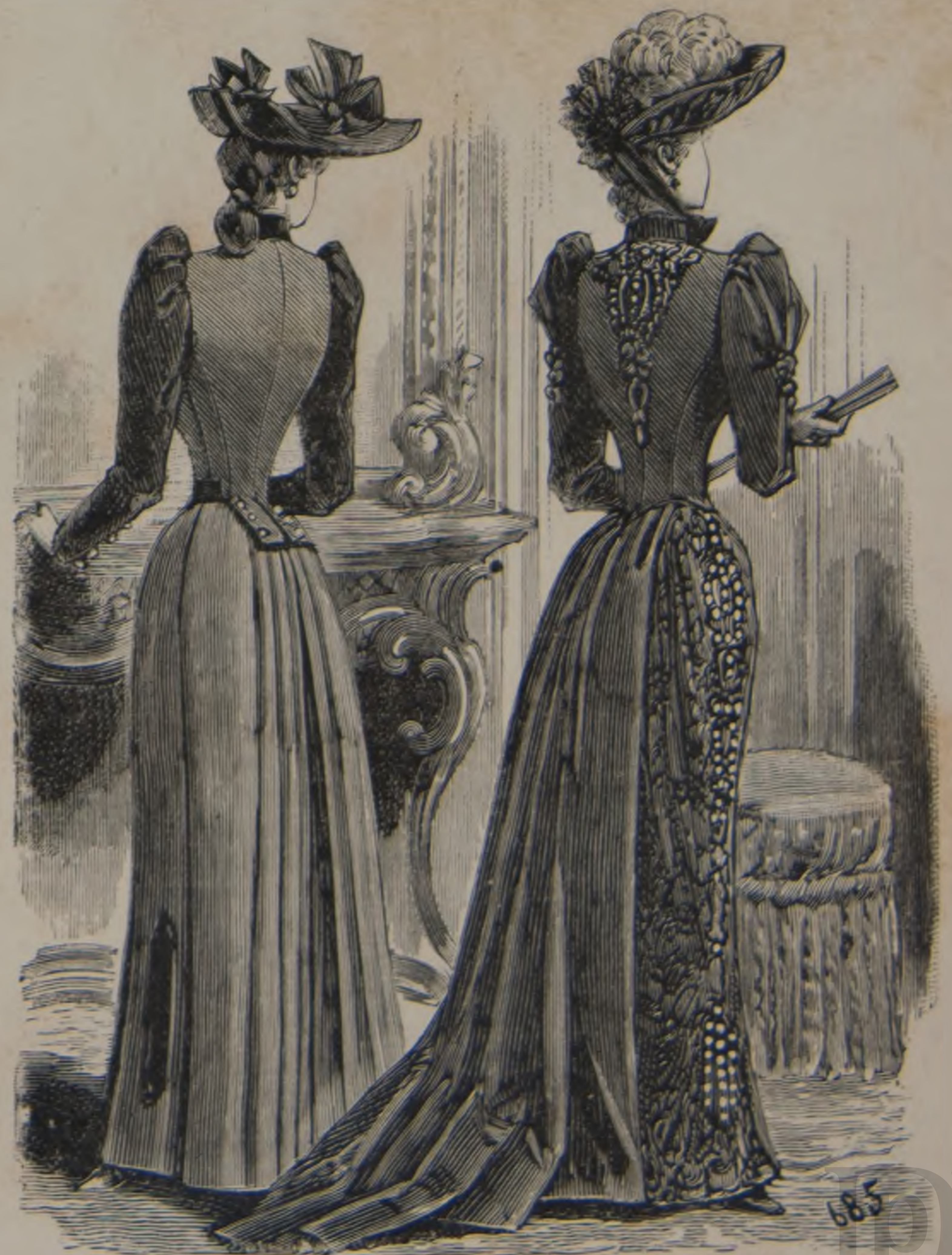
15 y 16. — Trajes de calle y ceremonia.