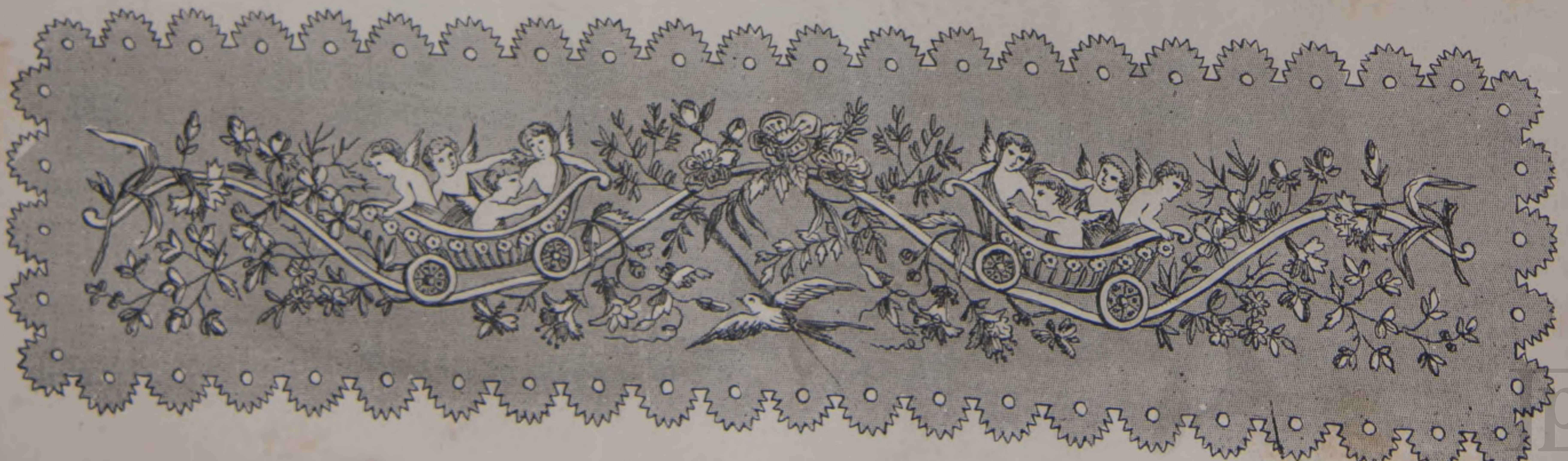
6. — Tapete para el techado.

Ello es que los más distinguidos temporadistas habaneros se reparten entre uno y otro punto y que procuran á porfia y en competencia hacer todo la más animada y amena posible su estancia en ellos durante los meses del verano. Cuenta al efecto Marianao con una sociedad tan elegante, culta y selecta como el Habana-Yacht Club , de la que son miembros nuestros más conocidos sportmants, la cual, además de llenar muy cumplidamente su principal objeto de organizar regatas y excursiones marítimas, muchas de las cuales se ven amenizadas con la presencia de bellas y distinguidas damas que, si sirven de gran atractivo en estos paseos por mar, suelen ser causa, en cambio, de que se mareen los más ariesgados marinos, además de esto, repetimos—suele ofrecer espléndidas fiestas bailables á los temporadistas, fiestas que se ven siempre favorecidas por muy selecta concurrencia. En el verano actual han sido escasas las que el Yacht Club ha realizado, no sabemos porque motivos, aunque algo pudieron haber influido en ello las funciones teatrales que últimamente han tenido efecto en el lindo coliseo de Marianao y las fastuosas reuniones que se han celebrado en algunas casas particulares habitadas por familias tan opulentas como espléndidas. Entre estas fiestas de caracter particular, las más notables que