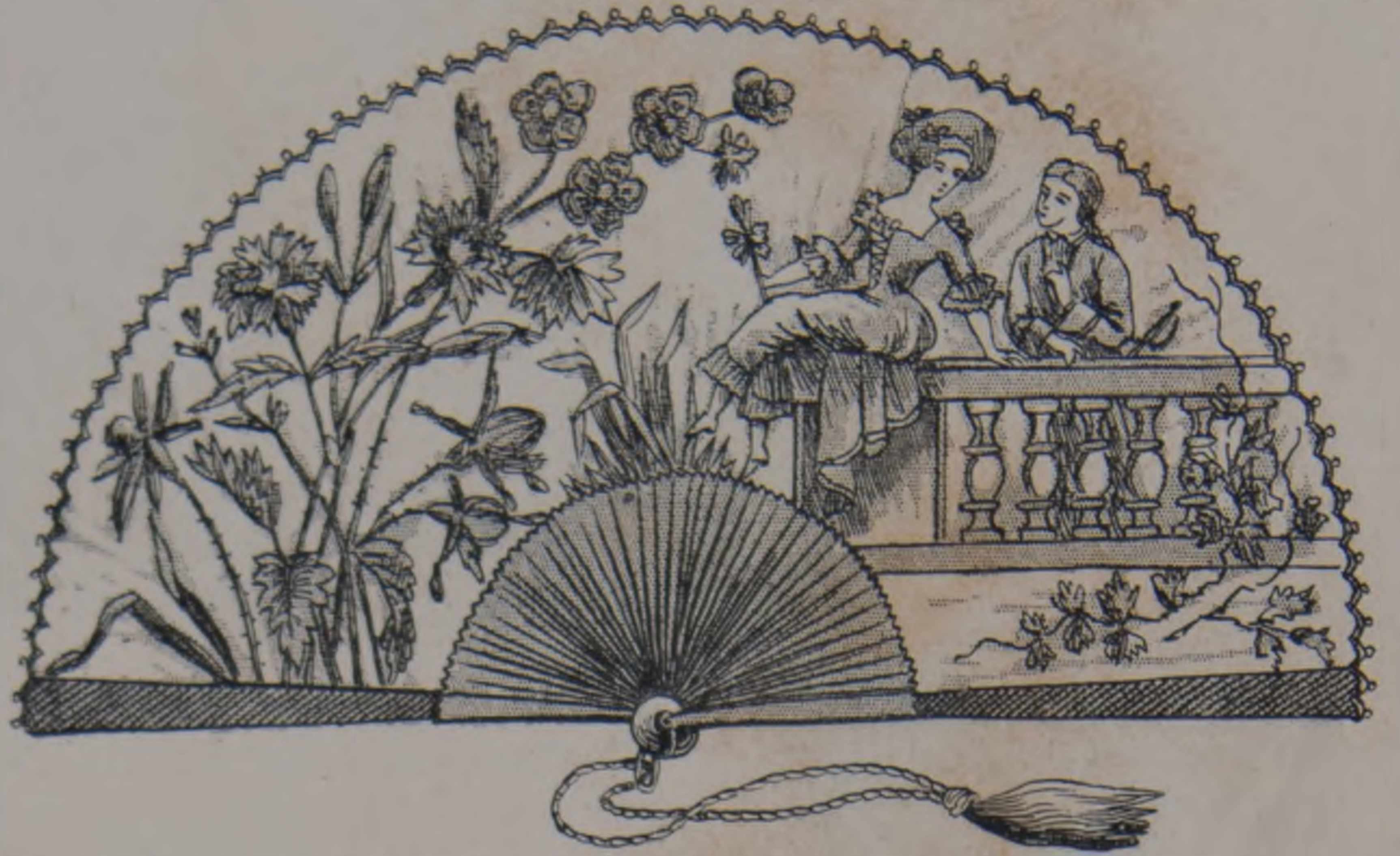
7. — Abanico.

Así como entre los sitios de veraneo de fuera de la isla preferida por los cubanos, ó los residentes en Cuba —lo que es igual para el caso— Saratoga es uno de los que figuran en primer término, entre los pueblos de temporada Marianao y el Vedado son los dos que obtienen la preferencia. Grande es, sin duda, la importancia que el segundo de estos puntos ha quitado al primero de algunos años á esta parte; pues antes, cuando el Vedado no se habia convertido aun en un caserío tan bello y tan elegante como lo es hoy, Marianao era el pueblo de temporada á la moda entre las personas distinguidas. La proximidad á la capital; la facilidad de su comunicacion con la misma por el ferro-carril, cuya empresa ha tenido generalmente su servicio perfectamente organizado, pues todos los días sale un tren cada hora de la Habana para dicho pueblo y vice-versa, siendo muy contadas las ocasiones en que ha ocurrido alteracion en el itinerario; la agradabilísima temperatura que en Marianao se disfruta y lo sana que es la atmosfera que allá se respira; lo pintoresco, en fin, del lugar, rodeado de preciosas campiñas y