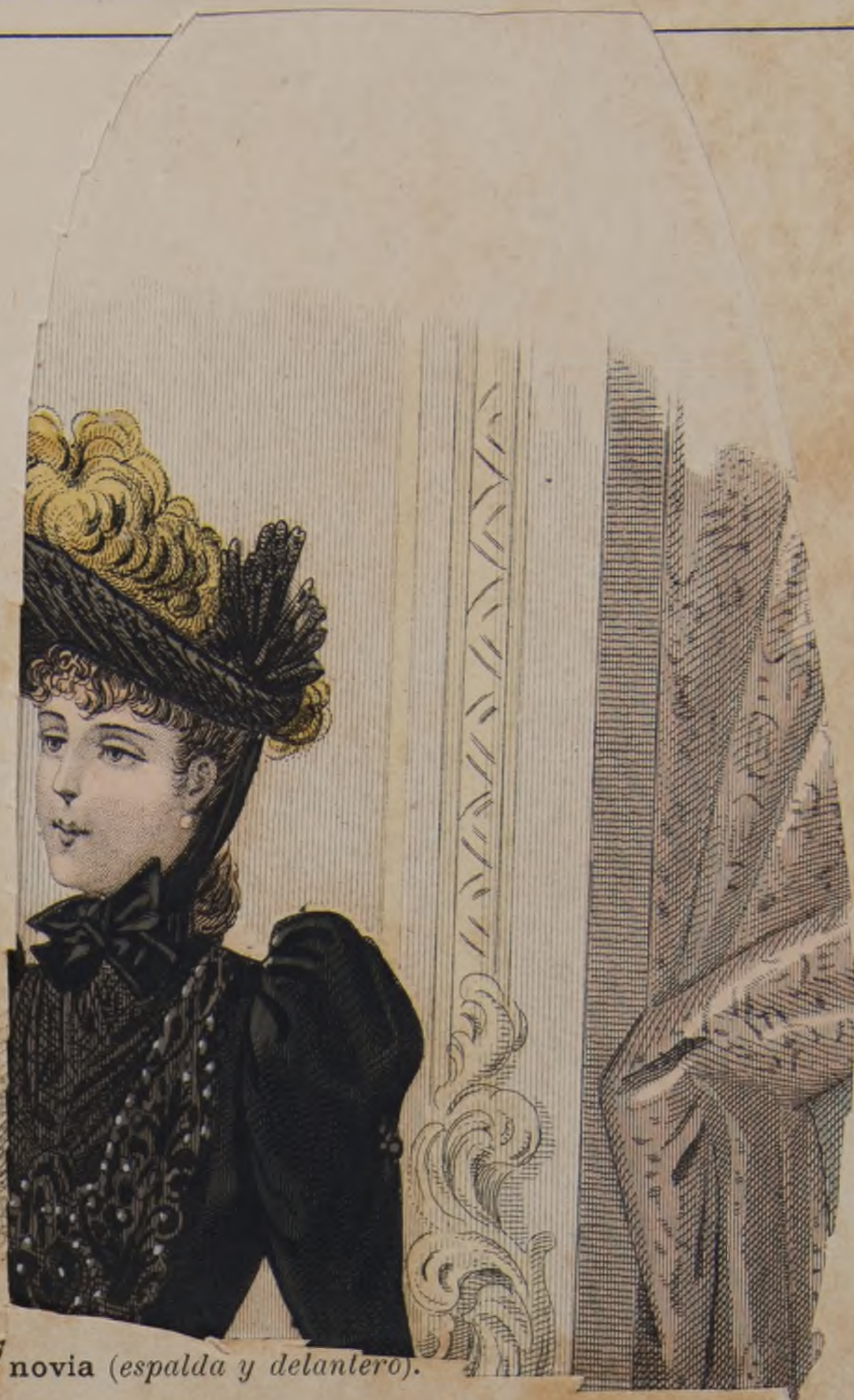
20 y 21. — Peinado de novia (espalda y delantero).

peries de la espalda cruzadas van aplicadas sobre el cuerpo. Plastron de terciopelo detrás y delante. Mangas bufantes con altos puños de terciopelo. Aplicaciones de terciopelo cierran la polonesa delante y terminan la draperie por detras. Este modelo es muy bonito de paño paja terciopelo azul antiguo. (El patron del traje lo damos en la plana de patrones.)