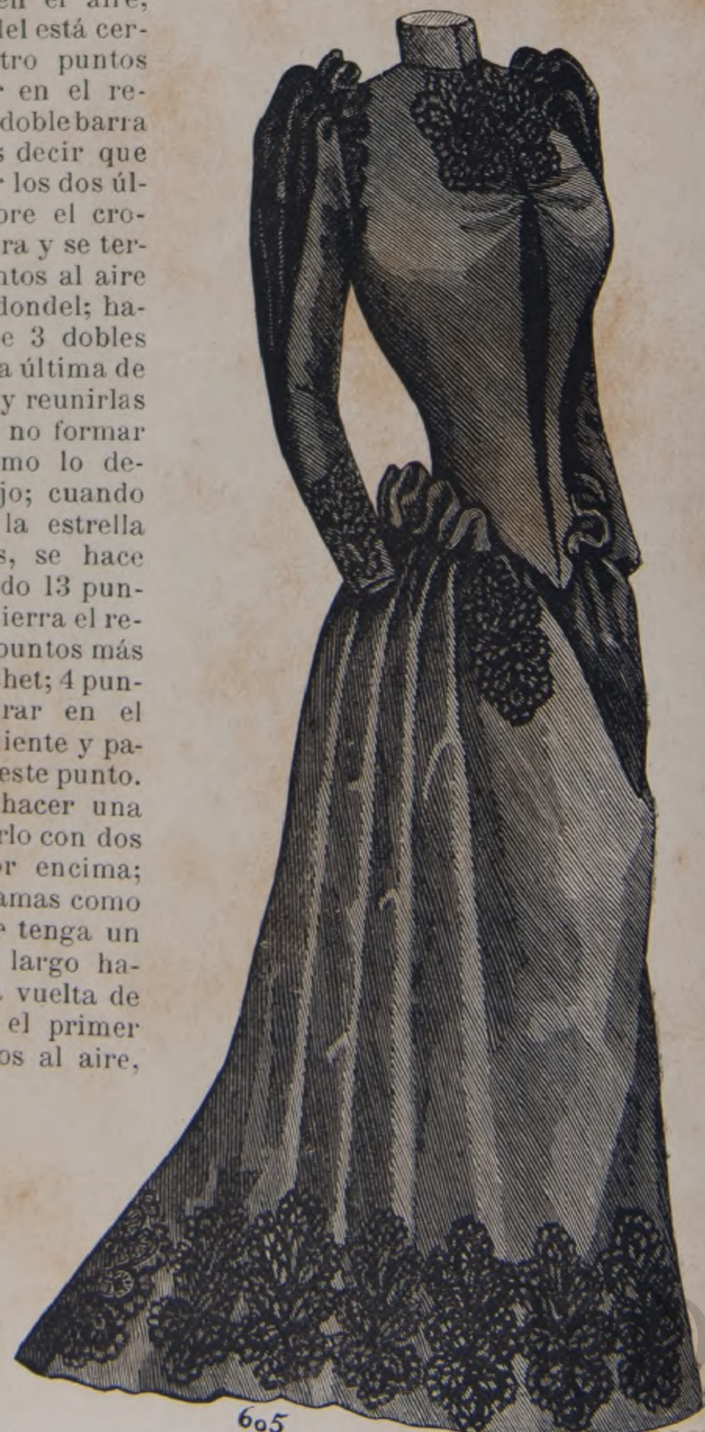
19. —Vestido Henri III.