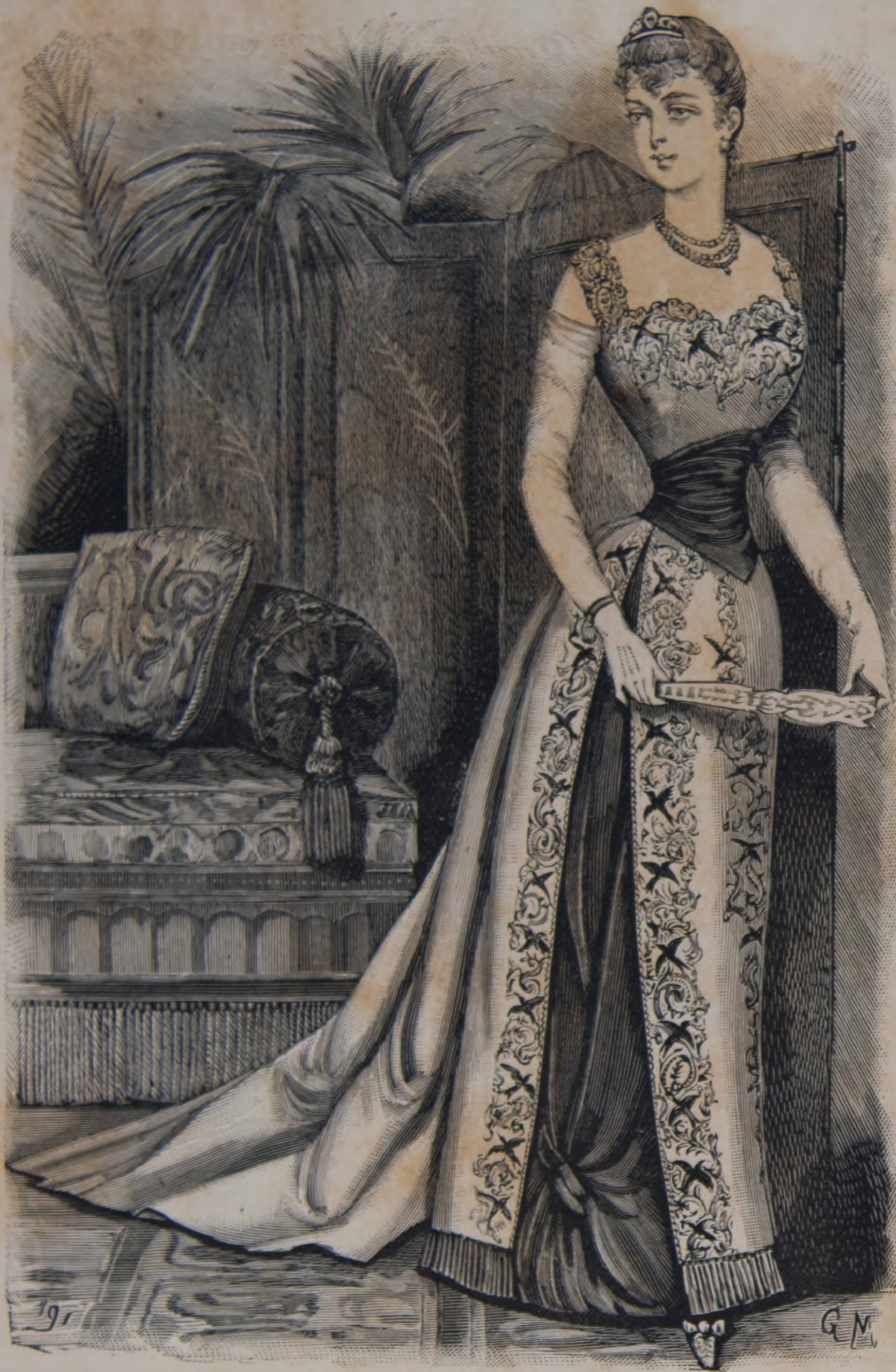
17. —Traje de baile.