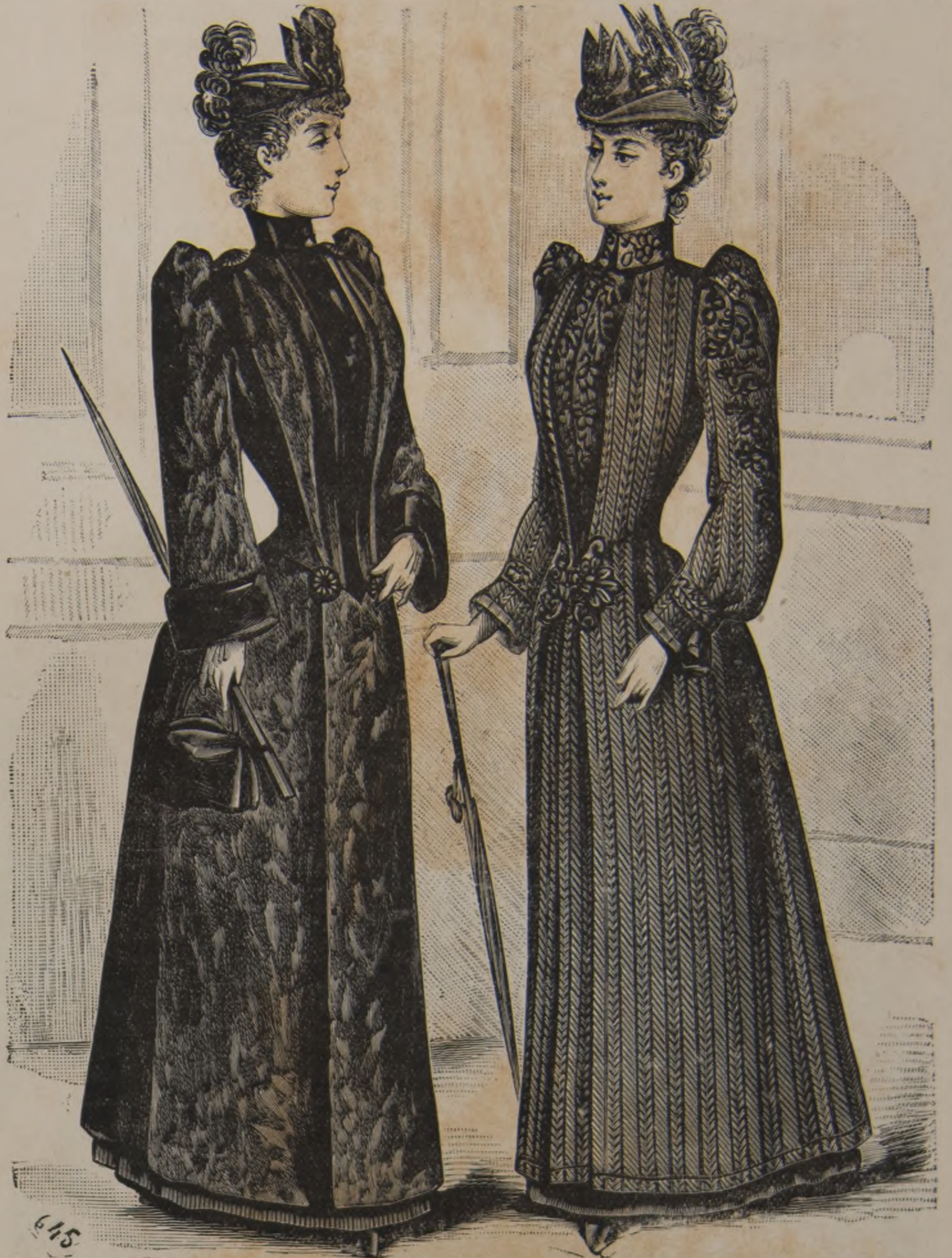
13 y C. 14. — Abrigos de otoño.