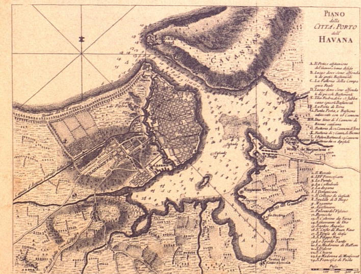
PLANO DE LA CIUDAD Y PUERTO DE LA HABANA Grabado italiano del siglo XVIII, de Giuseppe Pazzi.

Como resumen de la vida colonial cubana, en lo que se refiere al gobierno y administración por la Metrópoli, en estos primeros años del siglo XVII, nos parece oportuno traer a estos recuerdos el juicio que de dicha época hace la historiadora norteamericana cuyo valioso ( Continúa en la pág. 71 )