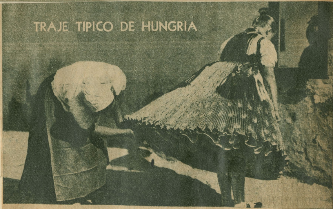
Cuando una muchacha húngara tiene que concurrir a una fiesta, da mucho trabajo. Esta falda es una cosa complicada. La modista va enlazando pliegue sobre pliegue