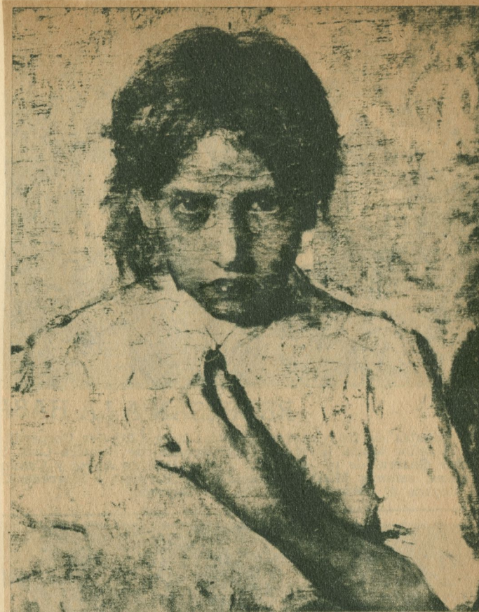
Leopoldo Romañach: "La convaleciente".

Hoy se celebra, con diversos actos, el "Día del Artista Plástico". Pintores, escultores y dibujantes festejan con alegría su "día", que viene siendo una compensación al esfuerzo por elevar el nivel del arte nacional. En esta página, como homenaje a esa clase eminente, reproducimos algunas fotos de cuadros famosos de nuestros pintores, algunos en el Museo Nacional, otros en colecciones particulares.