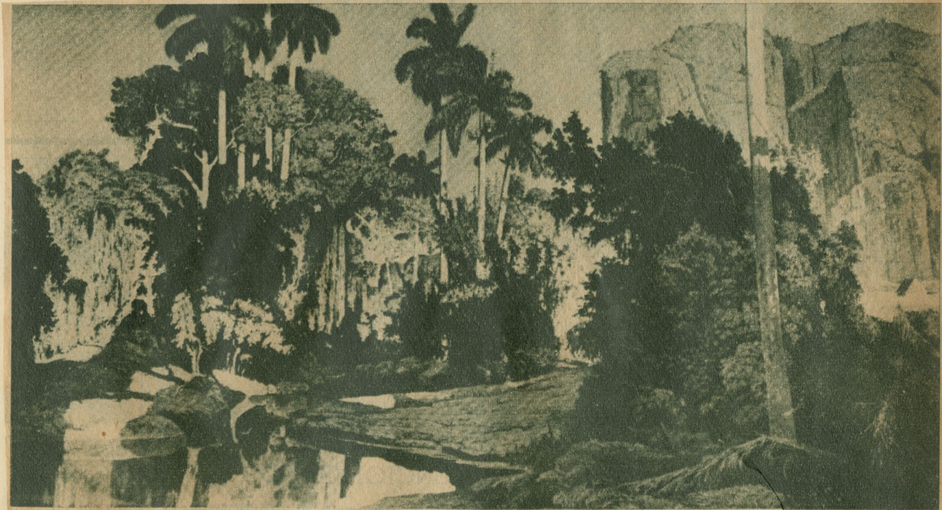
Domingo Ramos: "Paisaje cubano de Viñales".