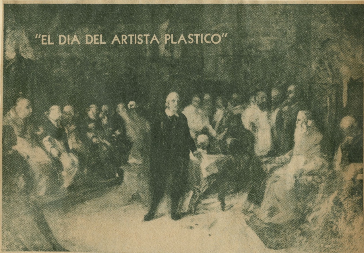
Miguel Melero: "Colón ante el Consejo de Salamanca".