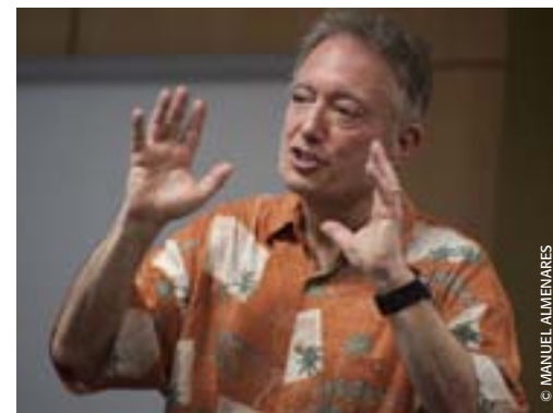
Michael Fine (Estados Unidos) prestigioso productor musical y compositor. Ganador del Premio Grammy como productor clásico en el año 1992.

En cuanto a la obra, un hecho grandioso es cuando entregas la partitura a los intérpretes y la ejecutan a su manera. Ellos tienen mucho que decir sobre la pieza que están leyendo, y en muchas ocasiones eso es más interesante. El pasado año escuché la ejecución de una de mis obras... y mientras la oía, pensaba: « ¿Yo escribí eso?»; el intérprete era tan íntegro, que encontró cosas que no sabía que estaban en la partitura. Todo este intercambio es muy personal. De la misma manera,