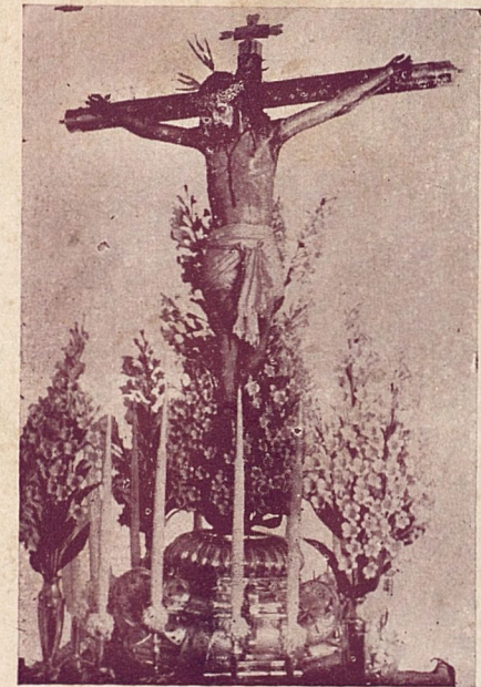
MILAGROSO CRISTO DE LA VERA CRUZ

Auspiciada por la CORPORACION NACIONAL DEL TURISMO