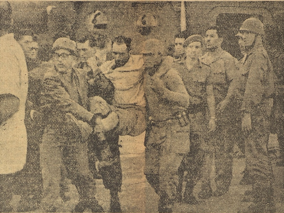
Miembros del ejército efectúan labores de salvamento en las provincias afectadas por el paso del ciclón. Su trabajo en ese sentido se ha destacado en dichas zonas por su heroísmo y tenacidad.

En otras áreas de la Cuenca del Cauto pudimos comprobar con el lento bajar de las crecidas, toda la crudeza de las incalculables pérdidas sufridas en la zona. En los terrenos de las granjas comprendidas entre el nacimiento del Contramaestre y la desembocadura del Cauto pueden llamarse zonas devastadas. En las cercas de lo que antes fueron vastas zonas de crianza, centenares y centenares de reses aparecen comprimidas contra las cercas de alambres, en procesión por la corriente o tiradas en impresionante cantidad en los potreros