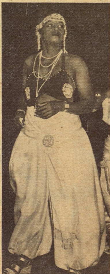
Hay más interés por los temas y trajes de estilo oriental que por los temas y trajes típicos. Ello tal vez sea debido a que el éxito de "La Sultana" animó a los organizadores de otras comparsas.

cenario de esplendor a la fiesta. Un cielo alto y azul prusia sirve de techo, estrellas como diamantes presencian a la luna que fría y grandota recorre su órbita. El mar refresca el ambiente y La Habana toda, pequeña y coqueta, espera en la prolongada noche de carnaval dispersar, con las luces del alba, a los noctámbulos que han vivido despiertos la noche del sábado.