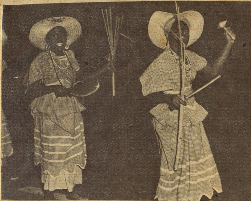
"La dotación recorrió los cañaverales, tumbó la caña y registró. El alacrán fué encontrado..." y ese día se declaró festivo. La comparsa del alacrán refleja esa fiesta.

ción de las clases altas no puede permitir tales manifestaciones callejeras, pero en cambio sí dentro de clubs elegantes y salones cerrados a los que concurren comparsas de "gente bien" que dan animación a los bailes de carnaval. La aspiración máxima que en tiempos de carnaval abriga cada corazón cubano es poder arrollar, bailar, expansionarse y vivir... sólo los prejuicios ponen dique a nuestra aspiración y así, en cada barrio, la comparsa pasa envolviendo en su anhelo la voluntad esclava de los vecinos.