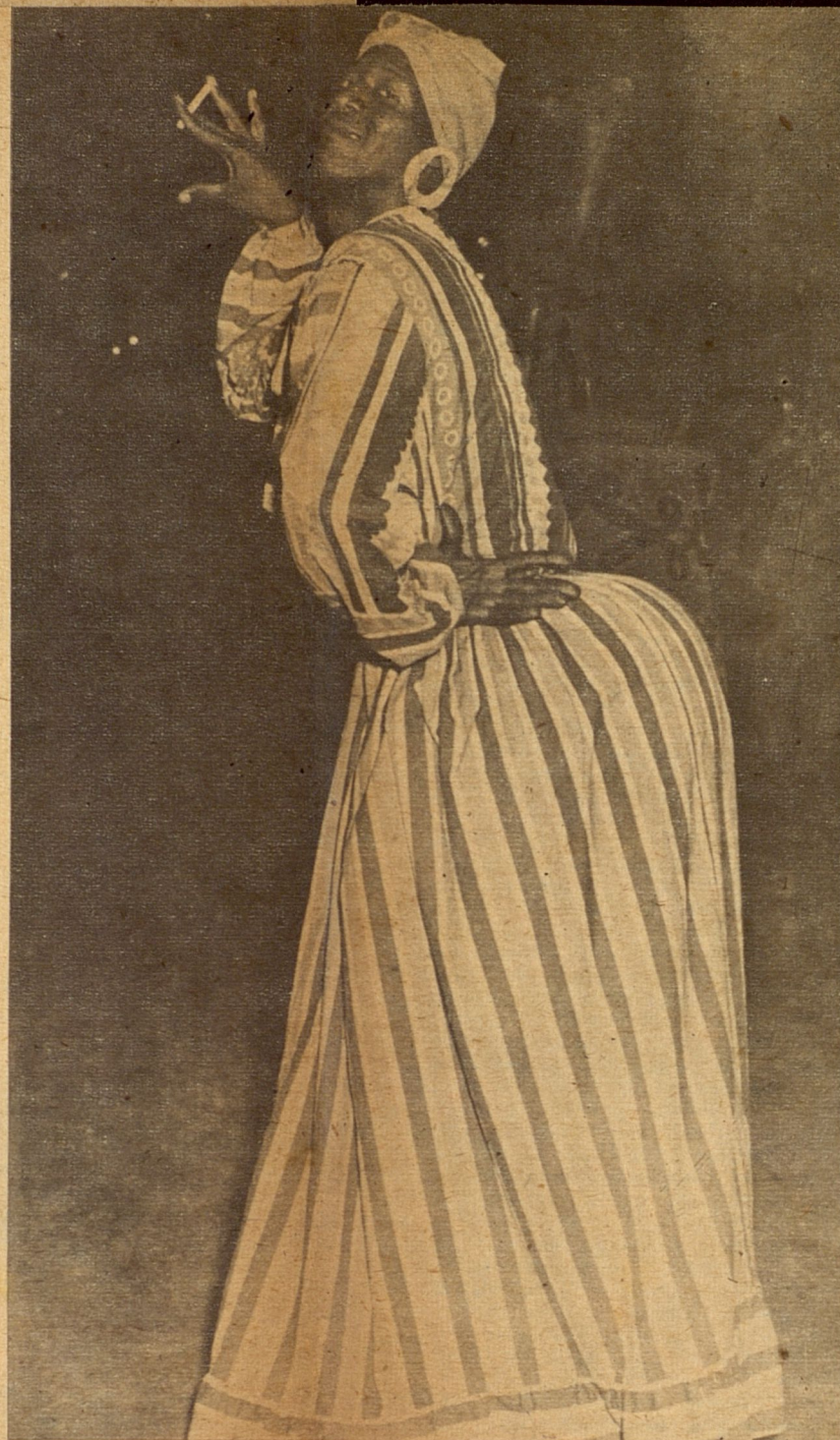
No todo es seriedad ritual en la locura rítmica de la danza. Las comparsas tienen también sus números cómicos que suelen ir a la retaguardia de las mismas.

Tradicional sábado de carnaval, con raíz en nuestro pasado. Fiesta que das a los turistas y alegría que proporcionas a los cubanos. En