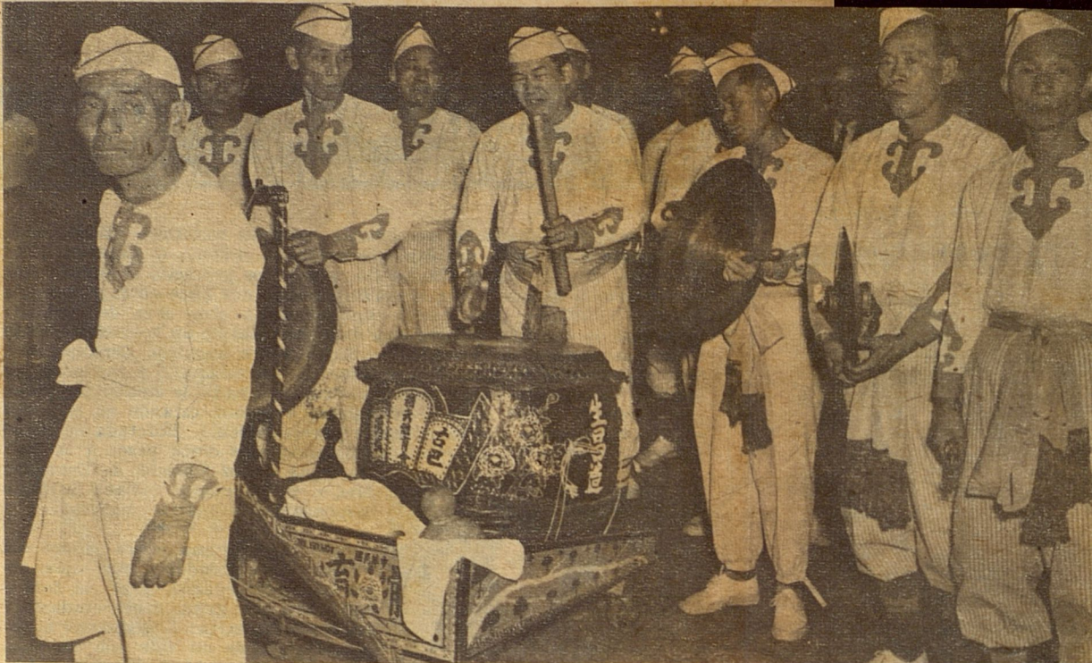
La comparsa china "El juego del león", integrada por miembros de la sociedad "Tai Ho Huen", quienes escenificaron diversos cantos chinos alusivos a la dinastía de los Ming.

El Comité se interesó por que la fiesta de las comparsas evolucionaran hacia una expresión más cubana, más culta y más artística. Conga y comparsa empezó a diferenciarse: la primera sólo perseguía arrollar, arrollar loca y frenéticamente tras los tambores roncocos y semi-salvajes; en cambio la segunda tendía a la organización de un conjunto artístico que expresara lo auténtico, lo propio, lo popular. Mientras en la conga no había homogeneidad, en la comparsa se buscaba siempre y se tendía a la creación de un cuadro artísti-