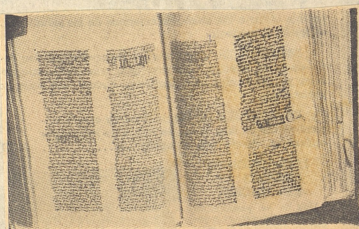
Códice Almancino. Liber de Regimine Regum et Principum. Seis tratados de S. Agustín, el Angélico doctor Tomás y Vicencio Beloncense. Manuscrito anterior al descubrimiento de la imprenta: 1433, uno de los tesoros de la Biblioteca.