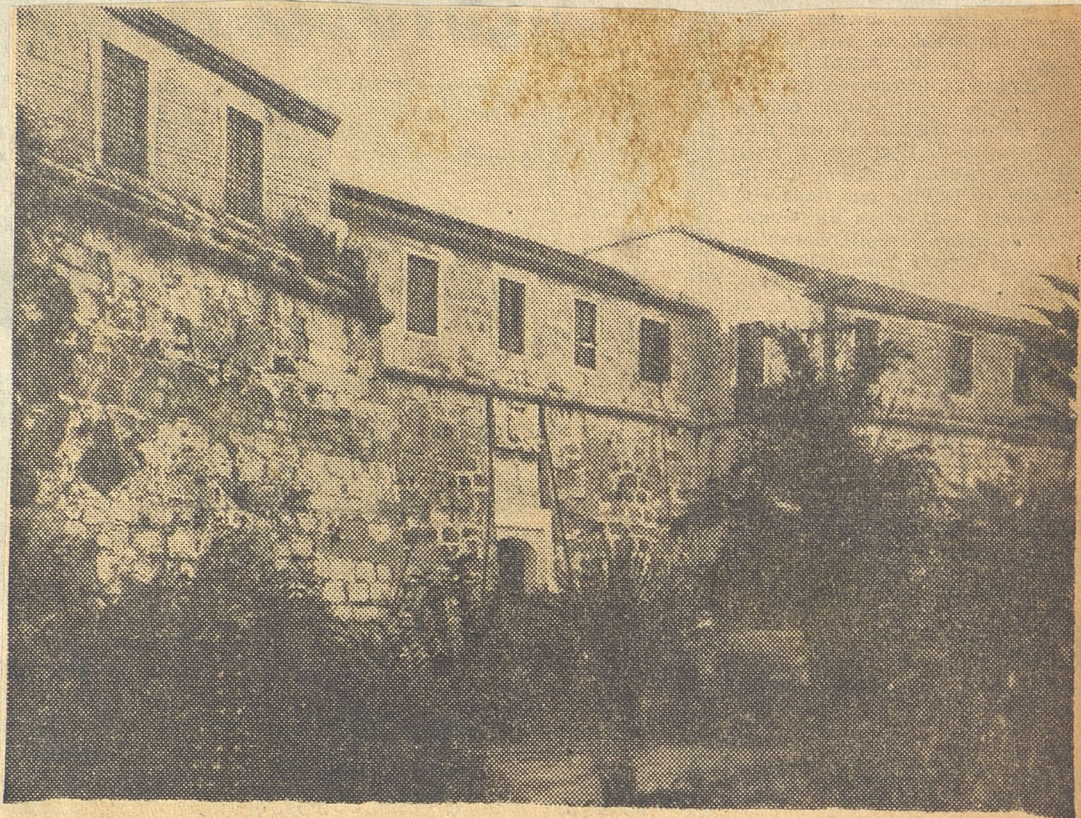
El viejo Castillo de la Fuerza, donde se encuentra actualmente alojada la Biblioteca Nacional.