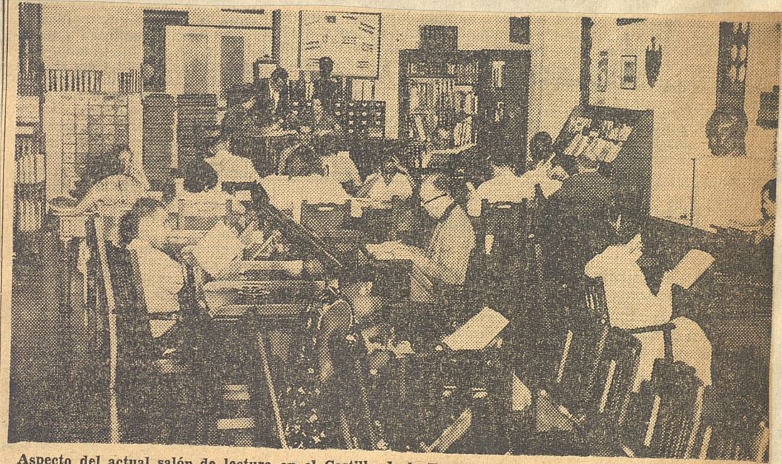
Aspecto del actual salón de lectura en el Castillo de la Fuerza, que contrasta con los modernos salones del nuevo edificio.