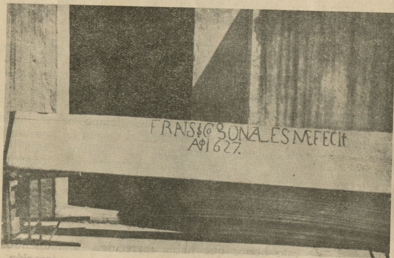
Franciscus Gonzalez me fecit. Anno 1627.

ARRATE. Llave del Nuevo Mundo antemural de las Indias Occidentales & t. I, p. 257-258.