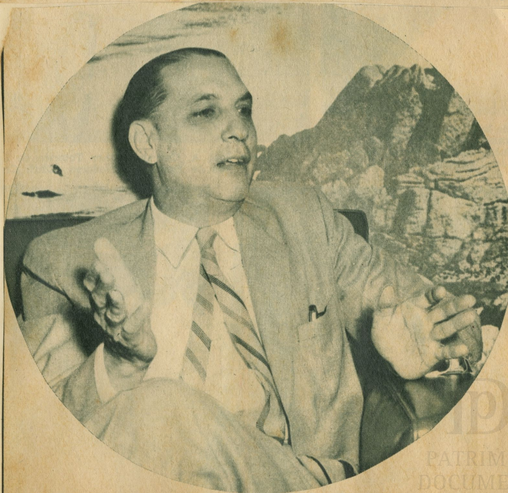
"No creo que en la necesidad de resolver este problema haya discrepancias".