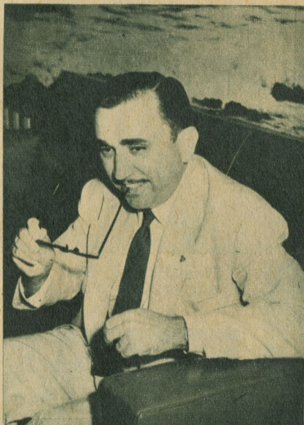
"Los comerciantes deben tener mayor representación en la Comisión de Tránsito".

—A la vista del pavoroso problema a que me estoy refiriendo —agrega nuestro entrevistado— se está haciendo cada día más urgente, facilitar la construcción de edificios destinados al parqueo, dar facilidades a la iniciativa privada para construir zonas de parqueo soterrado en las grandes plazas, adoptar, como se ha hecho en Carlos III y algunas calles del Vedado, parques para el estancamiento de vehículos y mayor representación en la Comisión de Tránsito a los representantes del comercio. Concretamente —concluye— para los proyectos de parqueo subterráneo en el Parque Central y en el de la Fraternidad, creo que debiera ayudarse a la iniciativa privada, mediante una exención de impuestos durante diez años y se conseguiría resolver este importante problema de interés público sin que el Estado tuviera que hacer frente a una obra de tal magnitud.