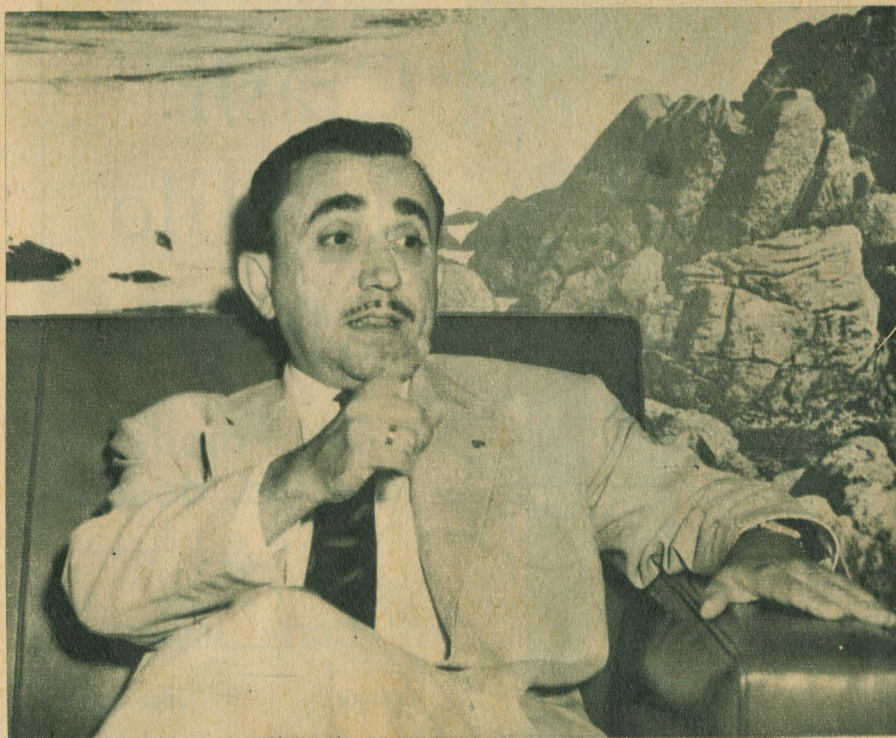
"Aumentan las quejas de los clientes de las grandes tiendas que no encuentran un lugar donde dejar la máquina".