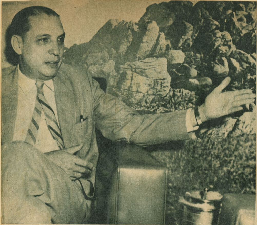
"La dificultad para encontrar lugares de parqueo repercute directamente en el comercio".