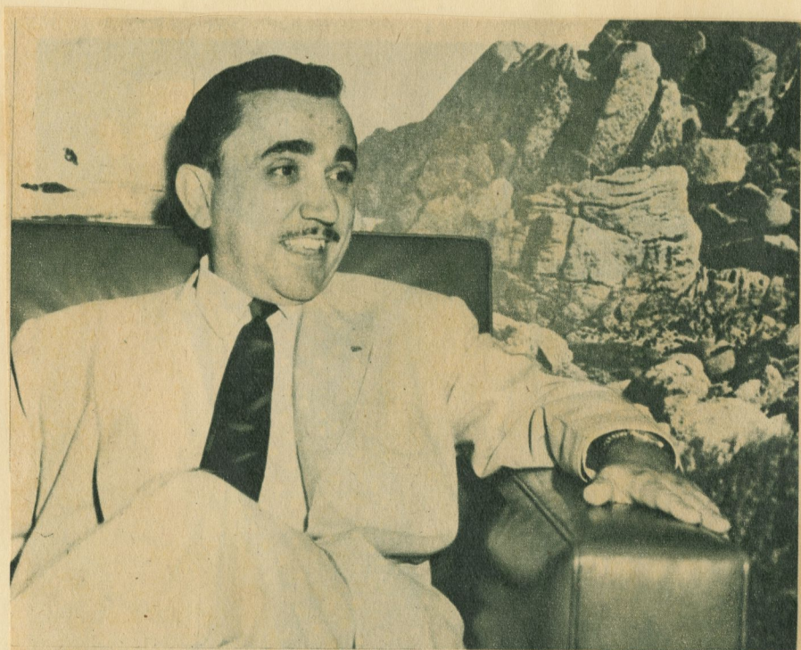
"Debe ayudarse a la iniciativa privada para crear grandes zonas de parques".