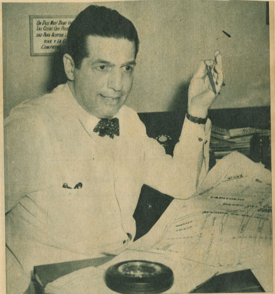
"A trece mil comerciantes afecta la falta de zonas de parqueo".