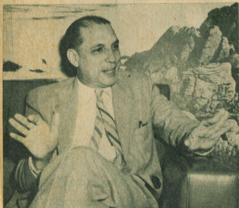
"En torno al Parque Central está la zona comercial más importante de La Habana".

—Es evidente —agrega— que las dificultades que existen para encontrar un lugar donde parquear la máquina, crea verdaderos conflictos de carácter público, con repercusión directa, en el comercio, aumento en la congestión de vehículos, aumento de accidentes y hasta gastos innecesarios para el propietario de la máquina que ha de estar dando vueltas con ella. Existe —nos dice nuestro entrevistado— un proyecto para hacer un parqueo sub-