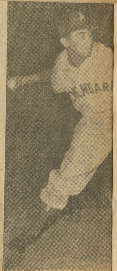
Noche tras noche, la esperanza de una