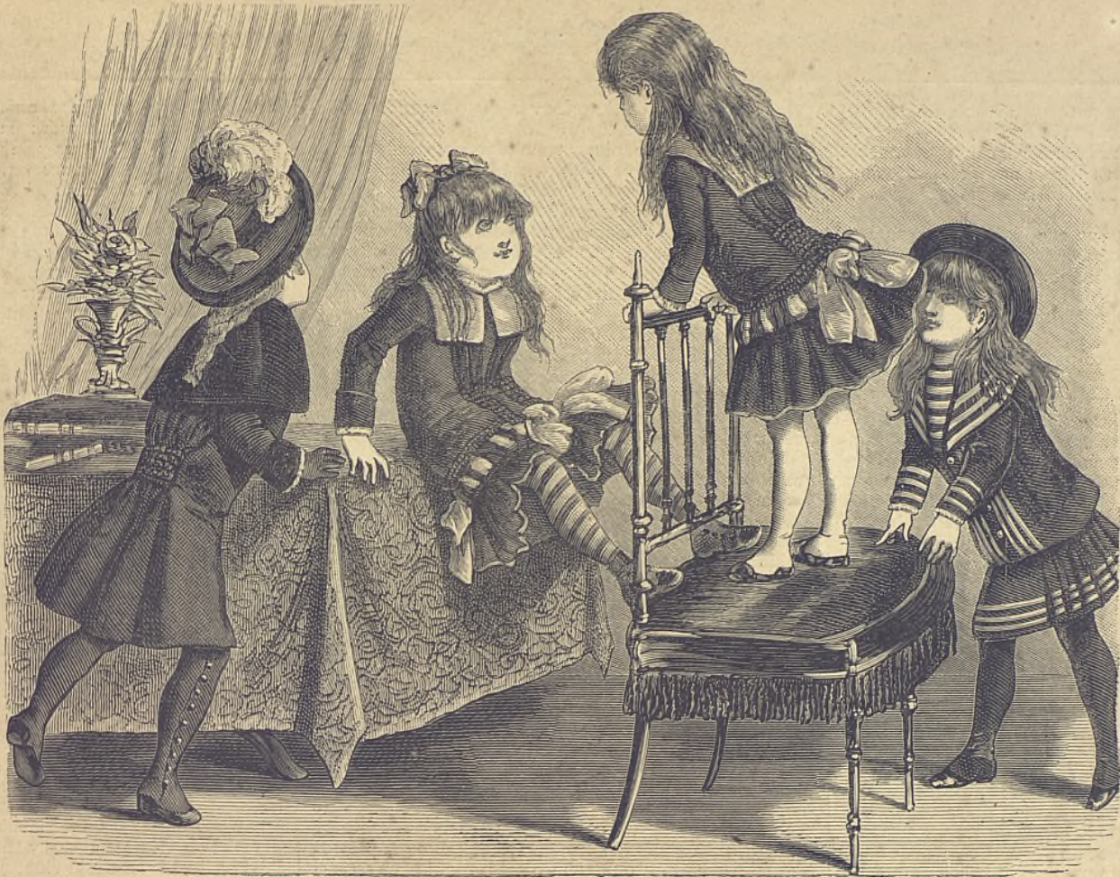
25.—Traje de calle para niños de 4 años.

Núms. 26 y 27. Traje de lanilla para niños de 3 años. El vestido va ajaretado, con un volante ancho fruncido y tiras recortadas, por las cuales se pasa un cinturón ancho de raso color rosa,