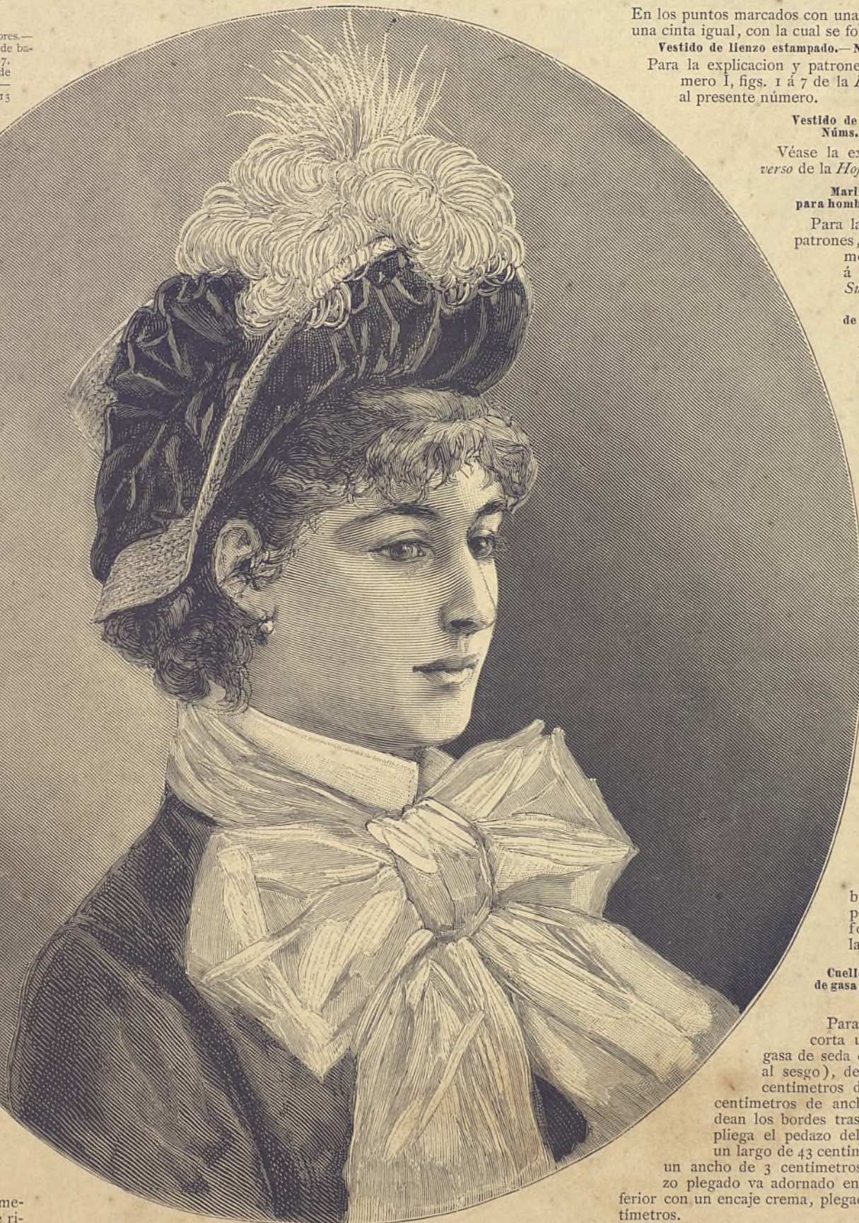
1.—Sombrero grande de paja Sumatra.

La gorra es de paño color de nùtria y va forrada de tafetan. El contorno va ribeteado de una cinta de seda. Se corta un pedazo entero por cada una de las figs. 51 y 52; se pasan á la tela los contornos del dibujo, y se ejecuta el bordado al punto de cadeneta y punto ruso, con torzal de seda marron claro y marron oscuro; se juntan el fondo y el borde de la gorra acercando los números iguales; se les algodona, se les forra, y se ribetea la gorra con una cinta de color de nùtria.