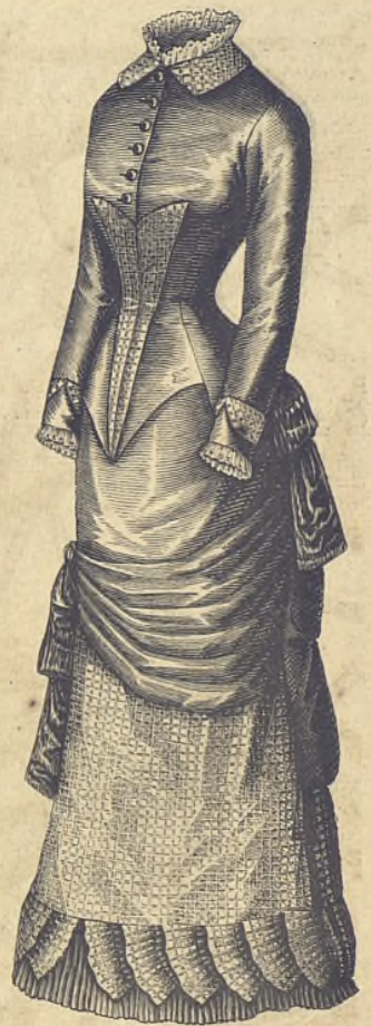
14.—Vestido de lana lisa y seda de cuadritos. Delantero.

sea para casa ó para calle. Por delante forma solapas y se abre sobre un chaleco alto, de color distinto. Las aldetas largas terminan en una banda plegada formando paniers . Las mangas son largas y ajustadas, con carteras guarnecidas de un lazo. Por detras la banda pasa bajo una de las aldetas del corpiño y va á formar un lazo grande, cuyos extremos caen sobre la falda. Una especie de plegado en forma de abanico doble termina la aldetta enmedio.