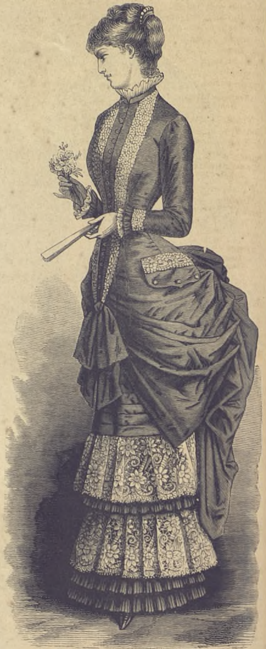
23.—Traje de raso maravilloso. (Explicacion en el verso de la Hoja-Suplemento.)