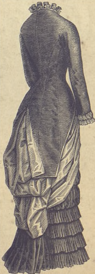
18.—Vestido con frac de lienzo azul oscuro y azul claro. Espalda. (Explic. y pat., núm. VI, figs. 29 á 34 de la Hoja-Suplemento.)