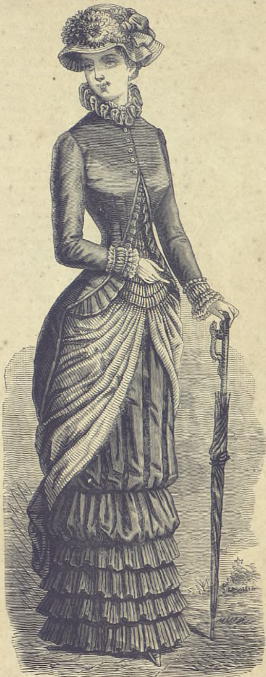
17.—Vestido con frac de lienzo azul oscuro y azul claro. Delantero. (Explic. y pat., núm. VI, figs. 29 á 34 de la Hoja-Suplemento.)