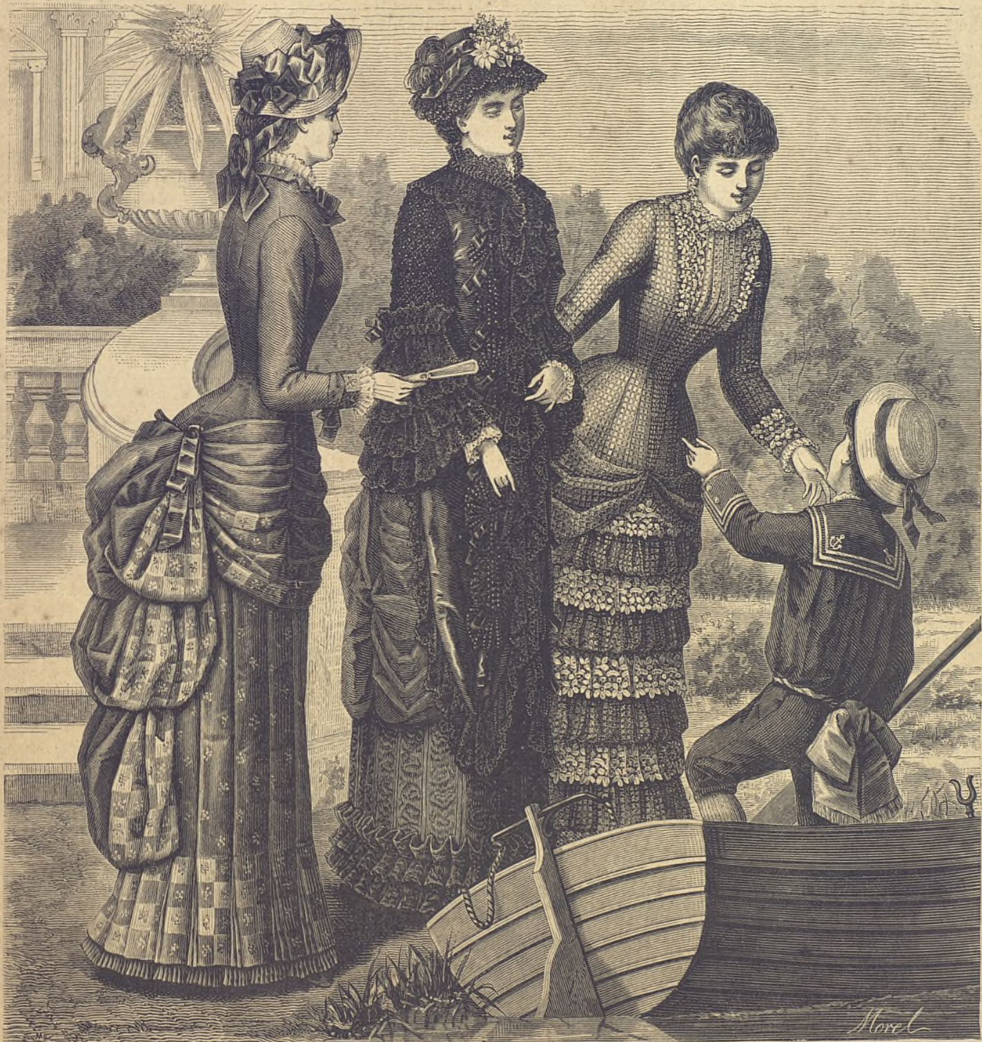
29.—Vestido de lienzo estampado. Espalda. (Véase el dibujo 3.) (Explic. y pat., núm. I, figs. 1 á 7 de la Hoja-Suplemento.)