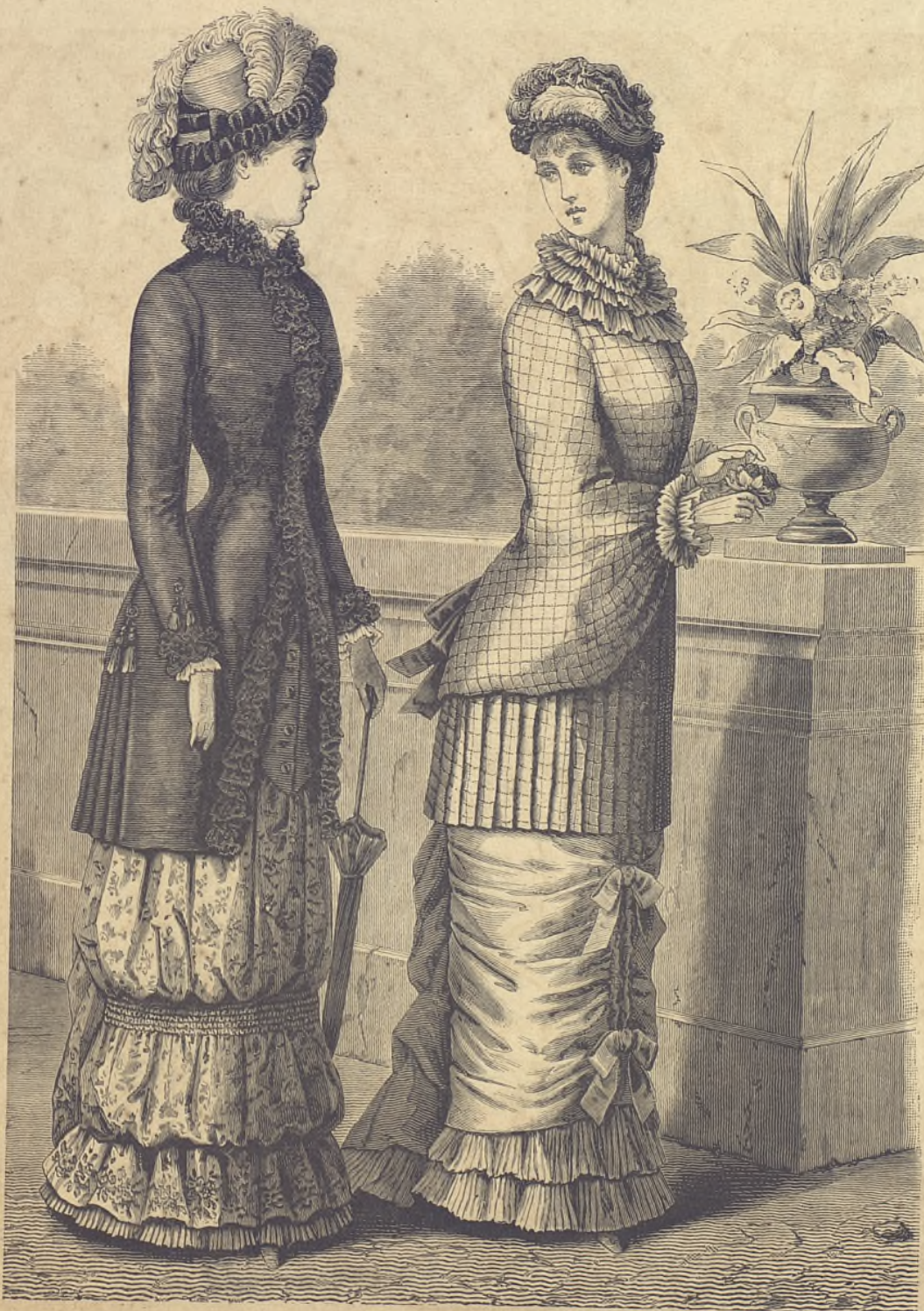
15.—Traje de paseo. (Explic. en el verso de la Hoja-Suplemento.)