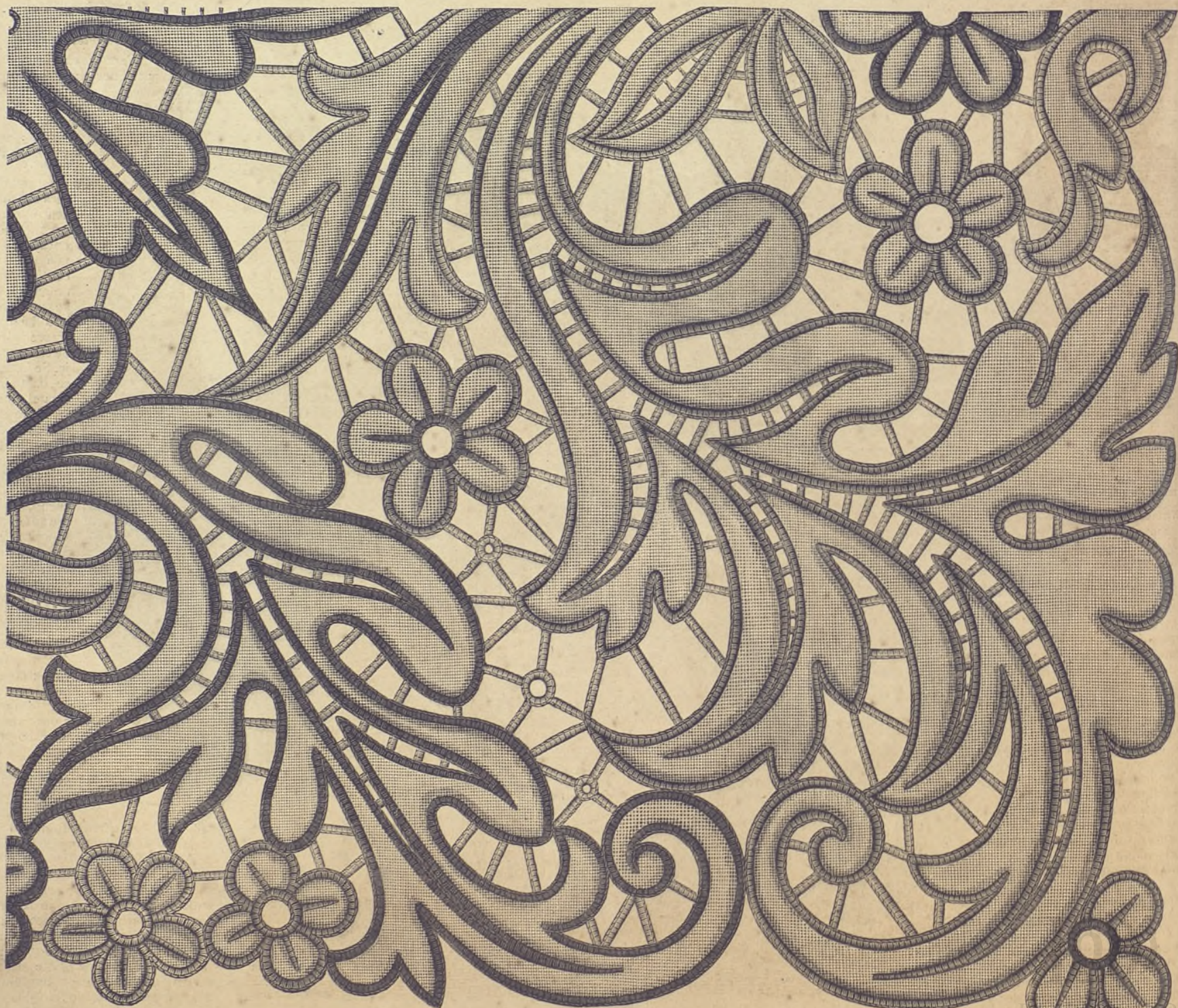
9.—Bordado sobre cañamazo fino.