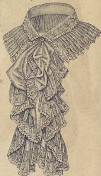
8.—Cuello con chorrera de gasa de seda y encaje.