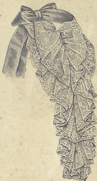
7.—Chorrera de encaje y cintas.

Esta prenda sirve para ponerla con faldas de tela diferente, bien