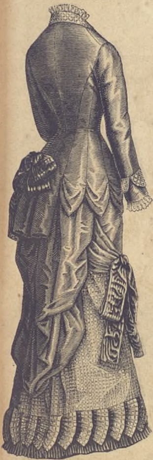
13.—Vestido de lana lisa y seda de cuadritos. Espalda.