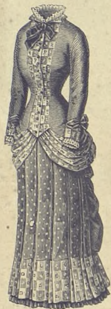
3.—Vestido de lienzo estampado. Delantero. (Vtase el dibujo 29.) (Explic. y pat., núm. 1, figuras 1 á 7 de la Hoja-Suplemento.)