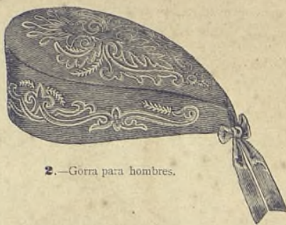
2.—Gorra para hombres.

Se emplea este bordado para cabecera ó cortinillas. Nuestro modelo representa la cuarta parte de la cabecera, y el dibujo puede repetirse lo mismo á lo ancho que á lo largo. Despues de pasar al cañamazo los contornos del dibujo, se ejecuta el bordado con lana fina. Para hacer las barretas que reunen las diferentes partes del