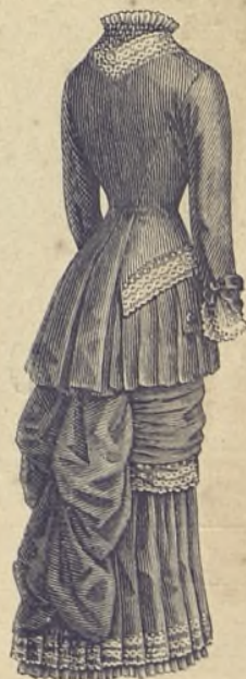
4.—Vestido de batista lisa. Espalda. (Vtase el dibujo 20.) (Explic. en el verso de la Hoja-Suplemento.)