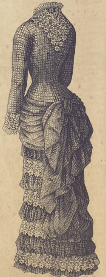
19.—Vestido de batista de cuadros. Espalda. (Véase el dibujo 31.) (Explic. en el recto de la Hoja-Suplemento.)