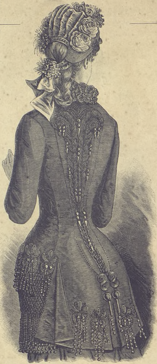
24.—Paletó de armure de verano. (Explic. y pat., núm. III, figs. 10 á 17 de la Hoja-Suplemento.)