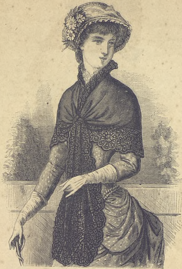
12.—Fichú de granadina de seda. (Explic. y pat., núm. IX, fig. 51 de la Hoja-Suplemento.)