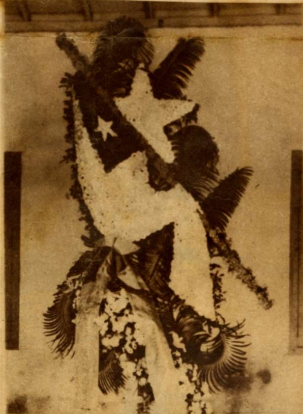
PRECIOSA bandera cubana plegada sobre un campo de orquídeas y margaritas, ofrendada a los heroicos aviadores caídos en Cali, por el Ejército Constitucional y en cuya delicada y artística confección se esmeraron los artistas del jardín EL CLAVEL. Por la perfección de sus líneas y por ser toda de flores naturales, fué considerada entre las mejores dedicadas con tan triste fin