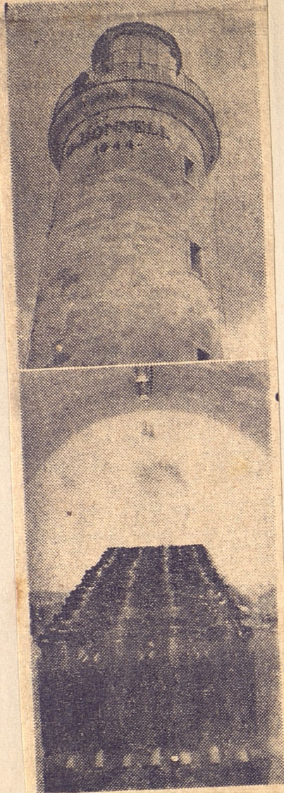
Arriba, la farola del Morro, una leyenda para los habaneros, que mañana, en su primer centenario, vestirá sus mejores galas al ser inaugurado el primer servicio eléctrico para su fanal. Abajo: las potentes baterías Williard, tipo DHB 5-1 de 4 series de 16 bombillos, especial para prestar rápido servicio en caso de que fallara la corriente alterna.