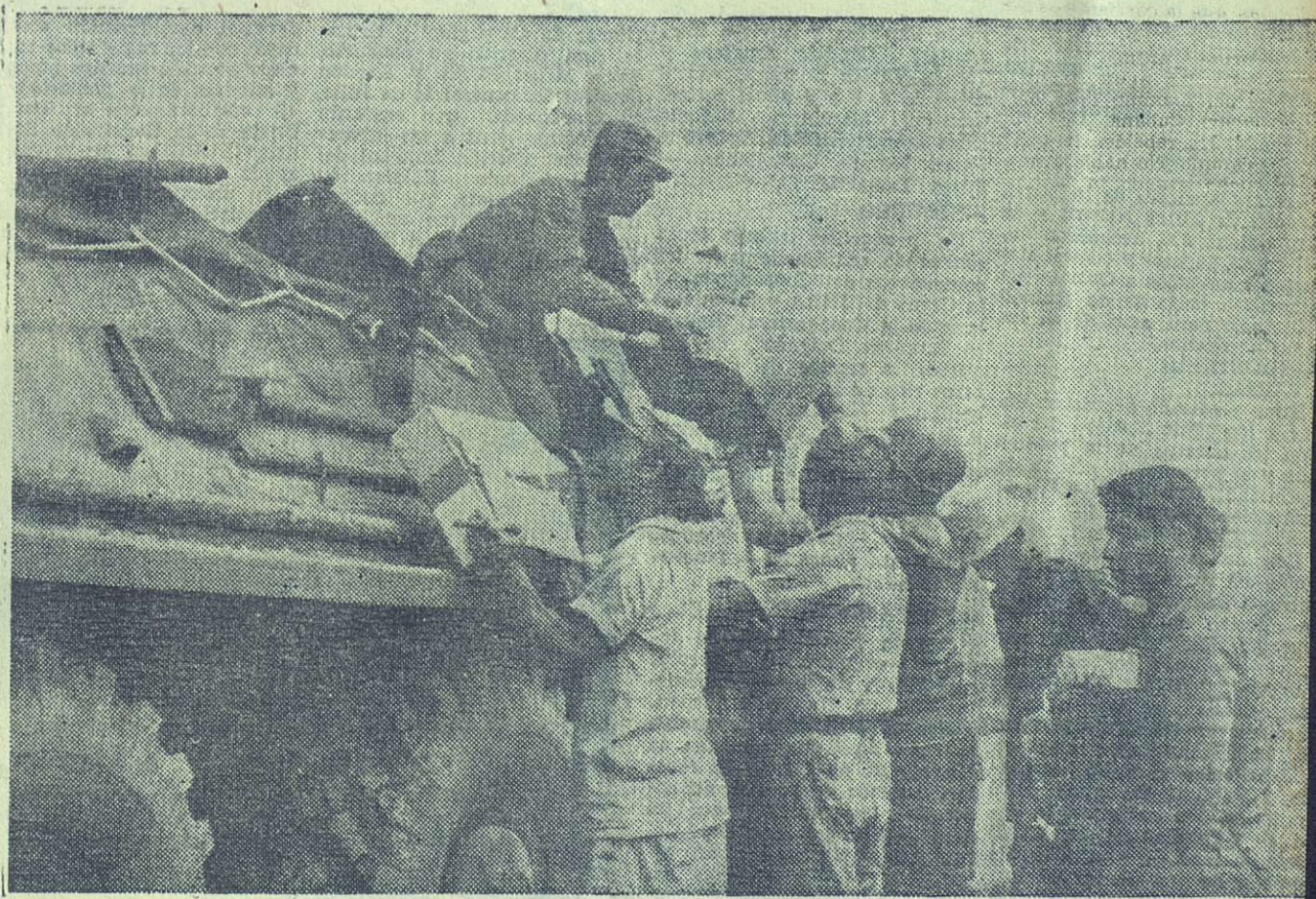
En una jornada de trabajo sin término de horas, las brigadas de salvamento llegan de las zonas de desastre e inmediatamente vuelven a partir hacia otras con su preciosa carga.