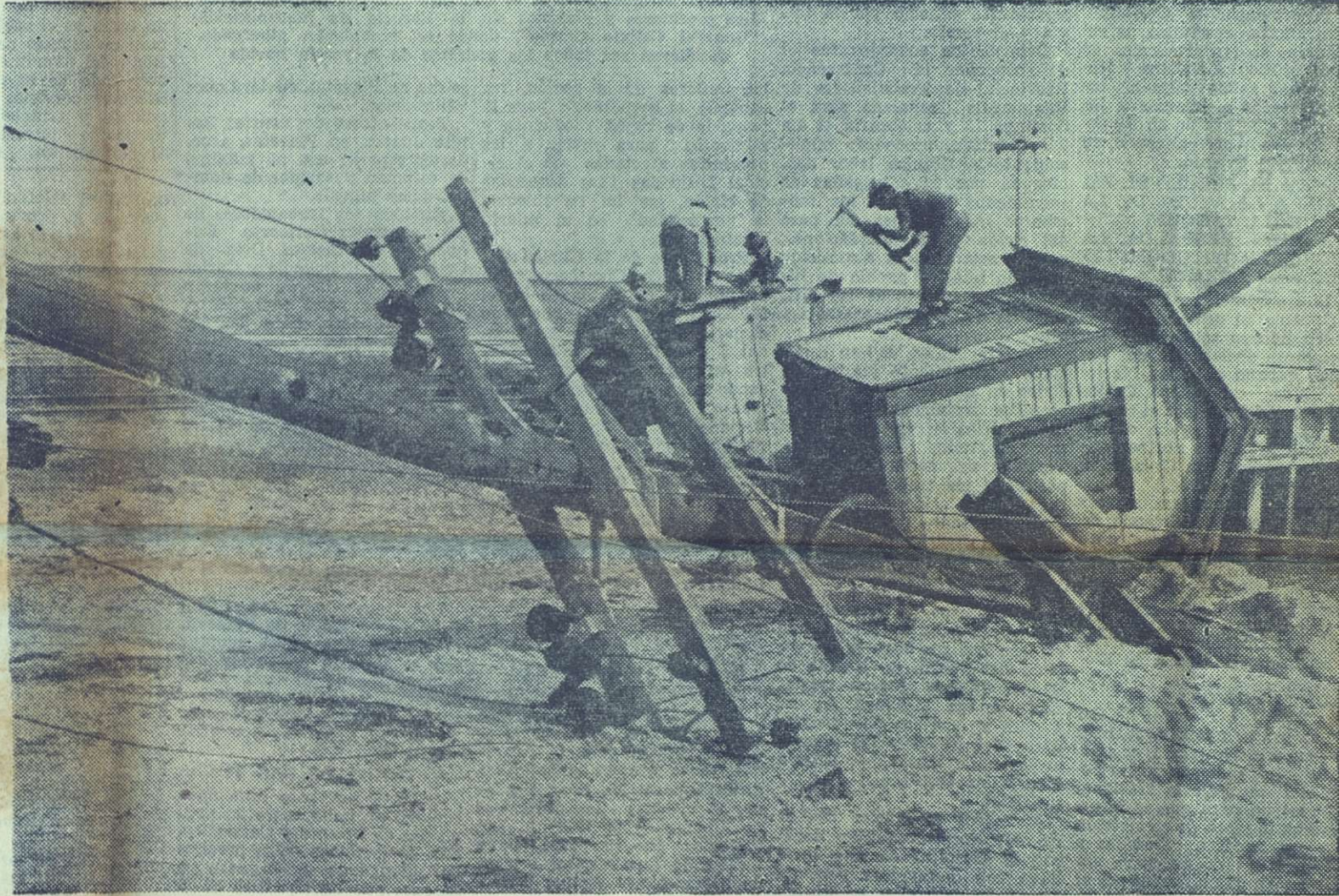
La furia del viento se dejó sentir en todas partes. Un poste de teléfonos arrastra en su caída una casa próxima.

soviético de la zona, que pese a lo inhóspito y peligroso del lugar fue al encuentro de ella y su recién nacido. "En mis horas de dolor, me conforta el saber que no estoy sola; son muchas las manos que se extienden para ayudarme, orientarme y comprenderme".