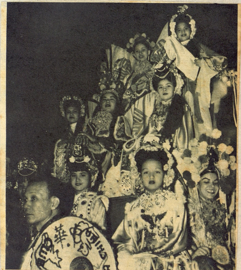
Toda la suntuosidad del Oriente legendario se ofrece en esta foto que recoge un aspecto de la comparsa con la que la diligente y entusiasta colonia china contribuye a la mayor brillantez de los Carnavales.