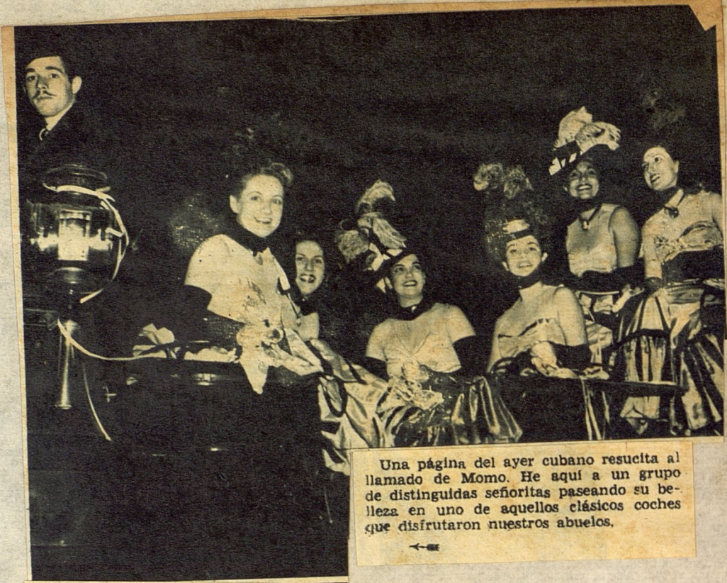
Una página del ayer cubano resucita al llamado de Momo. He aquí a un grupo de distinguidas señoritas paseando su belleza en uno de aquellos clásicos coches que disfrutaron nuestros abuelos.