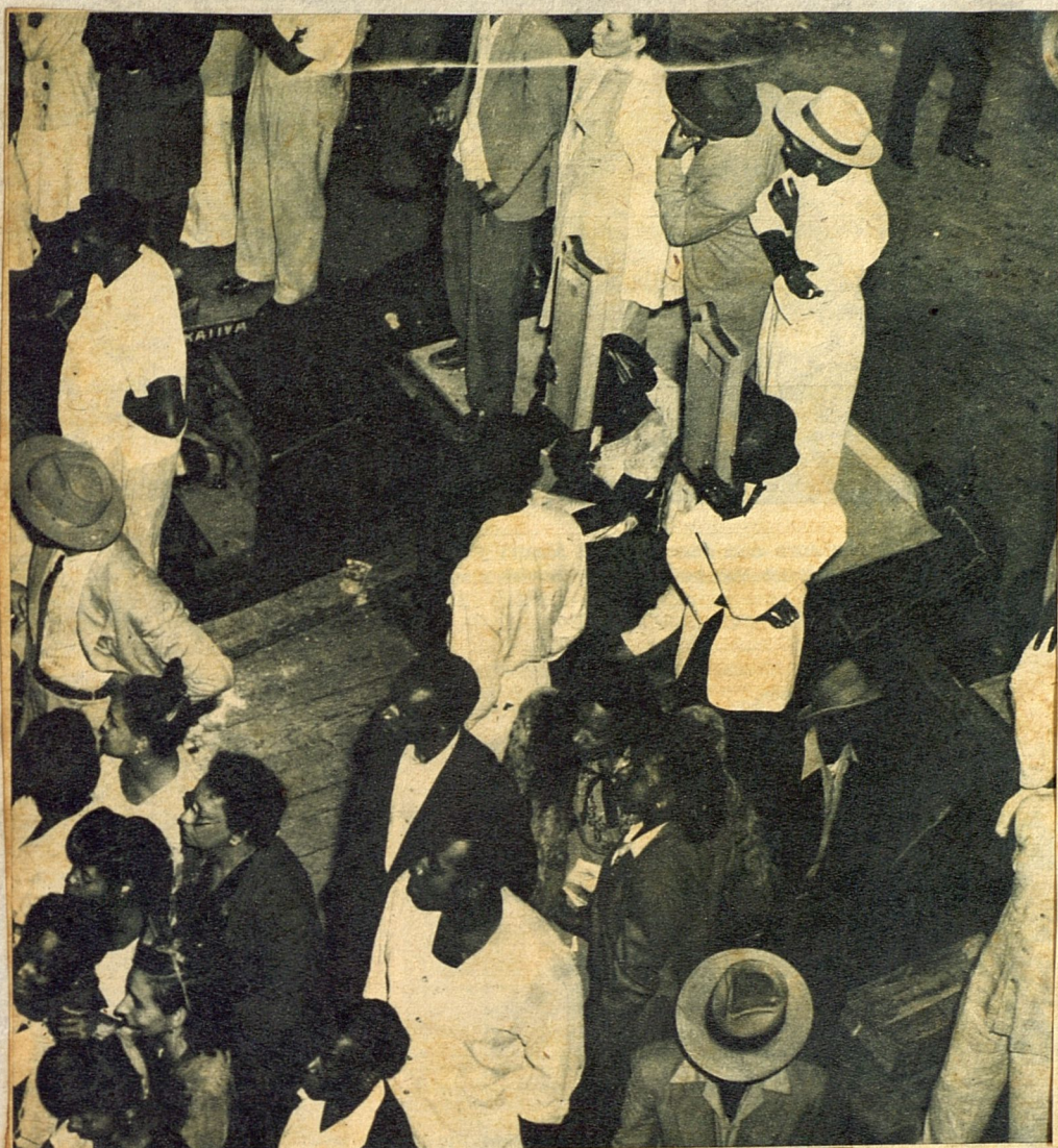
Aqu guy Lal quel Fu