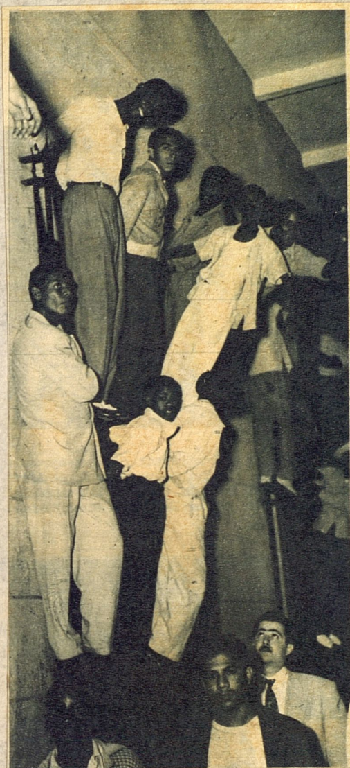
Estos no encontraron asiento ni en la sólida tribuna ni en los endeble cajones alquilados. Y la curiosidad los convierte en Tarzanes de ocasión... Y hay quien pasa a su vera con el temor de que le caiga arriba uno de estos trepadores de doscientas libras...