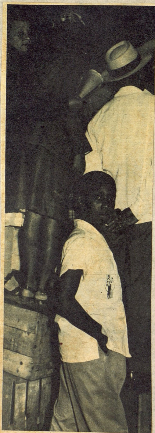
Para los miles de personas que quieren contemplar el desfile, cualquier medio es bueno. Y estos cajones que ofrecen los improvisados «alquilladores» sirven para tal fin. Cuando el silencio vuelva sobre la ciudad, esos muchachos que aparecen vigilando su industria habrán reunido unos cuantos pesos.