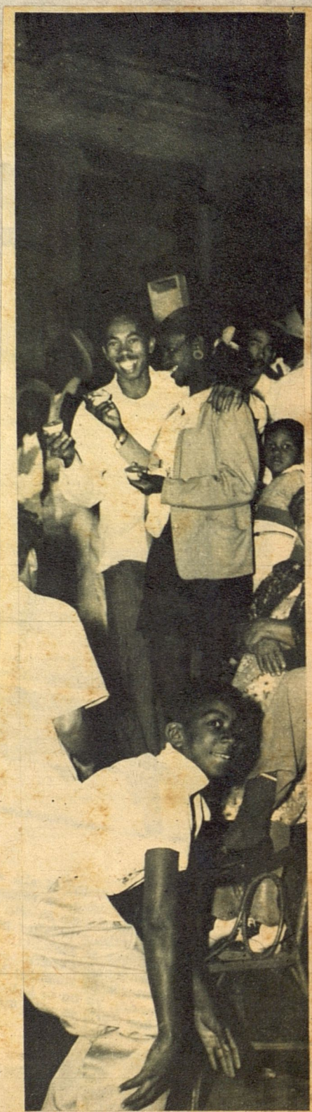
Los camiones de mudanza que se alquilan en todas las bocacalles del Prado no son tribunas incómodas. El ingenio de sus propietarios los ha dotado ya del máximo confort. Ved aquí a esta sonriente y feliz familia gozando de las delicias que le ofrecen butacas y almohadones.