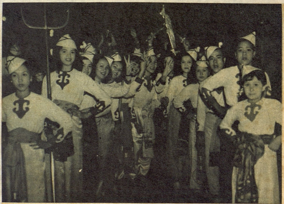
La colonia china, con su típica comparsa, ha llenado de color oriental el desfile. Sin embargo algo nos dice, en la abierta sonrisa de las lindas chinitas, que por haber nacido entre nosotros tienen toda la gracia y el encanto que distinguen a la mujer cubana.