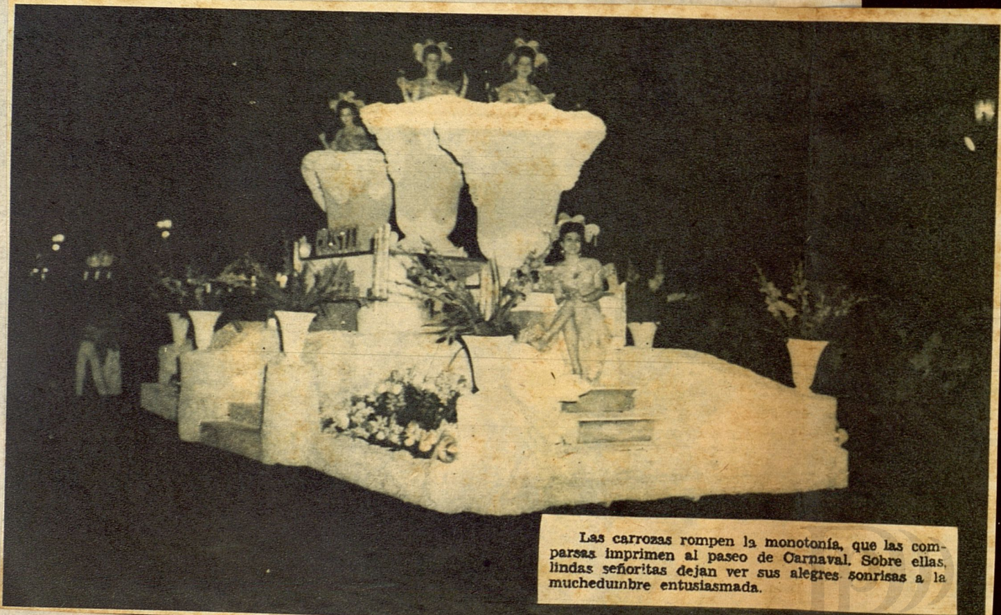
Las carrozas rompen la monotonía, que las comparsas imprimen al paseo de Carnaval. Sobre ellas, lindas señoritas dejan ver sus alegres sonrisas a la muchedumbre entusiasmada.