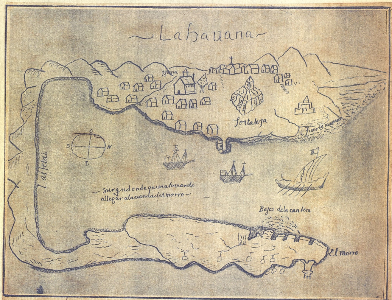
Un viejo croquis, el más antiguo que se conoce, de la bahía de La Habana, trazado en el siglo XVI por un pirata que llamaban "Carga-patache" para su uso.