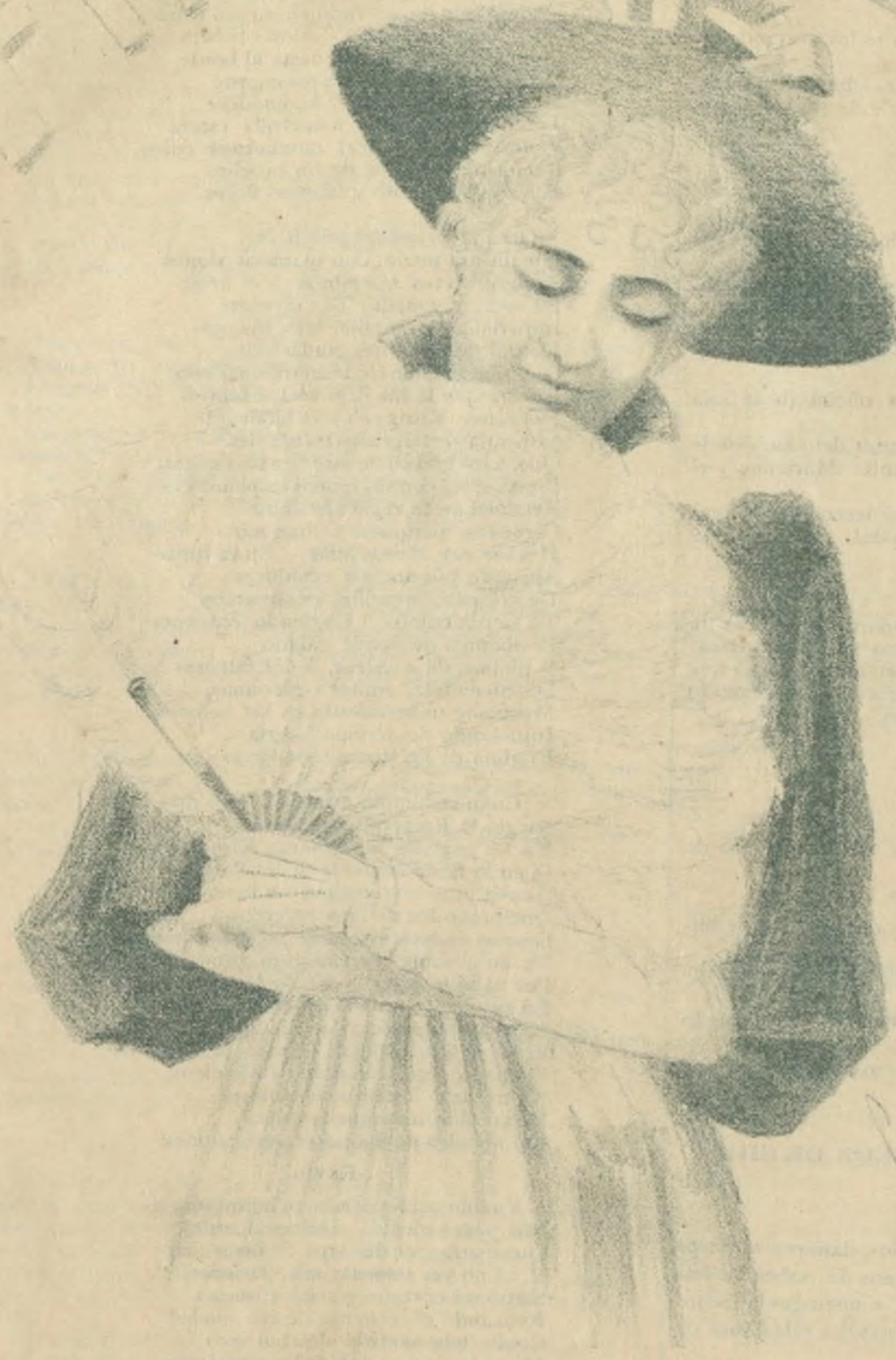
FIN DE SIÈCLE.