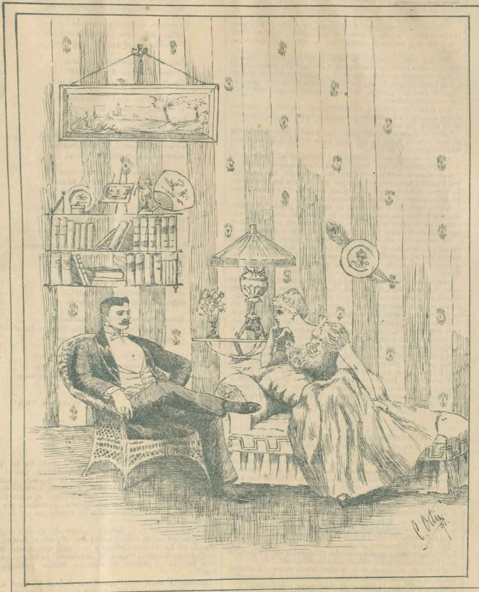
Le monde ou l' on s' amuse.