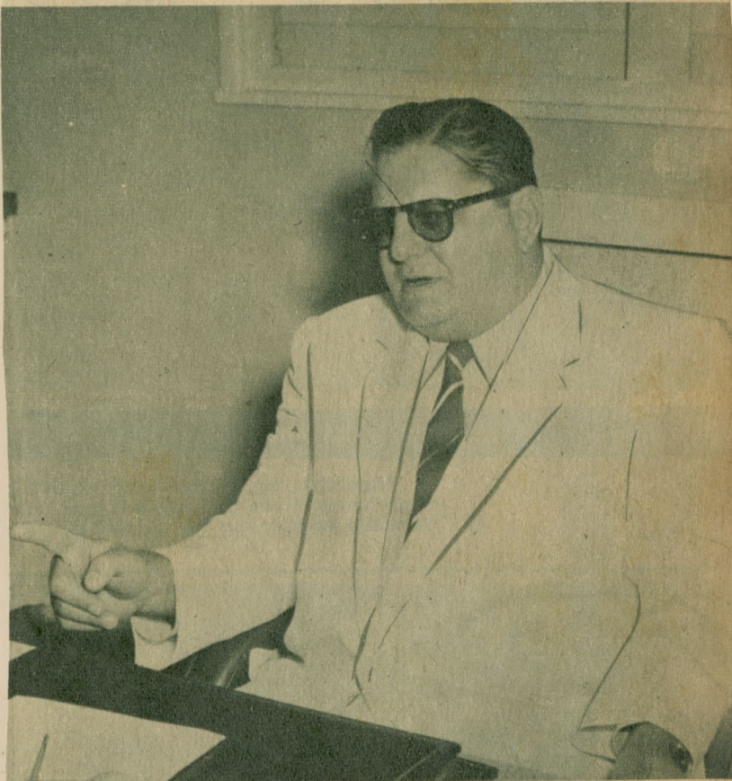
"El público tiene en cuenta el carro como valor de inversión".

—E insistiendo sobre la economía en el consumo —continúa— hay que señalar todavía que en algunas máquinas alemanas se ha adaptado el motor "Diessel" que lleva la economía en el consumo a extremos inverosímiles. A mi juicio estos factores, señalados a grandes rasgos, son los que determinan que el carro europeo