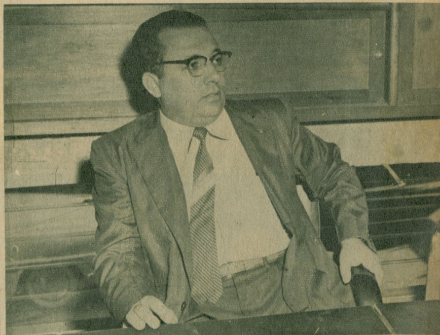
"Aumentan las importaciones de carros pequeños".

—Aumento que, por lo demás —agrega— se debe a ese deseo de economía que el consumo que manifiesta el público y que sin duda influye en la crisis del carro americano. Ahora bien, la economía en un automóvil no es solamente por el ahorro en el consumo de gasolina; lo es también y muy importante, por el ahorro en la compra de piezas de recambio y reparaciones y en este aspecto el carro europeo es mucho más caro y ofrece mayores dificultades que el de fabricación americana. De ahí —termina nuestro entrevistado—