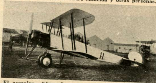
El aeroplano "Avro-Gospor", cuya caída en El Palomar causó la muerte del sargento Díaz.