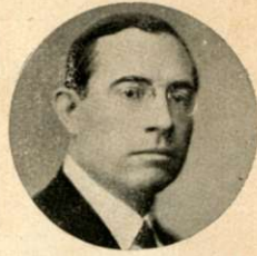
Rodolfo Moreno y Horacio Oyhanarte, que se batieron por una cuestión parlamentaria. Ambos resultaron heridos en la cara. El duelo se suspendió a causa de la sangre que los engeguecía.