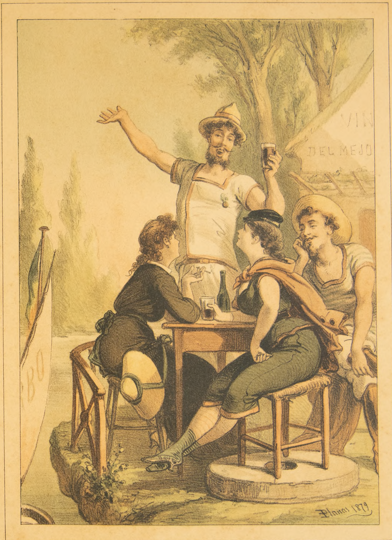
Lit. Tip de J. Aleu

- Antes de empezar nuestras escursiones terrestre-acuático-aéreas á través de la Exposicion, permite bella Clara, que la tripulacion del Barbo magnético te nombre su capitán.