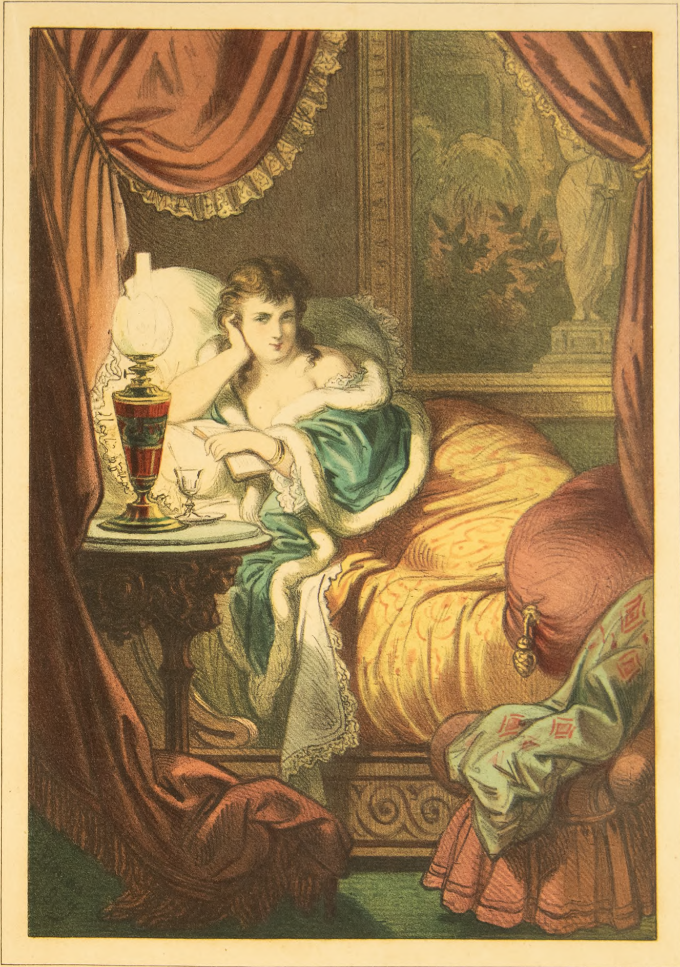
Lit. Pop. de J. Atea.

- Ya estoy en San Petersburgo, ¿cual de los que me rodean será el mas rico ?