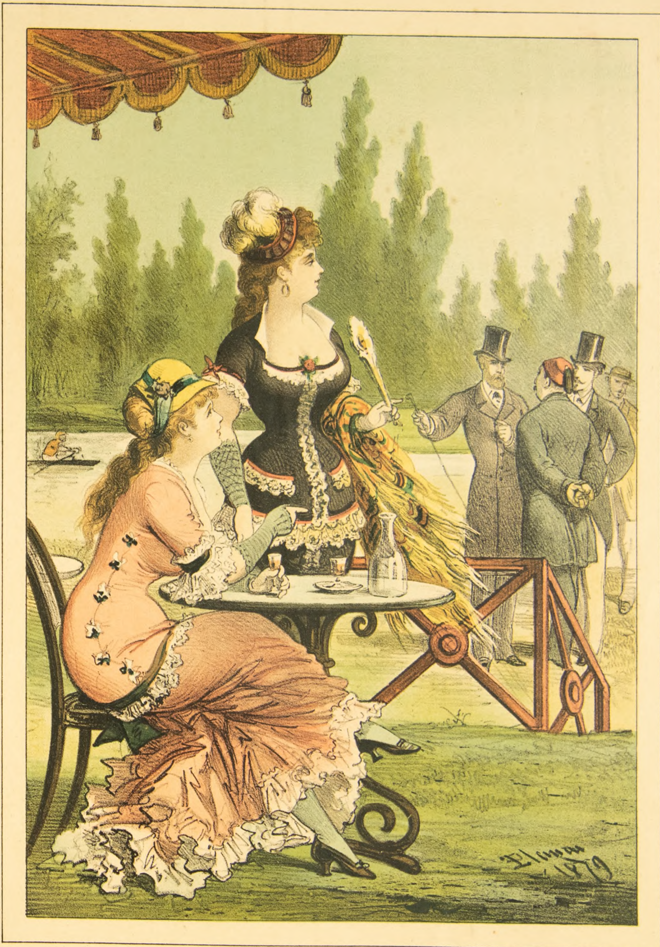
Lit. Tip. J. Alau. Editor.