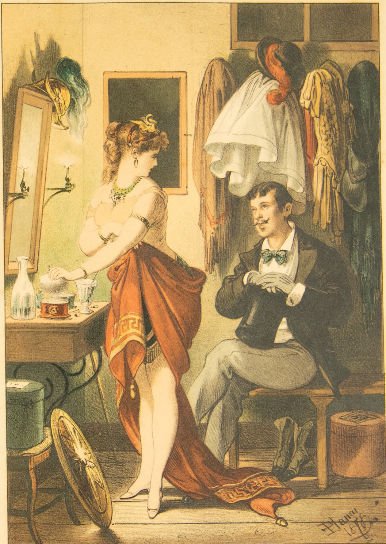
Lil-Tip de J. Aleu.