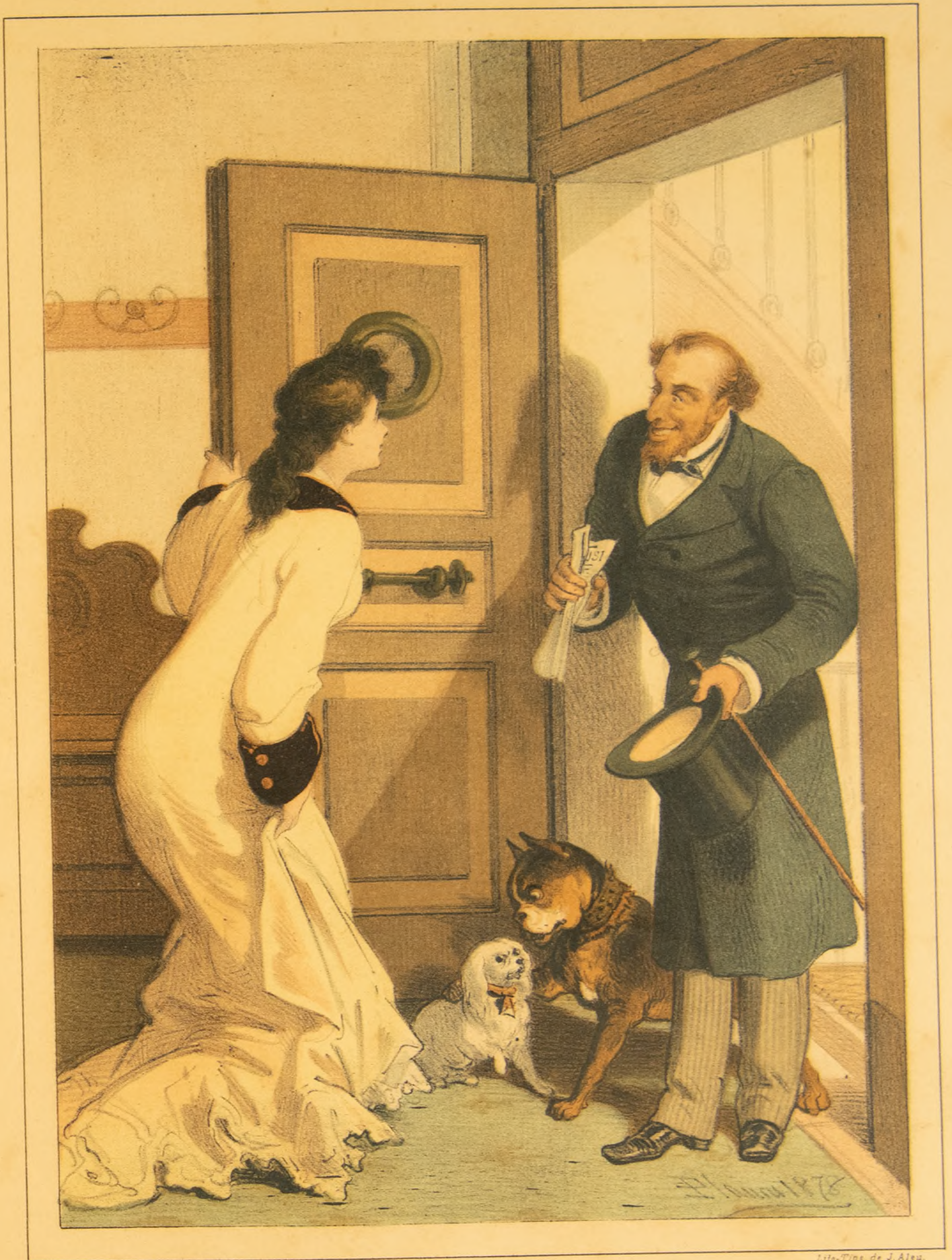
Lito-Tipa. de J. Alea.

-¿Es aquí donde, según el Diario de Avisos hay una Señora que necesita un caballero decente para todo servicio? -Servidora de V.