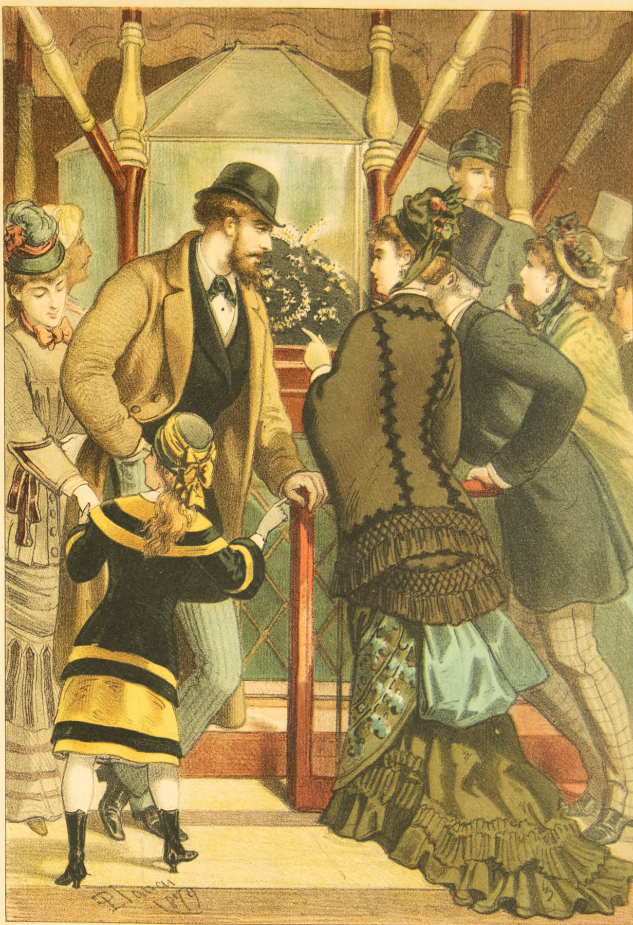
La Tip de J. Alex

-Vamos à ver è que es lo que prefiere V. de todo cuanto à visto ?