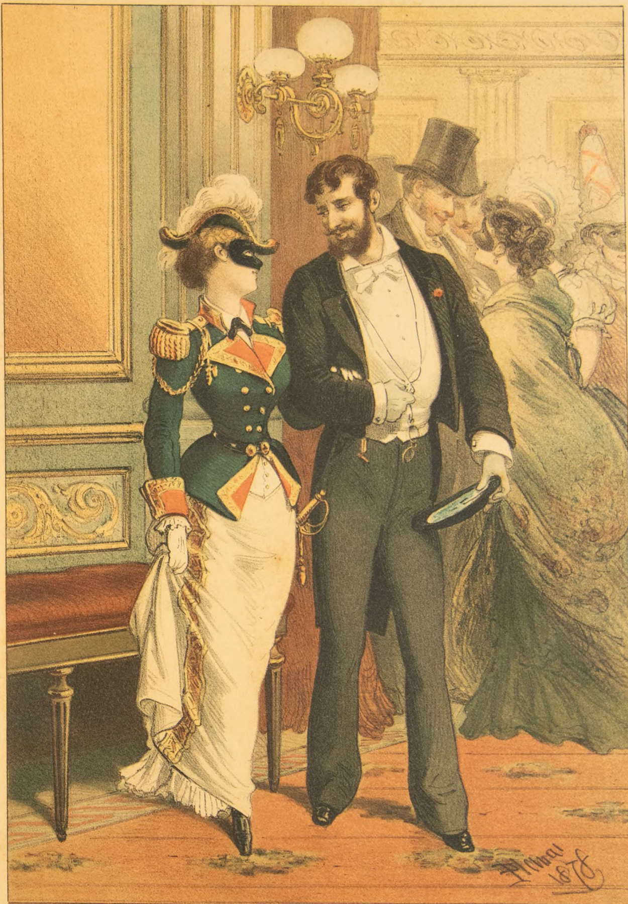
Lit. Tip de J. Aleu.

-¿Quieres apoyarte en mi brazo máscara? -Tengo el estómago muy debil. -(Comprendo) Vamos á cenar.