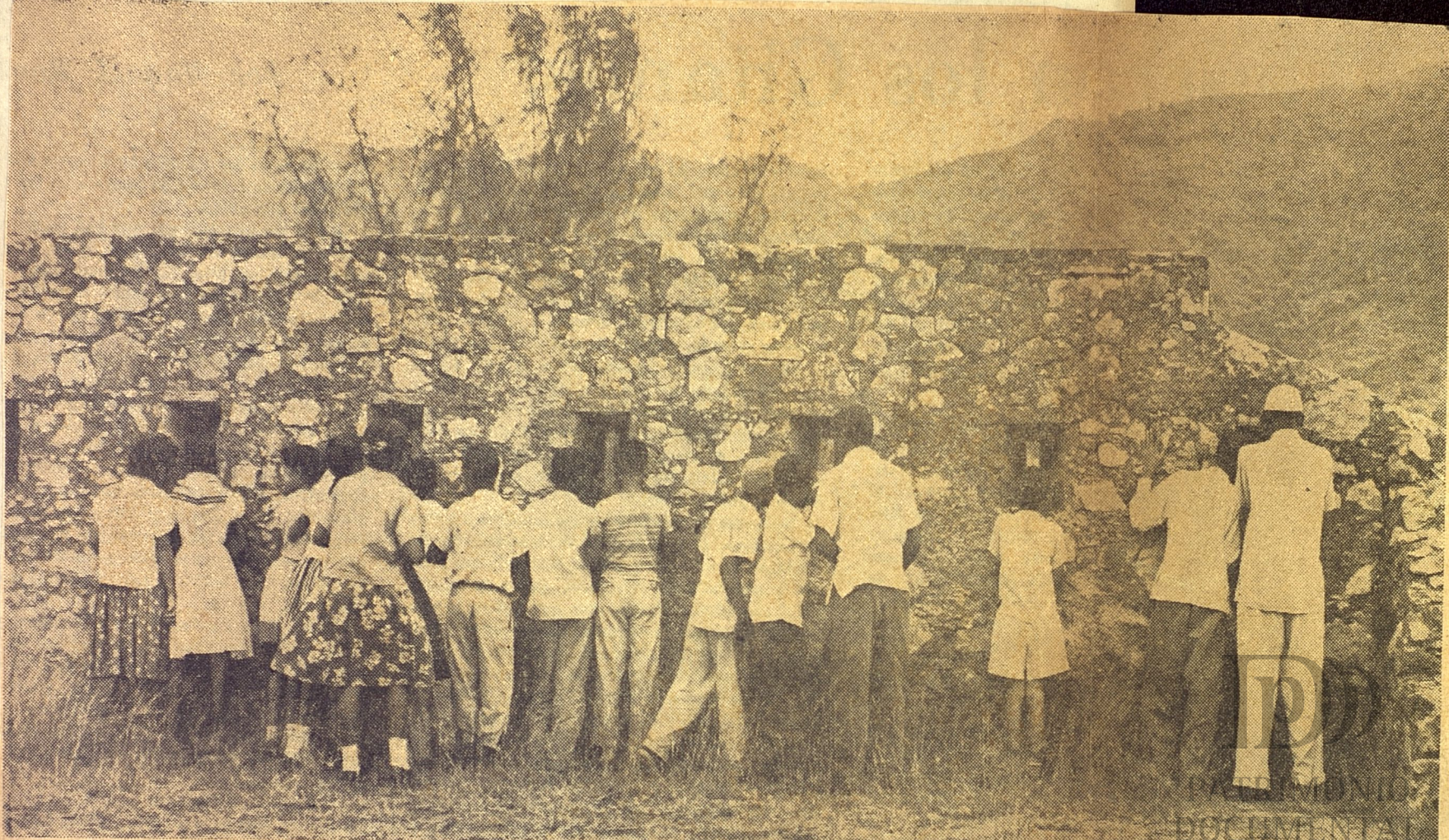
POR LAS TRONERAS y aspilleras del semiderruido fortín, un puñado de chiquillos asoma sus miradas curiosas y sorprendidas para contemplar las faldas del lomerío por donde descendieron una mañana de julio de 1898 las falanges heroicas que iban a poner fin a la dominación española en nuestra tierra.

INSTITUTO VENEZOLANO DE INVESTIGACIONES DOCUMENTALES OFICINA DEL HISTORIADOR DE LA HABANA