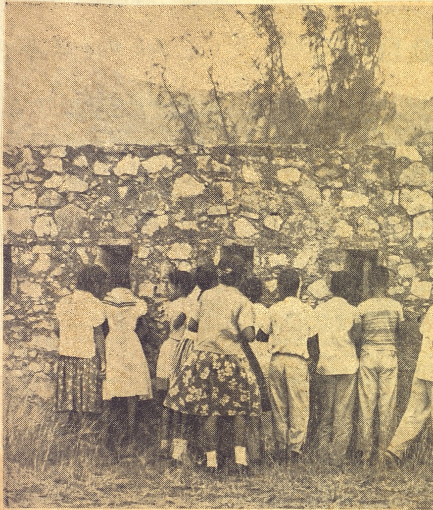
POR LAS TRONERAS y aspilleras del semiderruido fortín, un puñado de plar las faldas del lomerío por donde descendieron una mañana de julio española en nu