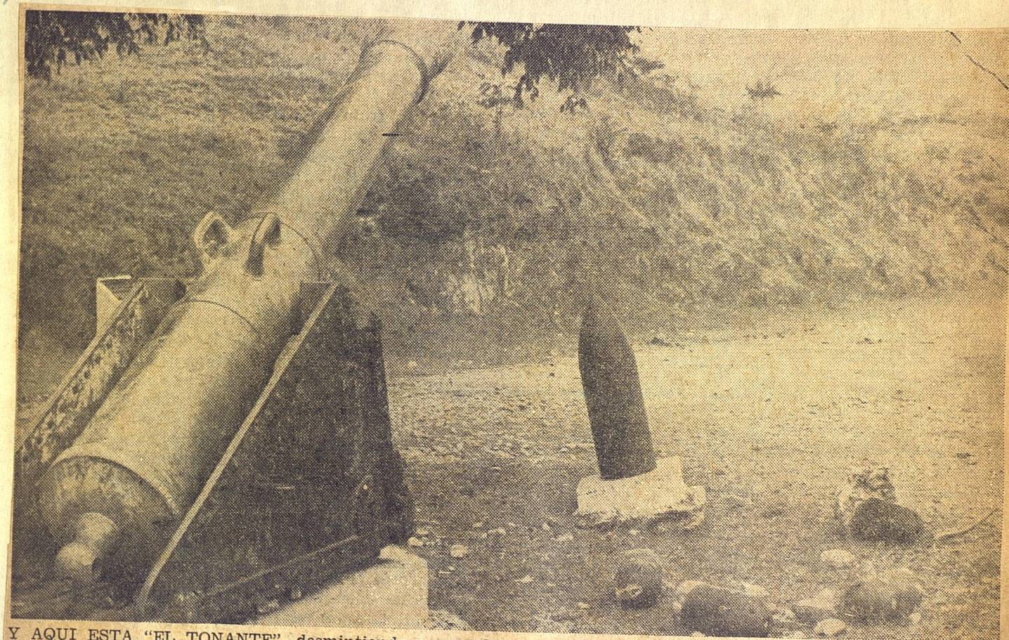
Y AQUI ESTA "EL TONANTE", desmintiendo su nombre sonoro en medio del silencio de la campiña, rodeado por los proyectiles inútiles que un día lanzara con velocidad fulminea sobre las avanzadas enemigas.