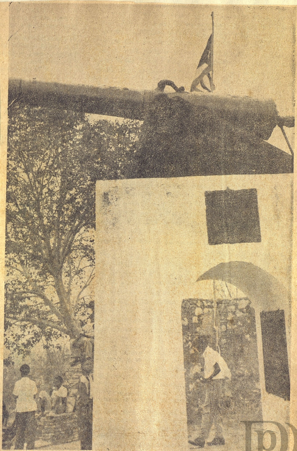
"PATAGON" RUMIA SU invalidez metálica desde la altura. Ya no más detonación horrisona; ya no mas escupir de quemante metralla. Para él, silencio y olvido....