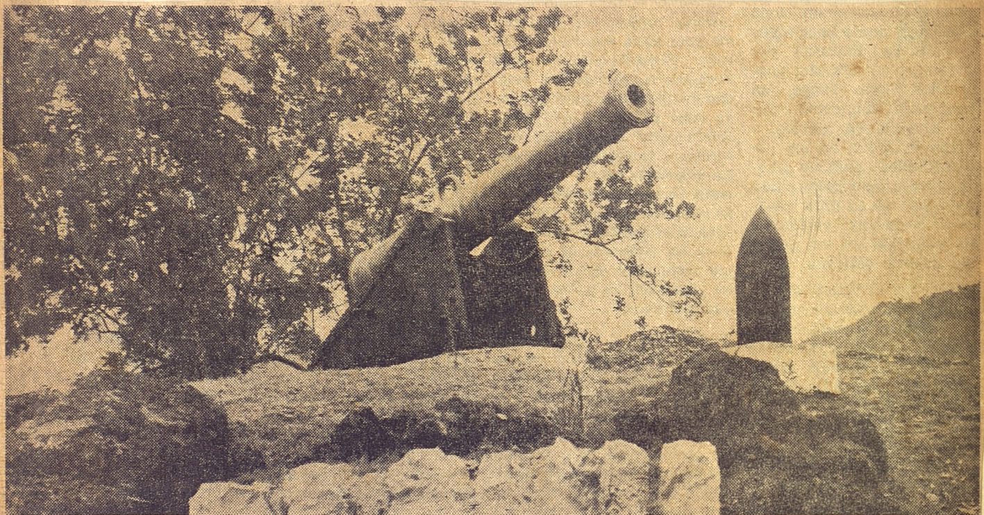
ESTE ES "EL CLARIVIDENTE" ("Le Clairvoyant"), el cañón francés que descargaron los artilleros de Vara del Rey sobre las tropas del regimiento "Baconao", en la épica lucha de "El Viso".