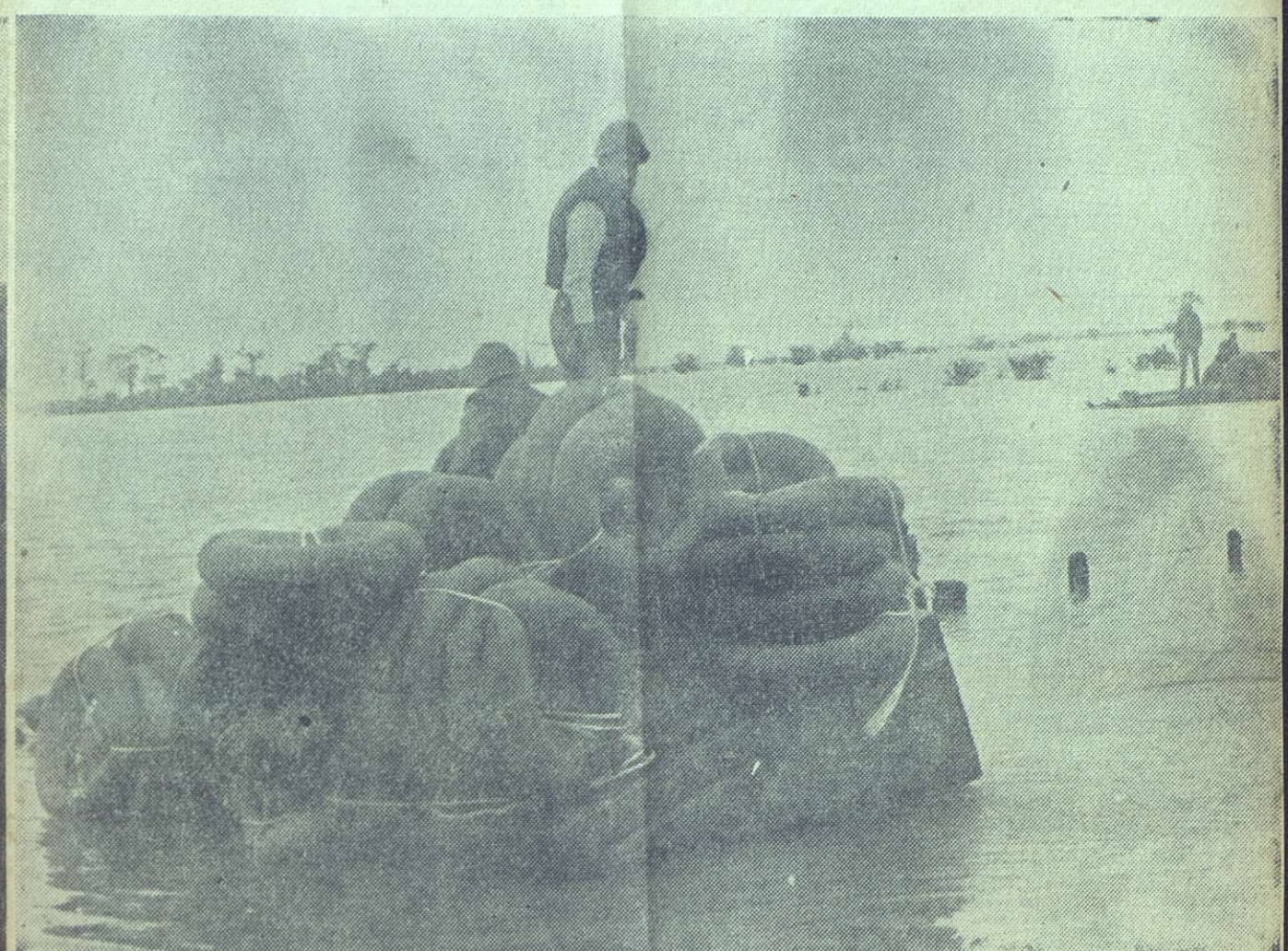
A bordo de uno de los tanques anfibios, el comandante William Gálvez se dispone a seguir a Fidel, cuyo vehículo está a unos 20 metros de distancia. El plan contemplaba su traslado a Bayamo para darle ayuda a los damnificados de la zona.