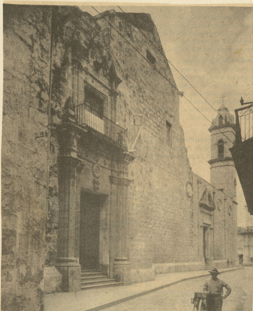
ruerta principal del antiguo seminario de San Carlos, por la calle de San Ignacio, que todavía se conserva hoy en un costado de la vieja Catedral.