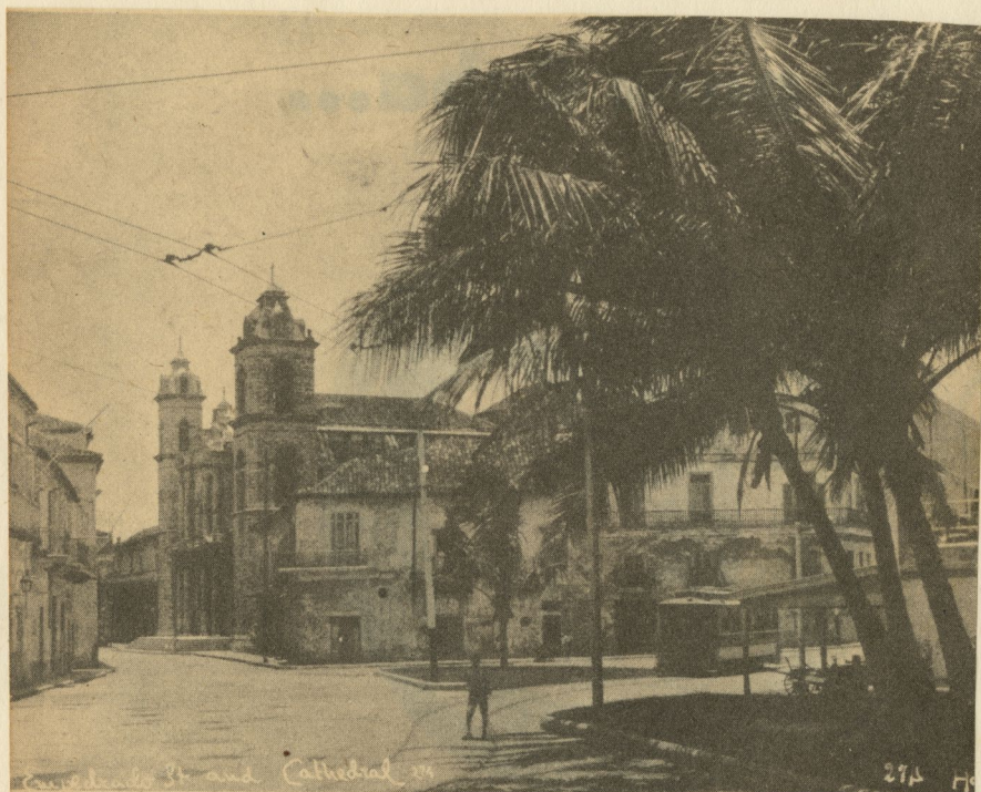
Un aspecto del costado de la Catedral, hace veinte años, cuando todavía existía el viejo edificio colindante, de techo de tejas, y cruzaban por allí los tranvías eléctricos que seguían su ruta a través de los terrenos que pertenecieron a la llamada Cortina de Valdés.