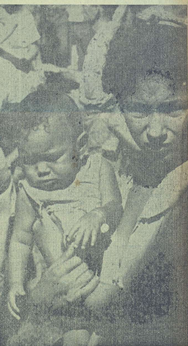
Es un rostro expresivo de los duros instantes vividos por la joven campesina y su pequeño hijo. Cuatro días, con sus noches, estuvo rodeada por las aguas del río Najasa, en el batey del "Cándido González".

Tomamos la habitación 415. Dentro había una humedad terrible. Los empleados del antiguo Residencial habían clavado las ventanas, colocándoles madera. Y no obstante, el agua de los torrenciales aguaceros había convertido en cochiqueras las habitaciones. A causa de la falta de electricidad, el motor que impulsa el agua a los pisos superiores estaba paralizado, y los servicios sanitarios estaban desbordados. Pero a nadie, ante el fenómeno climatológico, le preocupaba esta desagradable situación. Los hombres y mujeres que habían resistido la tormenta ayudando a las víctimas, tenían demasiado