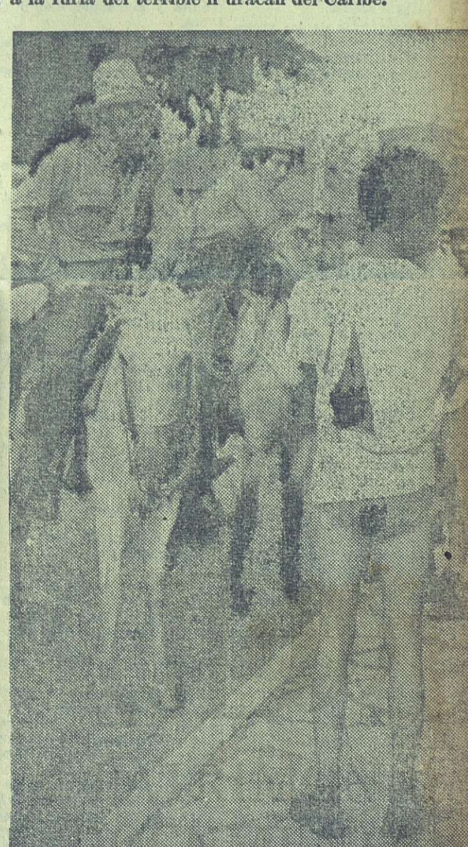
El "Flora" sólo le dejó la raída camisa y el par de botas. Por pantalones, usa una especie de trusa confeccionada con un pedazo de saco de yute.

Nos invitan a montar en un helicóptero. Trataremos de llegar a Santa Marta. (Continuará).