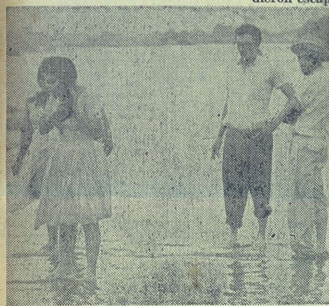
Y en medio de la tragedia, el eterno femenino —que es también eterno heroísmo—, se hace patente. Es imposible atravesar la carretera que conduce a Santa Cruz del Sur. Mientras se espera, la mojada caballera se peina.

cómo son atendidas varias familias. En la institución médica se les vacuna a los otros se les aplican vitaminas inyectables y a todos se les da alimentos.