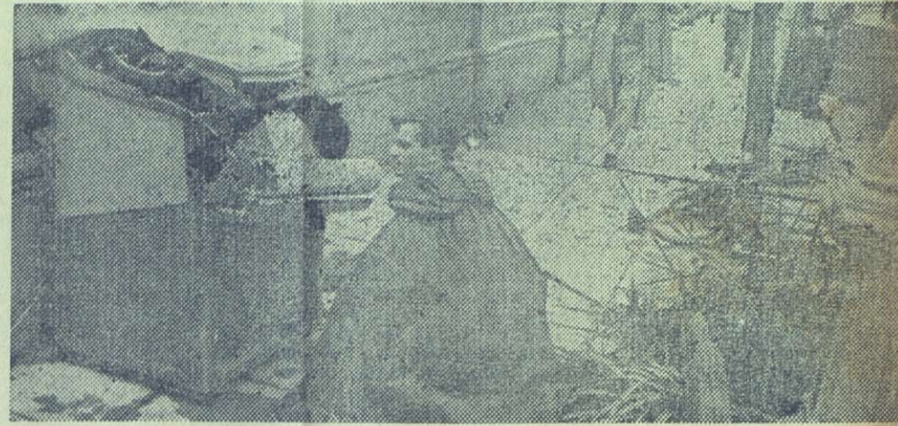
Esta victrola, arrancada de un bar camagüeyano por la inundación, fue frágil juguete andante de las aguas. Un miembro del DOP lee por última vez los nombres de las canciones que ya no se oírán más en el instrumento.