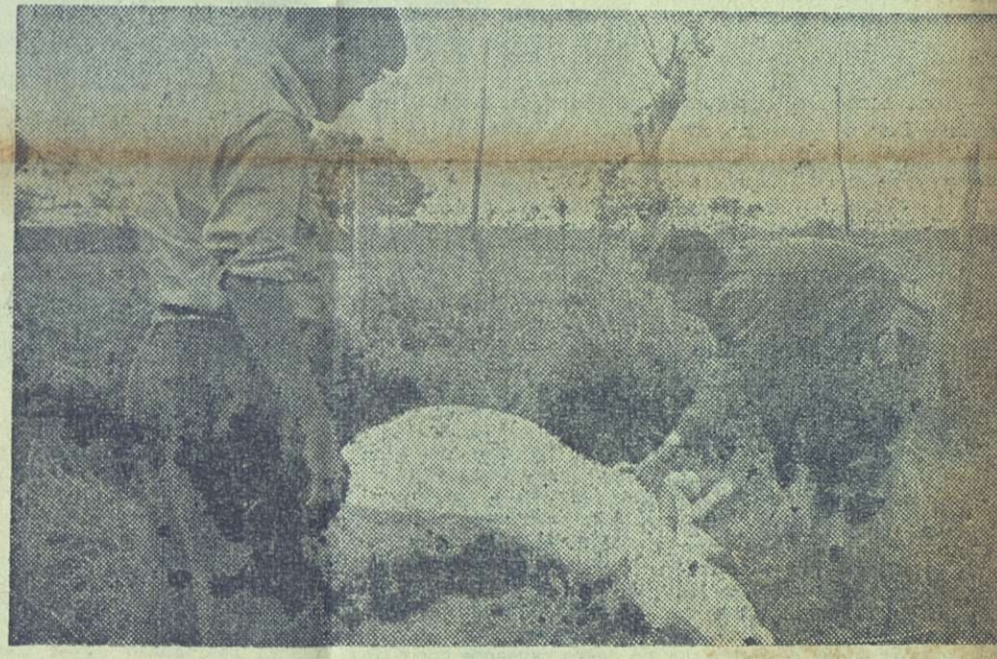
El número de animales ahogados es incalculable. Rumbo a Santa Cruz del Sur, los enviados de REVOLUCION se encontraron con cientos de reses que no pudieron escapar a la furia del terrible huracán del Caribe.