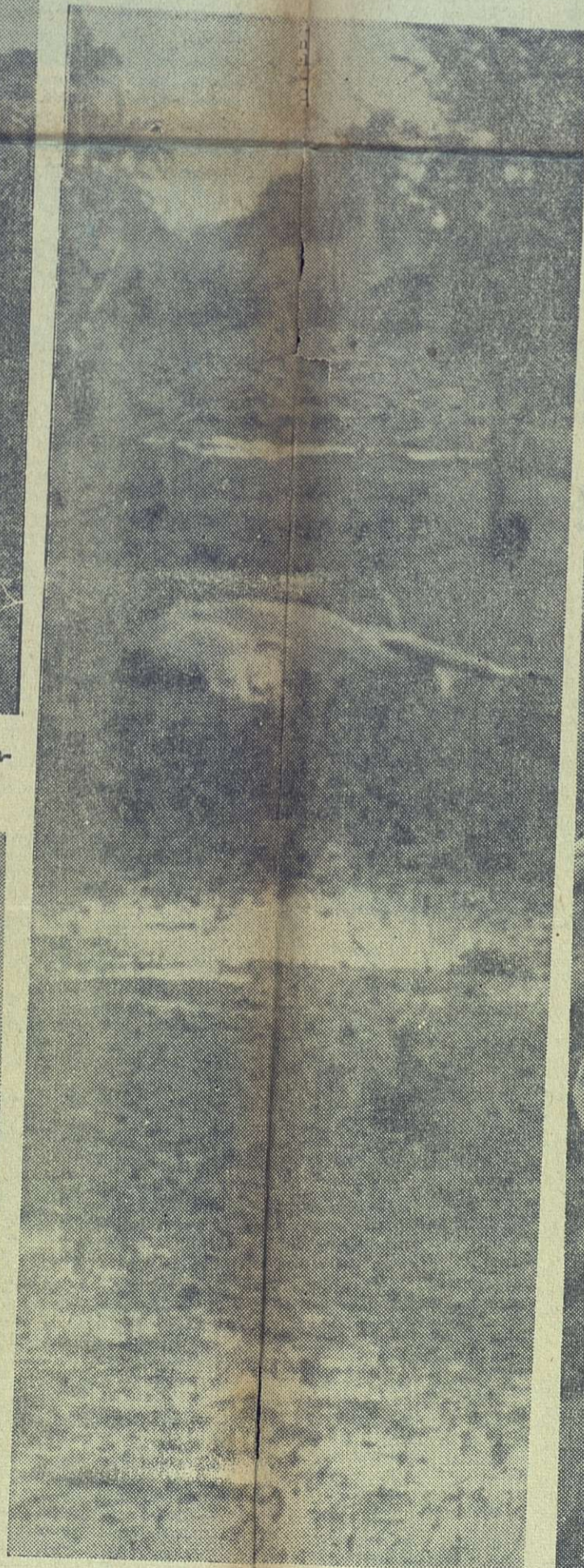
Esta res muerta es una de las tantas que se pueden ver en las diferentes zonas por las que pasó el ciclón.