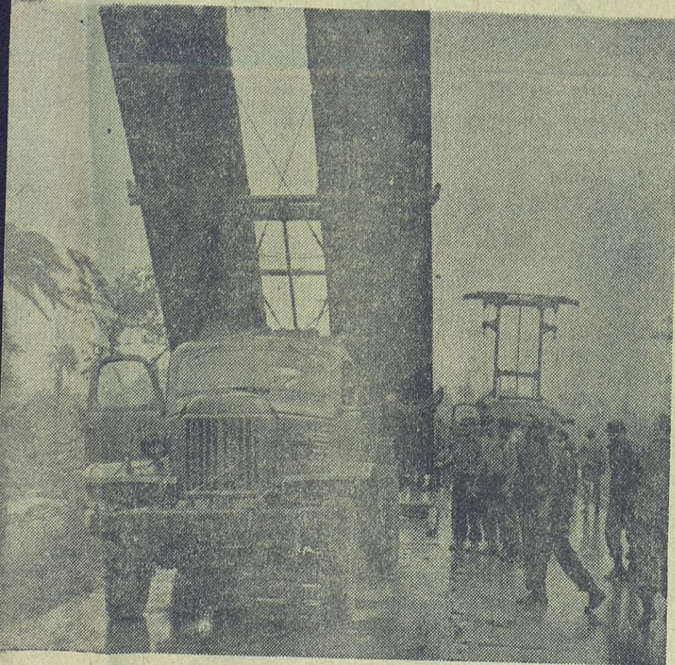
Camiones adaptados en los que se transportan los puentes portátiles.