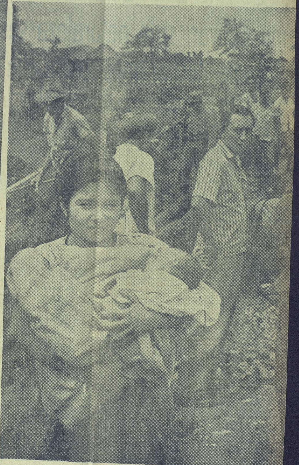
Con los niños en sus brazos, esta madre se dispone a regresar a su hogar después de haber pasado incontables horas de angustia.