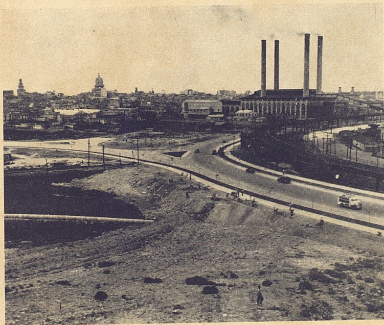
Paso Superior construido en la barriada de Luyanó.