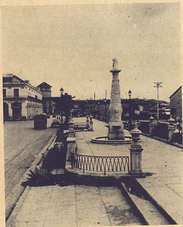
Vista General de la Alameda de Paula, después de su restauración.