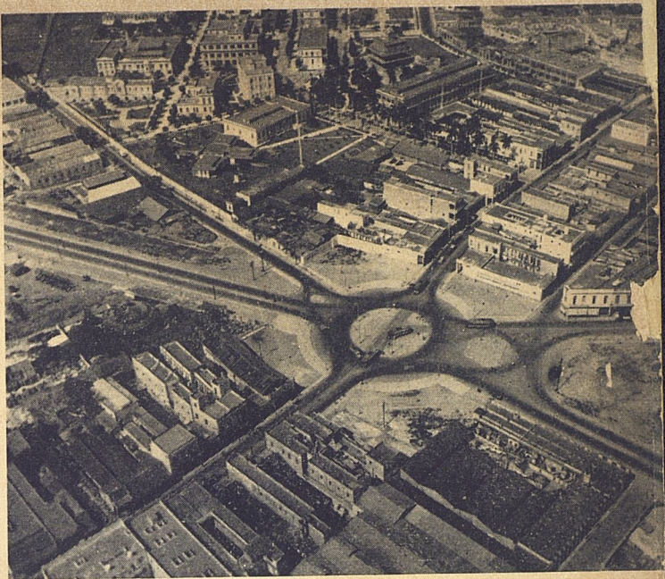
Vista aérea de la Plaza de Agua Dulce.