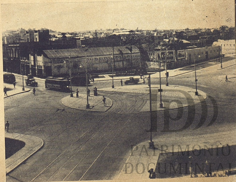
Vista general de la Plaza de Agua Dulce.