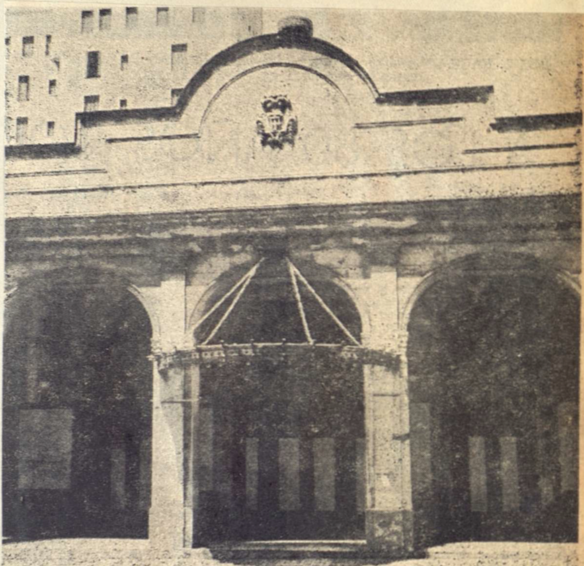
FACHADA DEL EDIFICIO que a través de su historia artística, ostentó varios nombres, siempre relacionado con trajes teatrales y que próximamente desaparecerá al influjo de las necesidades de la vida moderna.