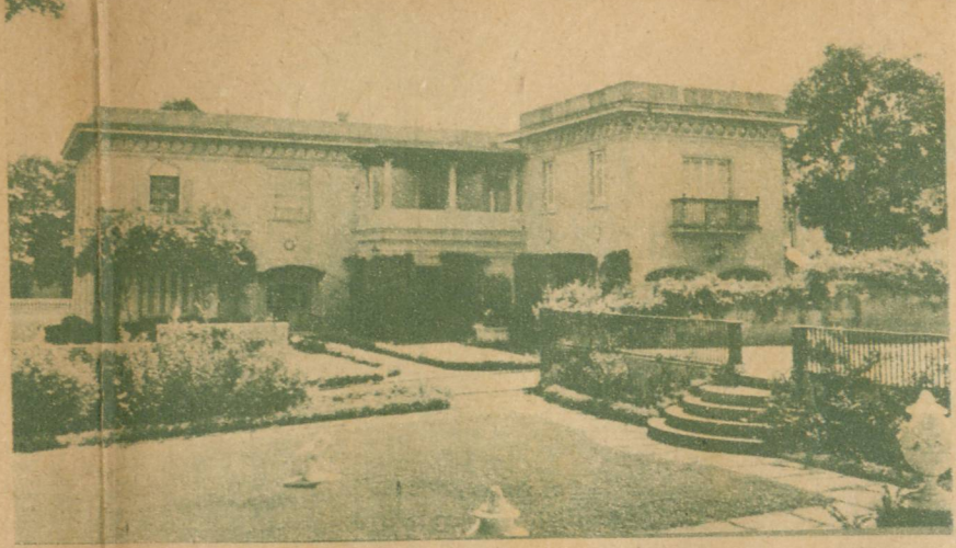
Perspectiva de la residencia Cintas, que su propietario quiso alguna vez convertir en museo público para poner al alcance de todos las obras artísticas que había coleccionado pacientemente. Ahora la Revolución hará realidad este proyecto.