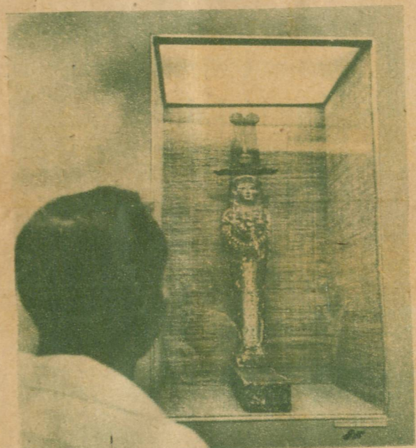
Modelo de sarcófago de una antigua dinastía faraónica. Un visitante contempla la valiosa pieza, que pertenece a la Colección Lagunillas, de la Sala de Arte Egipcio, en el Museo Nacional.