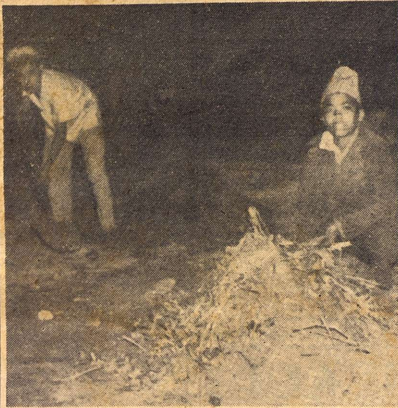
Estos dos chicos siguieron el ejemplo de sus mayores. En sus respectivos hogares, como en tantos y tantos otros de La Habana, falta el carbón. Vieron cómo a algunos vecinos, con la leña producto de la poda obligatoria hecha en los árboles abatidos por el huracán, construían hornos. Ellos no fueron menos y cada uno hizo el suyo, muy pequeño, de acuerdo con la medida de sus fuerzas. Se turnan para cuidarlo y evitar que la carga se vuele.