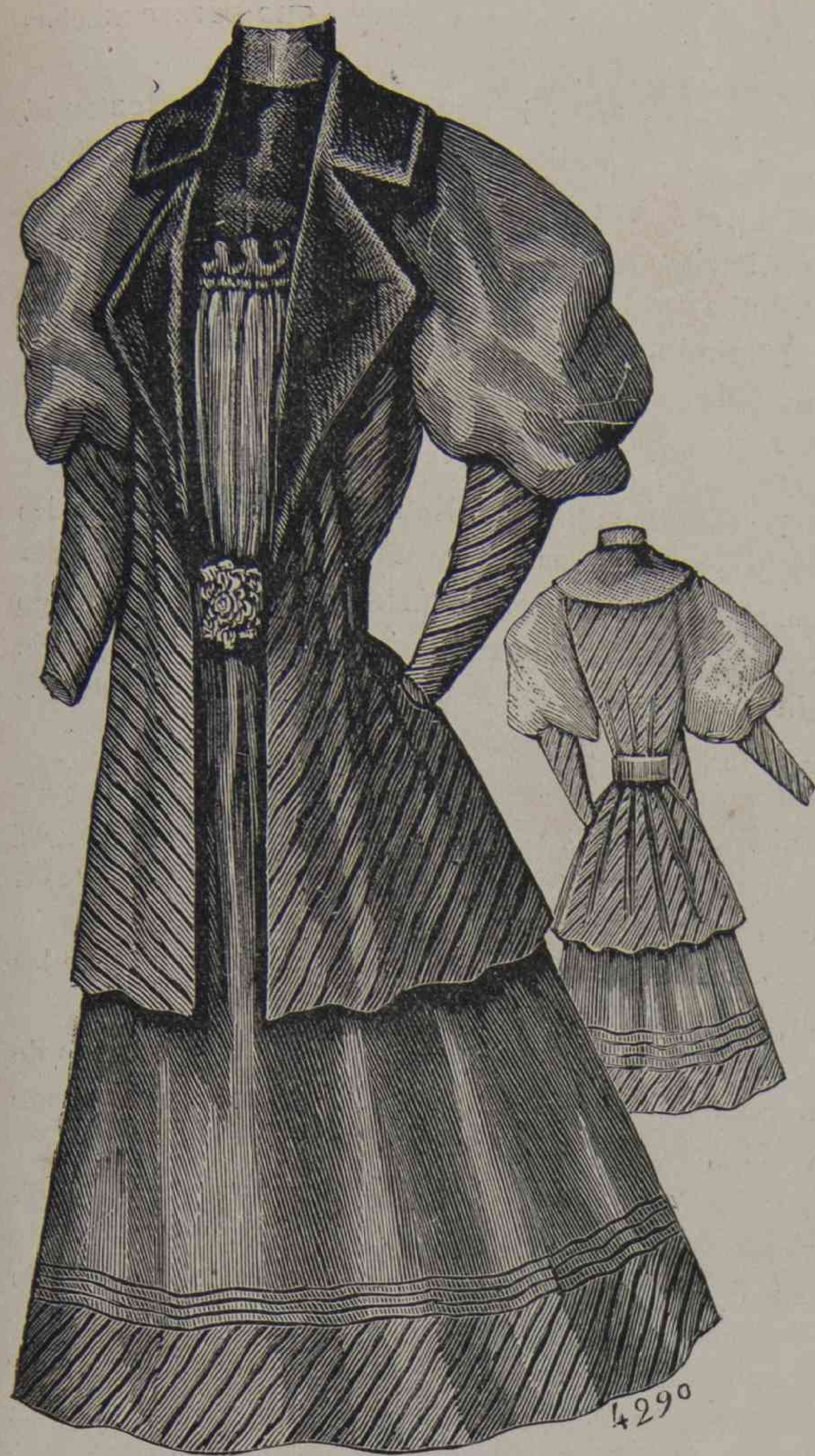
C. 18 y 19. — Traje de jovencita (delantero y espalda).

Como estos adornos de fantasia no pueden ponerse en las capotas, en estas, todo se reduce a un penacho de plumas y encaje. En las tocas se pondran muchos bordados de oro y plata, ó motivos de perlas. Tambien se harán mucho, tocas de terciopelo. Para estas los colores que mas se llevan en este momento son: el rosa de China, el violeta, y el verde.