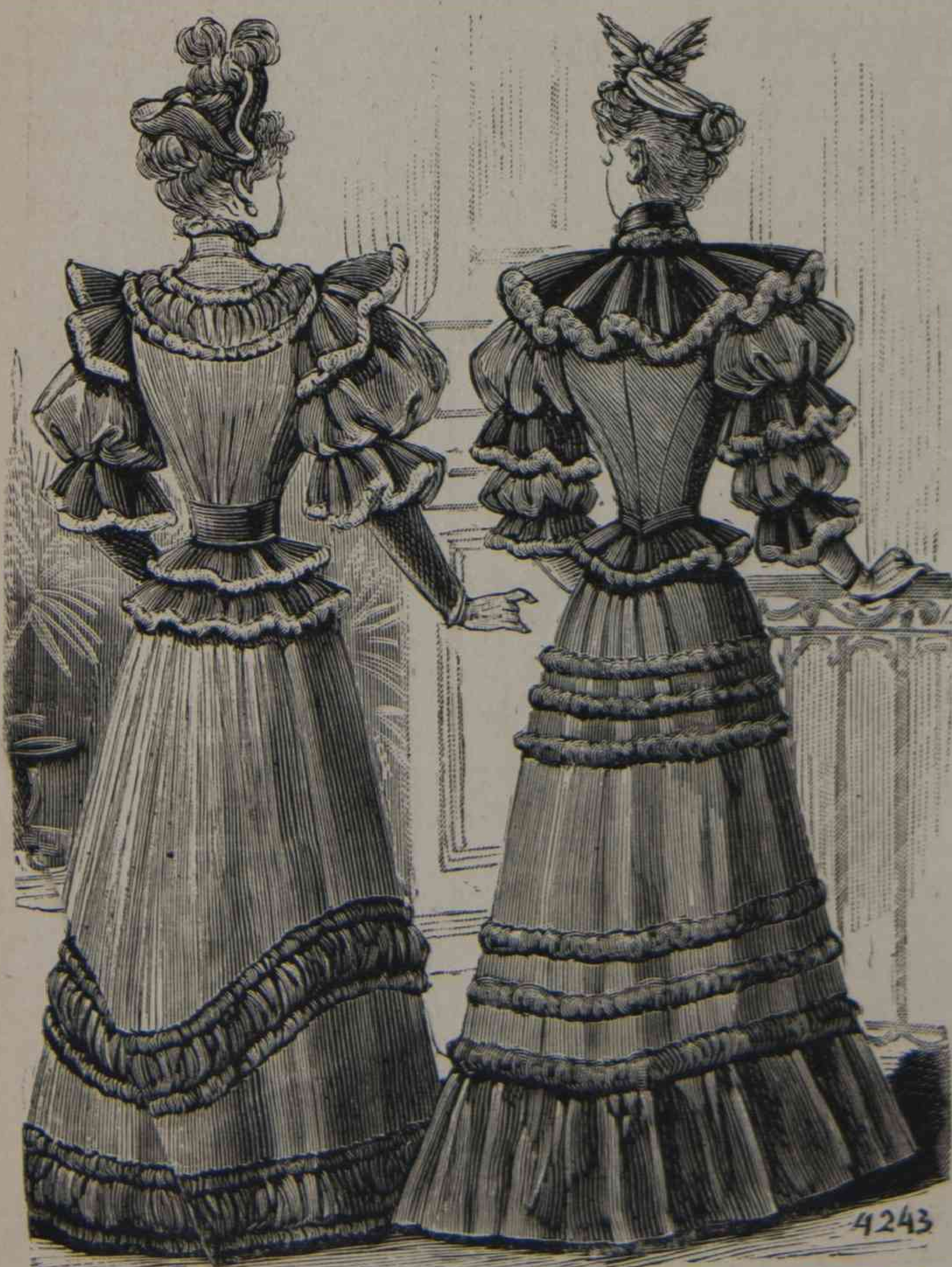
Trajes de noche para invierno, espalda del figurin en color n° 52. (Véase las explicaciones, pagina 361.)

Un pequeño detalle que tiene su interés y