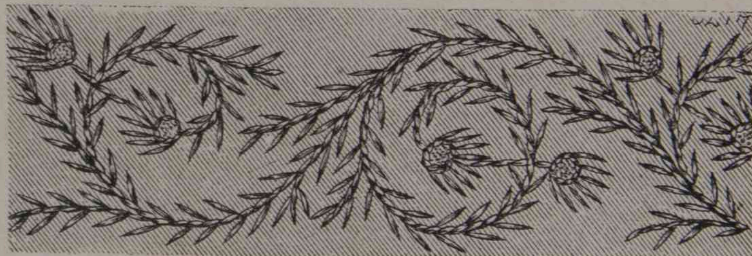
7. — Bordado del Esconde-Pañales.

9. —Niña de 8 años. —Falda redonda de paño inglés, con tres volantes de lo mismo. Cuerpo redondo, abrochado atrás y cortado sobre un plastron de guipure con viso de terciopelo marron. Cuello y cinturón de terciopelo marron, con puntos beige . Peregrina de paño beige forrada de surah del mismo color. Como