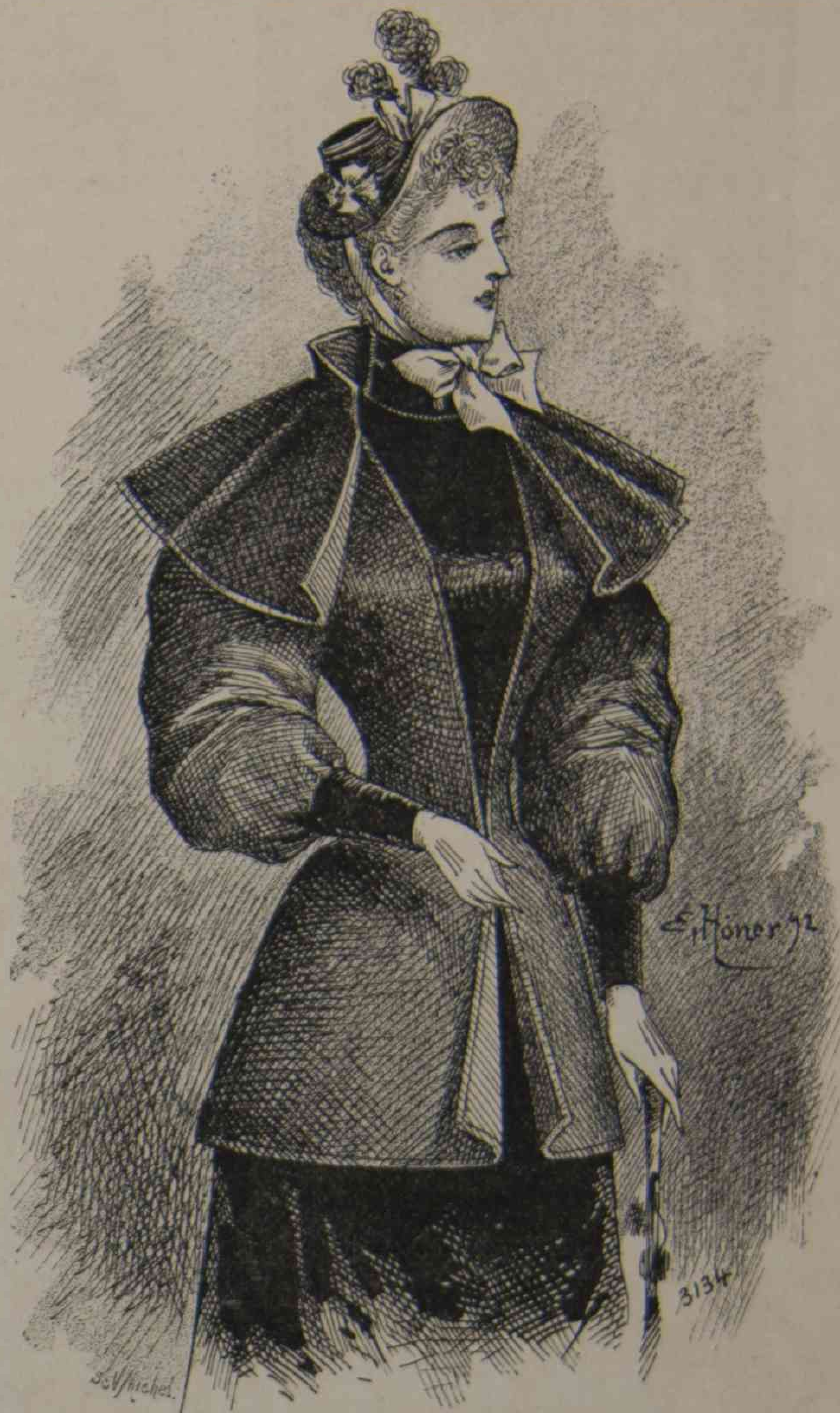
10. — Chaqueta con peregrina.

24. — Traje de niño . — Falda con tres volantes, de terciopelo escocés con flores brochadas. Los volantes tienen un borde de raso. Cuerpo redondo, de terciopelo escocés, fruncido en el talle, con un cinturón ancho atado detrás. Berta fruncida formando cuello, de raso; el cuello también es de raso. Mangas bufantes de terciopelo, con puños estrechos y brazaletes de raso. ROSA.