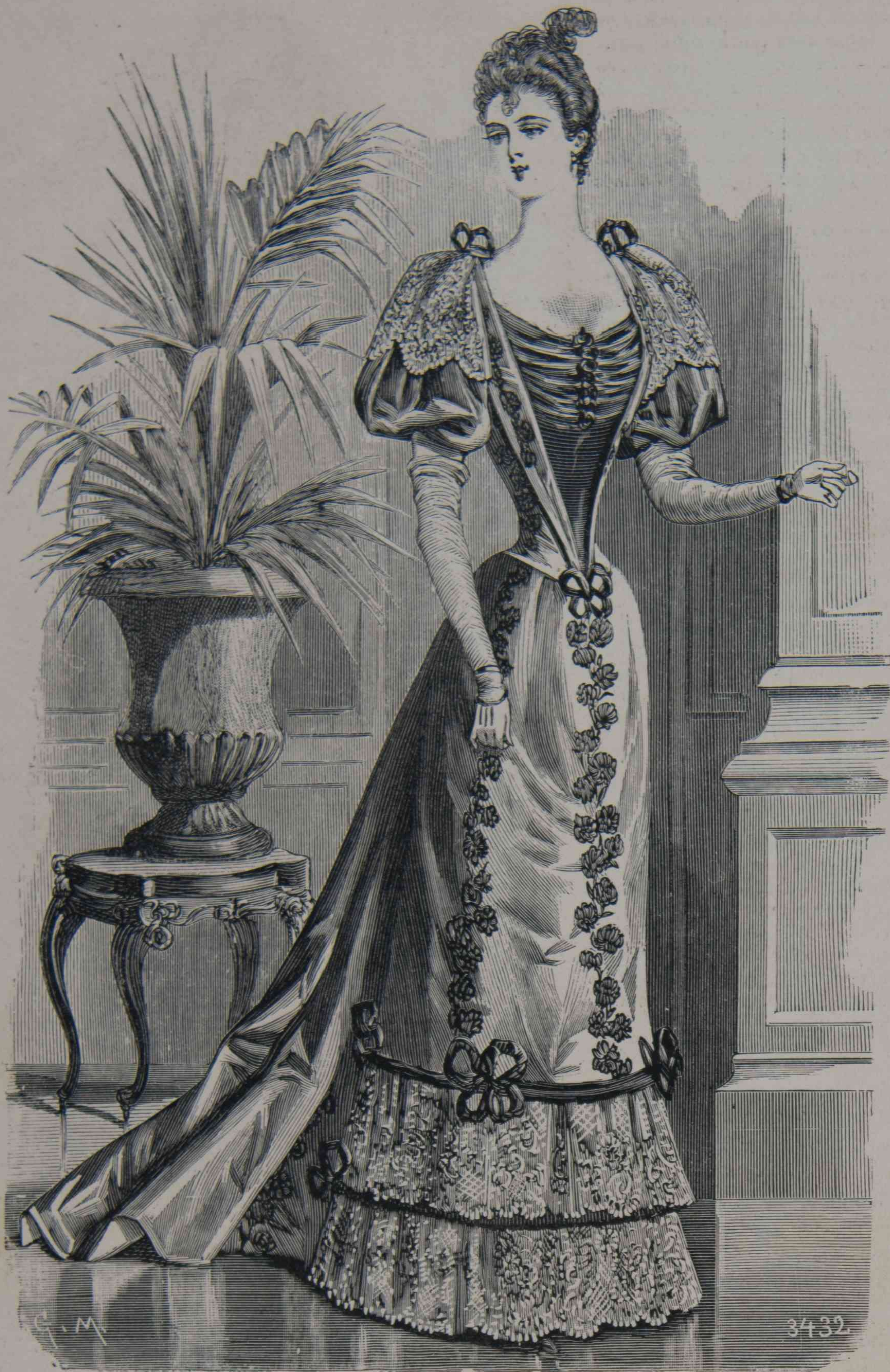
A. 12. — Traje de soirée ó de comida.