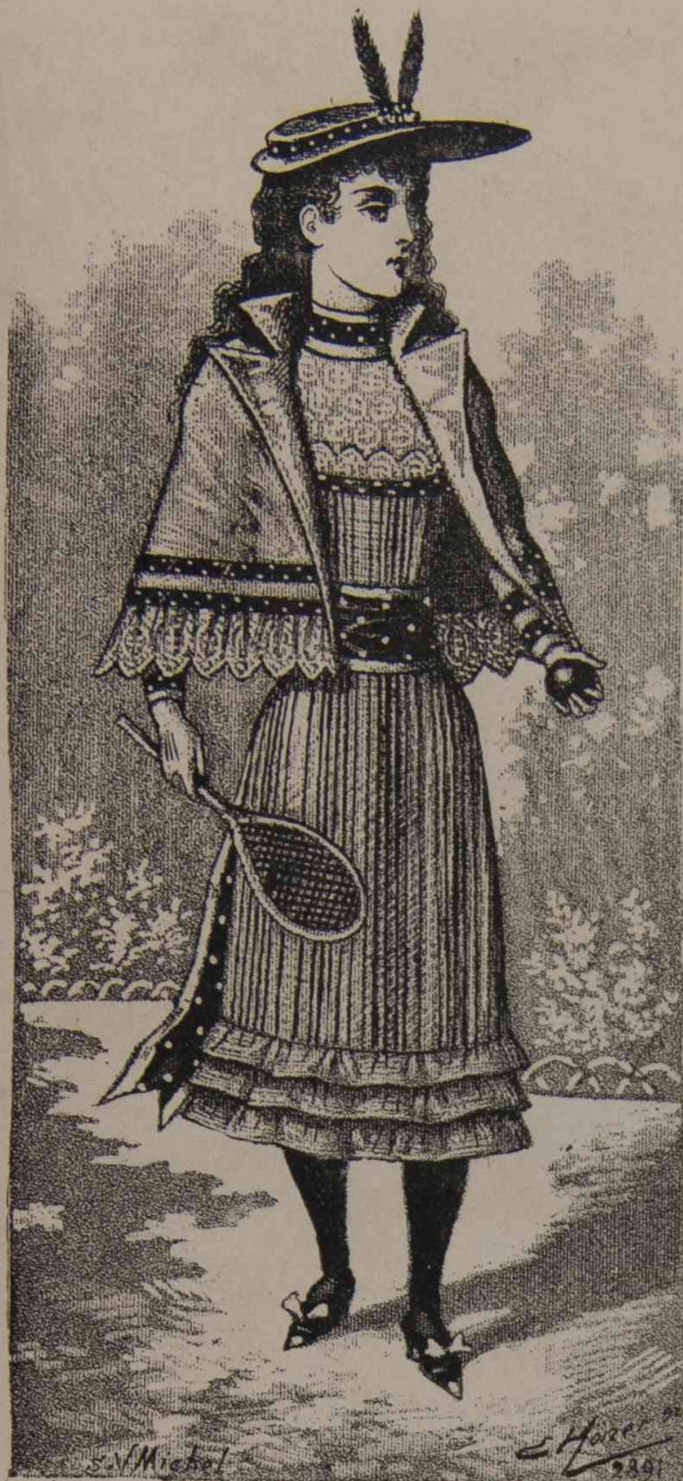
9. — Niña de 8 años.

palda ), de paño liso y paño fantasía. La falda es de paño liso y tiene un biés de paño rayado gris y nacar; encima de este biés van tres respuntes. Chaqueta sin ajustar delante, rayada, con cuello y vueltas de terciopelo nacar; la chaqueta está abierta sobre un bufante de seda gris con canesú de terciopelo nacar. El cinturón sujeta la espalda y se abrocha con hebilla de plata. Mangas de paño liso con puños fantasía. (El patron lo damos en la hoja de patrones dibujados.)