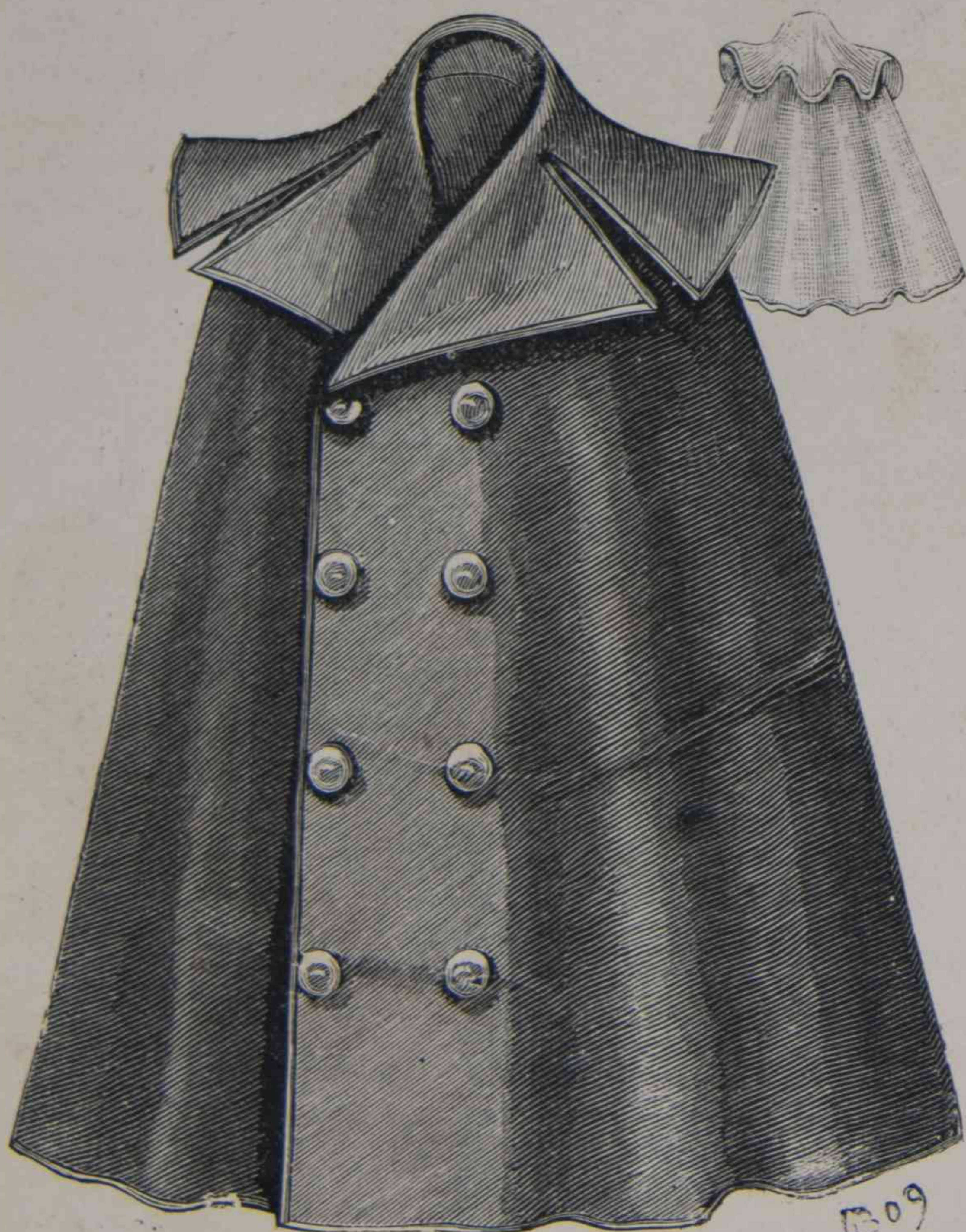
13 y 14. — Peregrina Oficial (delantero y espalda).

Diremos algo sobre la forma. Las alas grandes y onduladas, están en mayoría: hay además toda una serie de formas Arlequin y Polichinela; para esta última he aquí el adorno: una banda de plumas rizadas puestas en el borde; y siguiendo las ondulaciones del ala; en el lado una aigrette de varios colores. Los adornos se harán de terciopelo y las plumas tendrán mucha aceptación.