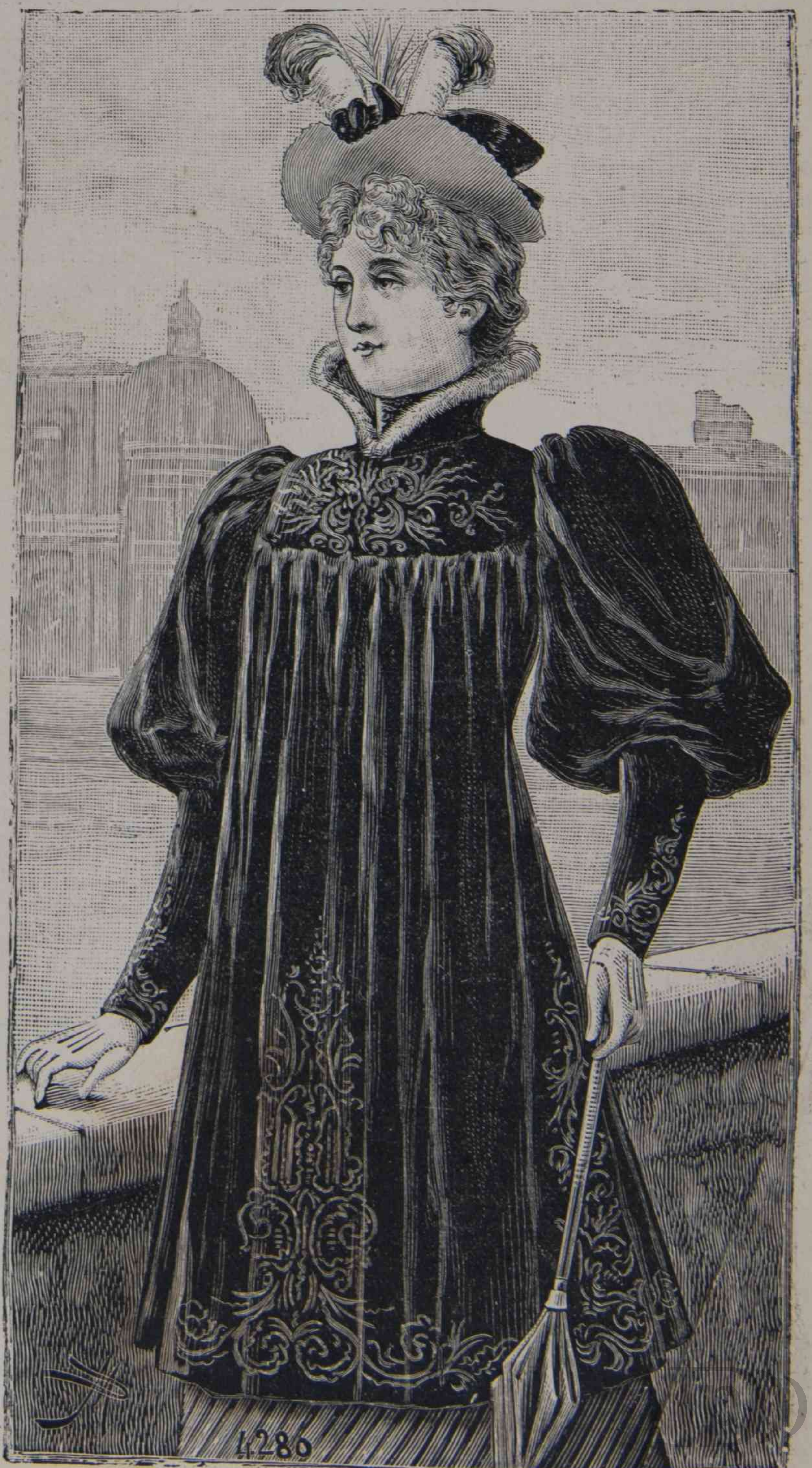
17. — Abrigo Ruso.

que seran negros, grises, beiges, y sobre todo marrones.