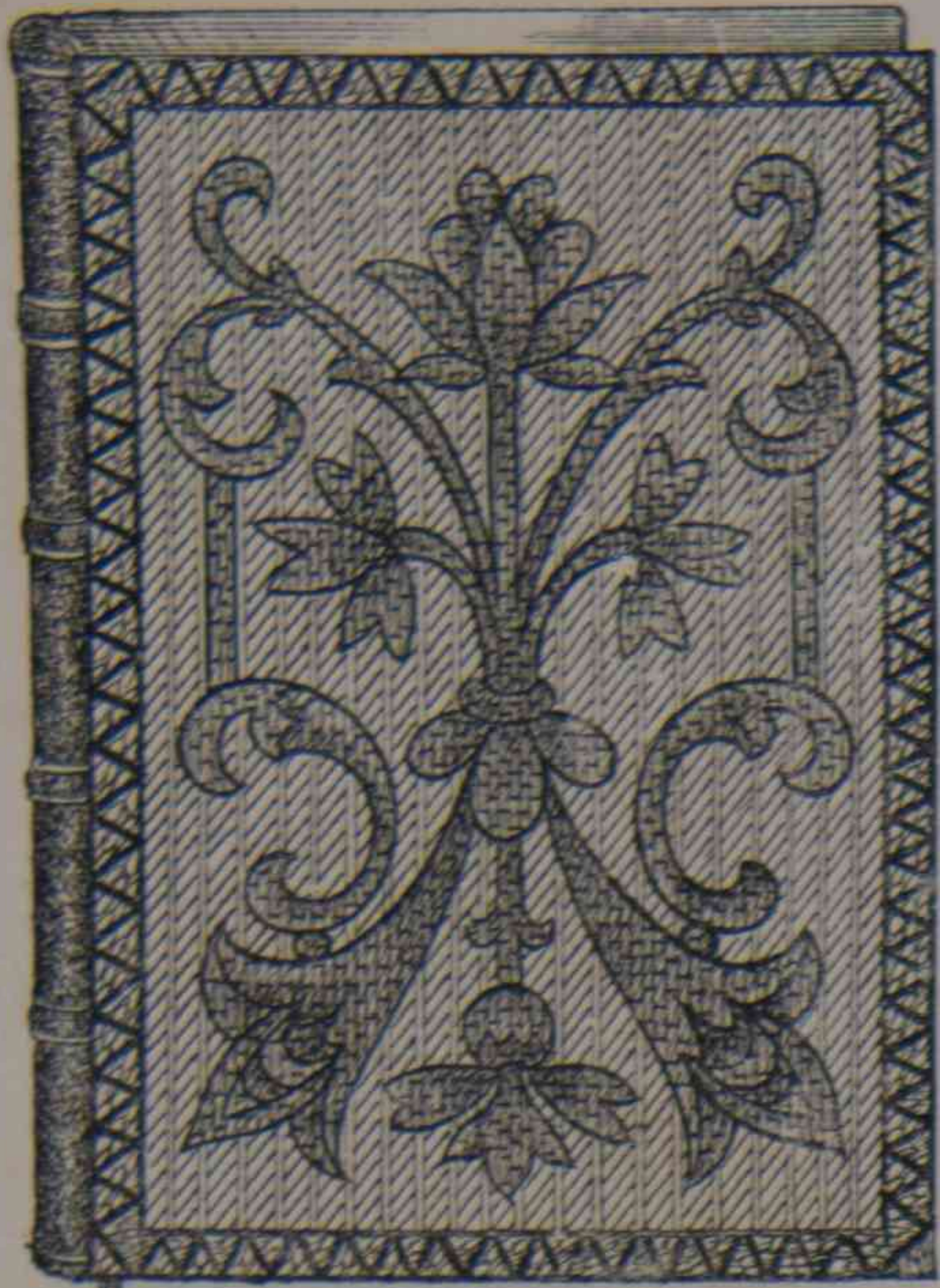
4. — Cubierta para libro.

trás y en los lados, forman falda y están ligeramente frunzidos. Este abrigo tiene un delantero de terciopelo negro. Triple cuello de paño, redondo por delante; cada cuello tiene un respunte en el borde. Mangas bufantes con puños adornados de pasamanerías negras, como el delantero. Sombrero de fieltro gris con lazos de terciopelo encarnado. Este abrigo se puede haer de varios colores así como; verde ruso, azul marino, encarnado, etc. Se forra de seda ó polonesa del mismo color.