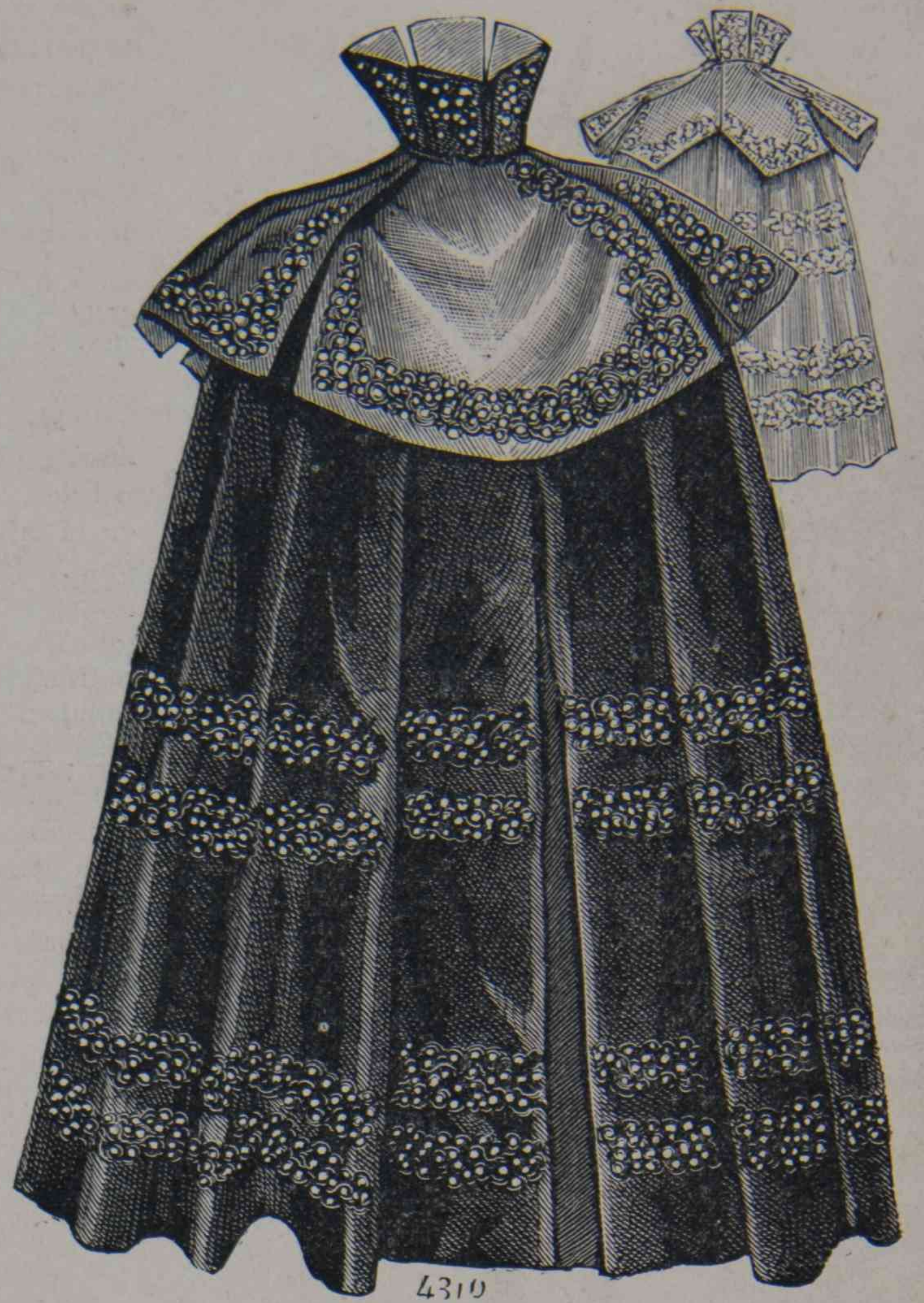
B. 15 y 16. — Peregrina plegada (delantero y espalda).

Diremos algo sobre la forma. Las alas grandes y onduladas, están en mayoría: hay además toda una serie de formas Arlequin y Polichinela; para esta última he aquí el adorno: una banda de plumas rizadas puestas en el borde; y siguiendo las ondulaciones del ala; en el lado una aigrette de varios colores. Los adornos se harán de terciopelo y las plumas tendrán mucha aceptación.