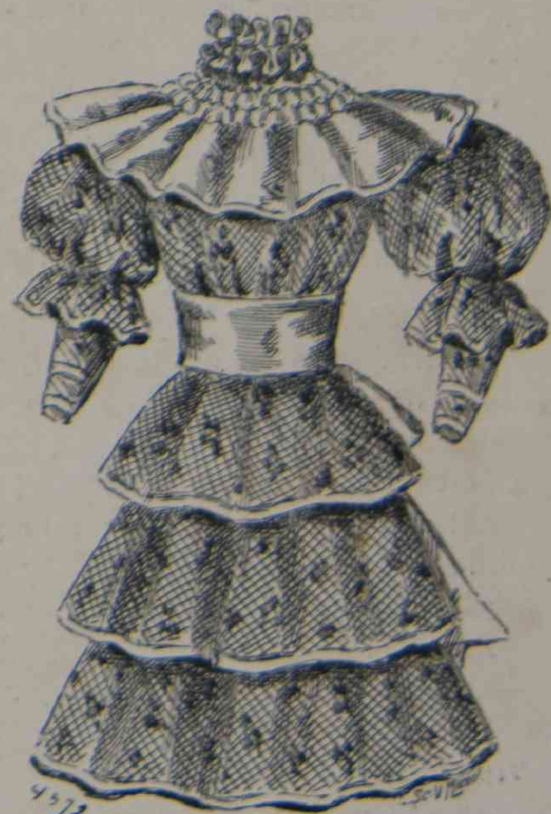
24. — Traje de niño.

trador de una casa de la calle de la Lechuga, y cuatro mil que viene á sacar de comision vendiendo vinos de Jerez... ¡qué! ¡si el Isidorito es una hormiga!