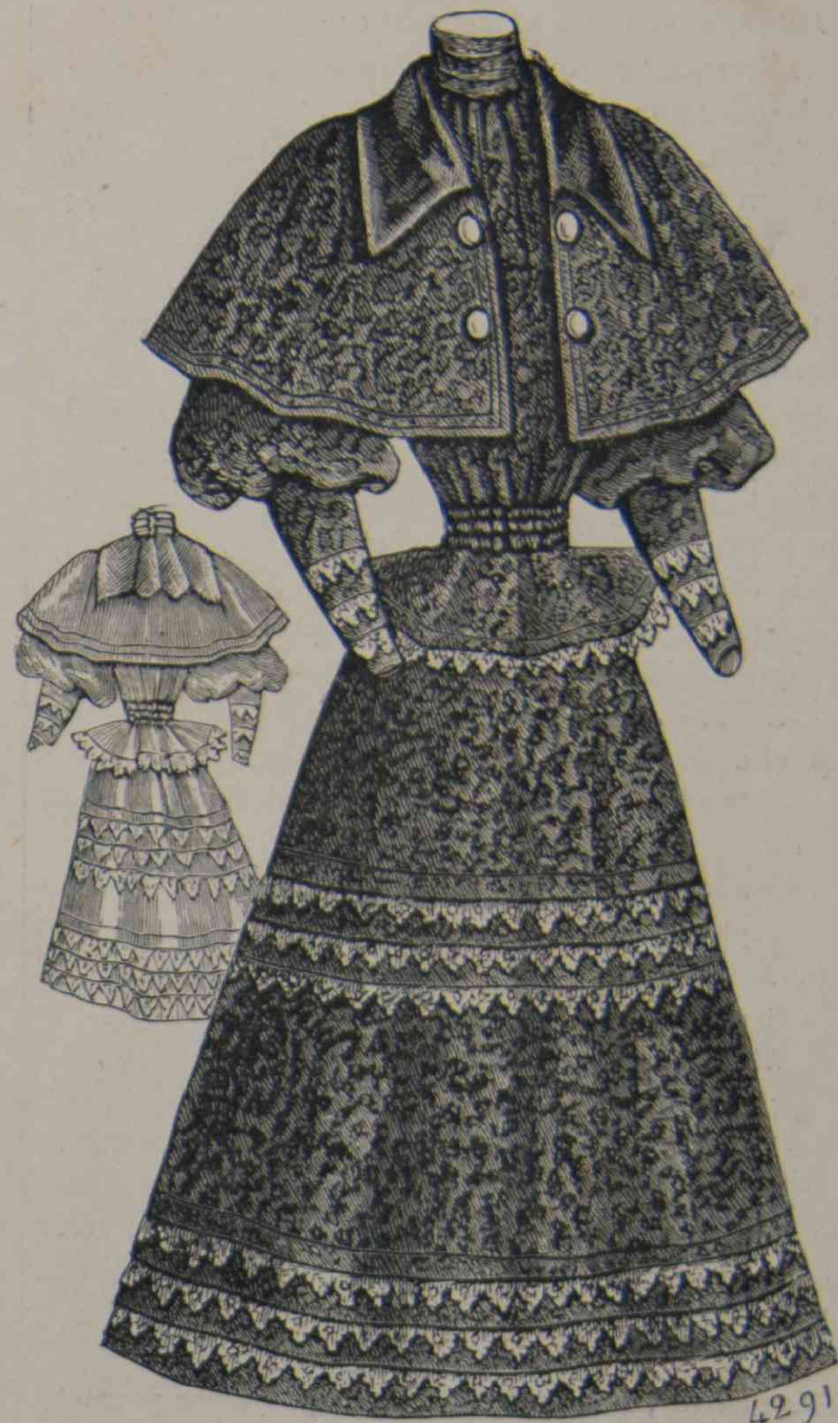
D. 20 y 21. — Traje de vestir para jovencita (delantero y espalda).

—En cambio,—observaba D. Isidoro,—tiene muchos oficios: porque, además de su sueldo, gana cinco mil reales como adminis-