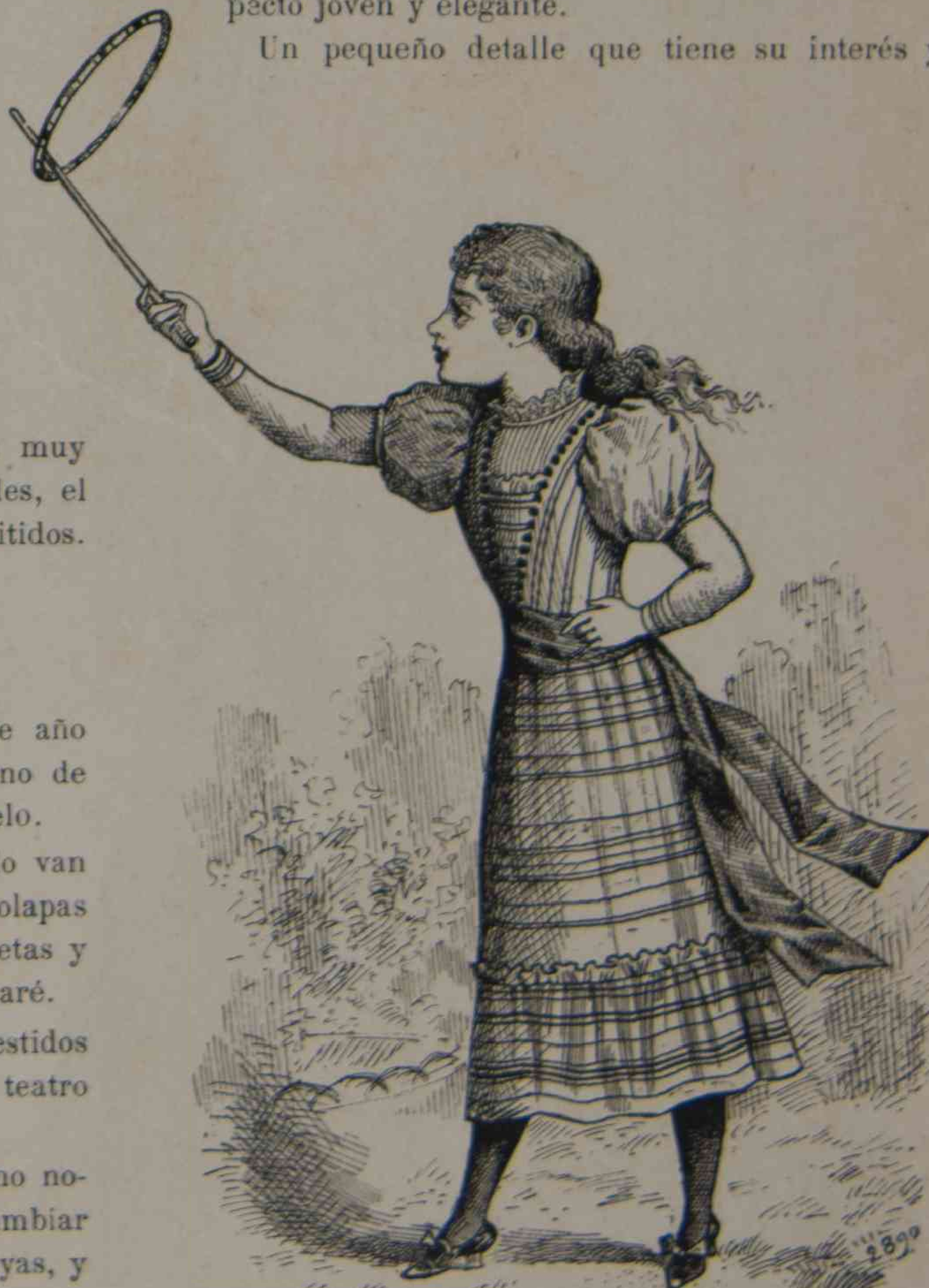
11. — Niña de 12 años.