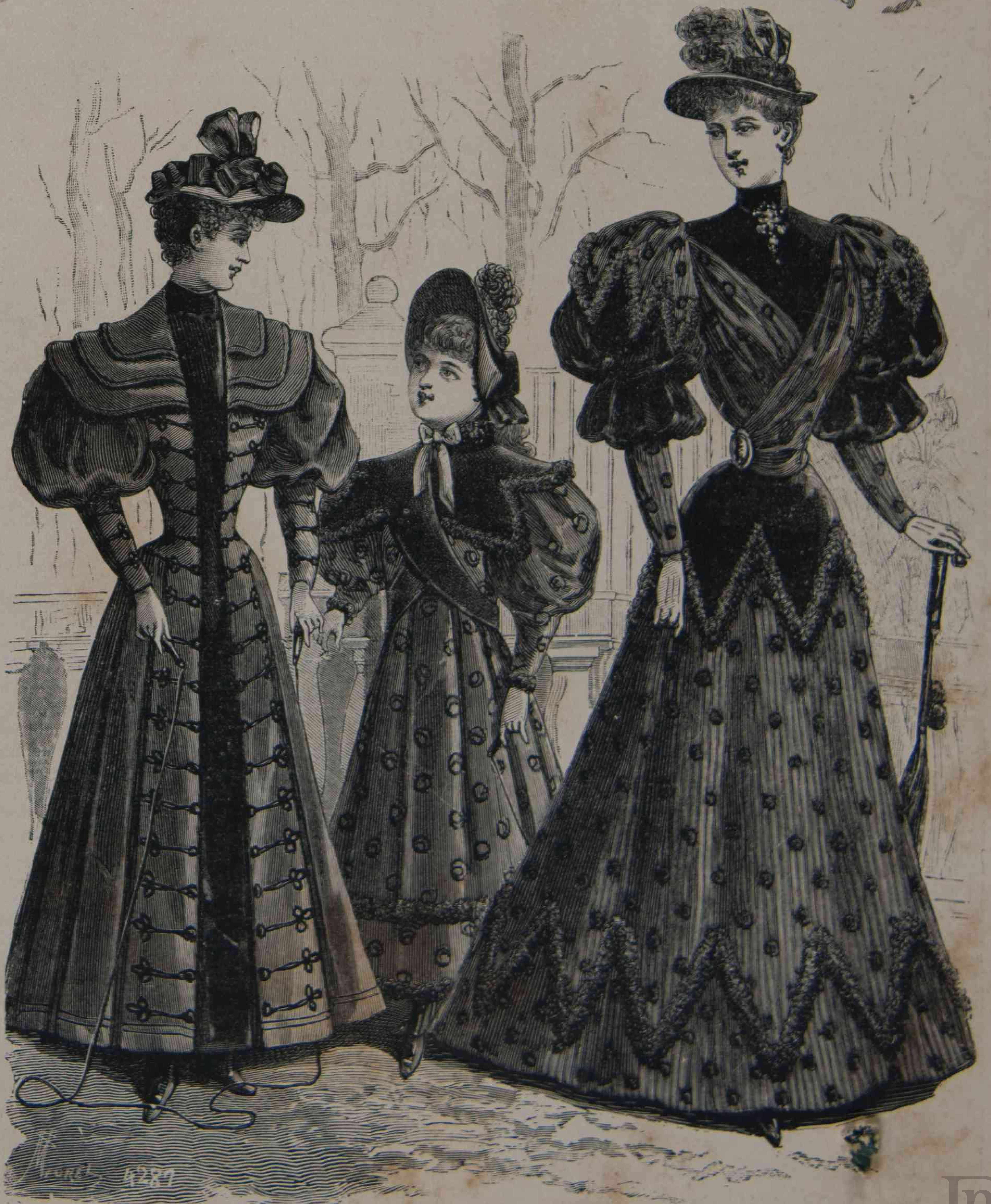
1. Abrigo de jovencita. — 2. Niña de 8 á 10 años. — 3. Traje de calle.

1. — Abrigo de jovencita, de forma redingote, de paño gris acero, con pasamanerías negras. El delantero es de una sola pieza; por de-