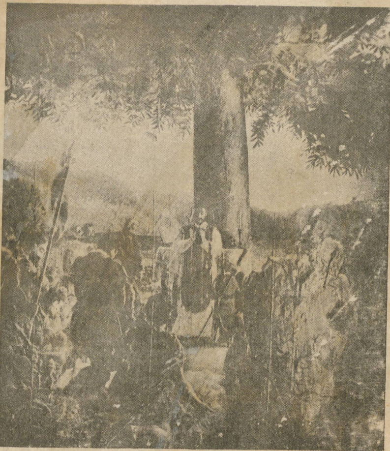
Cuadro de Vermay, que decora el Templete, representando la leyenda de la primera misa bajo la ceiba memorable a la que asistió el Adelantado Diego Velázquez.

Y pasando a las espectadoras, a la concurrencia femenina que con ve los y me de la fiesta, sión la irreve remonia para está, mirando grandes, cla-