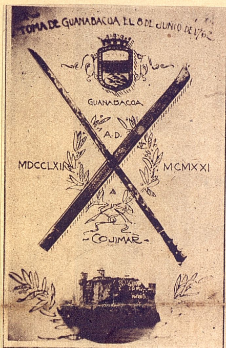
Copia fotográfica del machete que esgrimió José Antonio Gómez, defendiendo la Villa de Guanabacoa de la invasión británica.