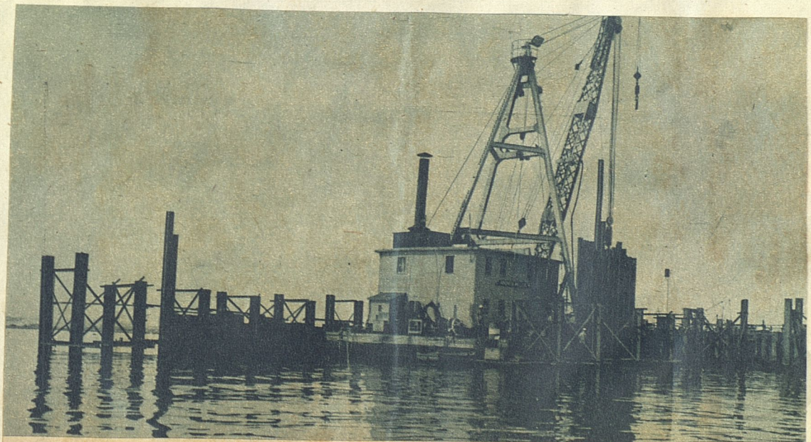
Trabajos iniciales de construcción del Dique Seco No. 1 en la bahía habanera