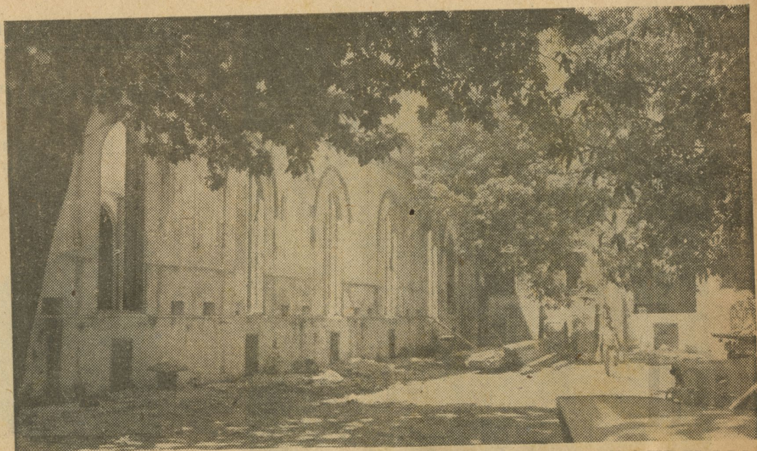
Romántico rincón del ya desaparecido Hospital Mercedes

Hoy el nuevo hospital "Mercedes" que puede compararse ventajosamente con los mejores del mundo, bajo la sabia dirección del Profesor Ortega, que ha sabido recoger y continuar las glorias de su ilustre padre, otro de los grandes de la medicina cubana, sabrá seguir la inspiración de sus antecesores y cumplir con su destino, con el mismo entusiasmo y el mismo amor de antaño a la humanidad doliente, cumpliendo así con su noble tradición de más de tres siglos.