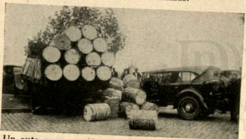
Un auto y un camión cargado de bobinas chocaron en Puerto Nuevo, ocasionando heridas leves a cuatro personas.