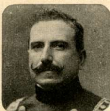
El general Agustín P. Justo con el general Luis J. Dellepiane, que fueron al campo del honor el 23 de mayo de 1924. El duelo tuvo doce asaltos. Ambos duelistas resultaron heridos.