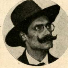
Un duelo literario, pero también sangriento: Gómez Carrillo con Angel Falco. (Año 1920).