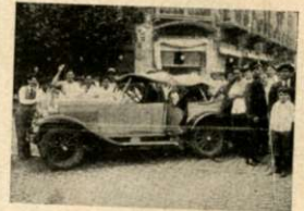
Chata y automóvil que al chocar con un ómnibus sufrieron considerables desperfectos, sin que, afortunadamente, hubiera víctimas.