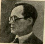
Ministro José Américo de Almeida, herido.