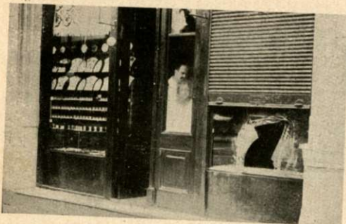
La vidriera de la joyería de Entre Ríos 1739 rota por los delincuentes para apoderarse de las alhajas allí expuestas, lo cual lograron en gran parte.