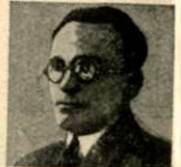
El interventor de Parahyba, doctor Antenor Navarro, fallecido.