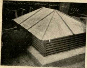
La claraboya por donde los ladrones penetraron en el negocio, Brasil 1154. Caja de hierro de donde robaron 5.000 pesos.