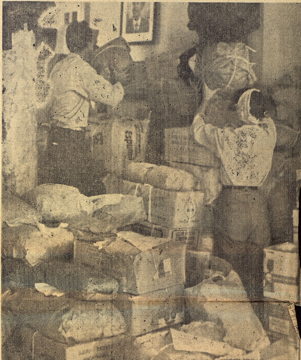
Aspecto de los distintos aportes que se recibieron de los trabajadores y del pueblo en los sindicatos y secciones sindicales de Marianao. Nuevas contribuciones continúan llegando, en respuesta a la campaña iniciada por la CTC-R.