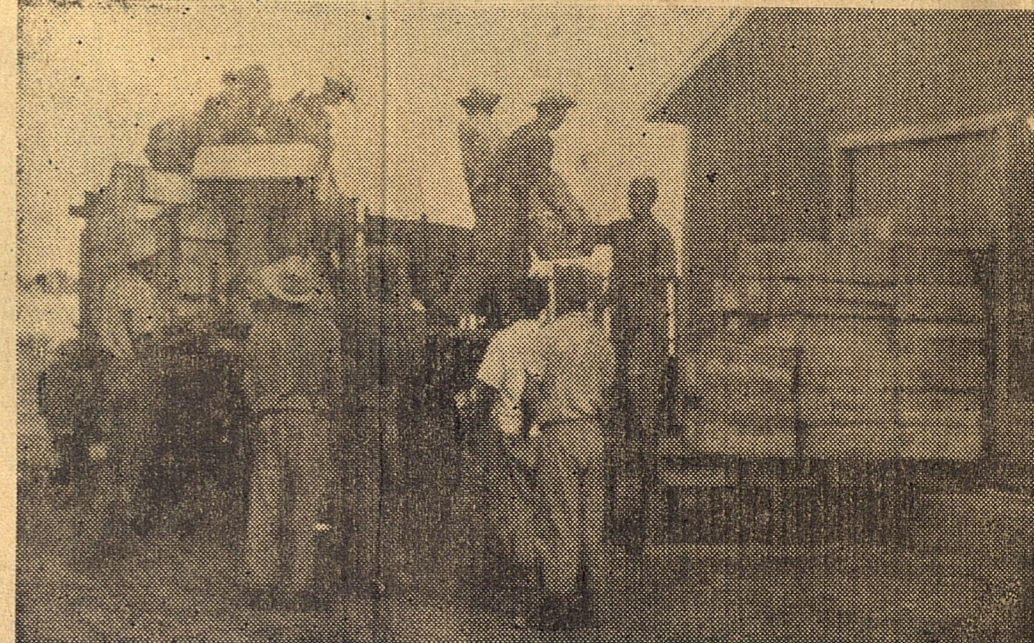
Los trabajadores del MINCIN y del Transporte descargan camiones con alimentos y medicinas para las zonas más afectadas de Santa Cruz del Sur y otros lugares de Camagüey y Oriente.