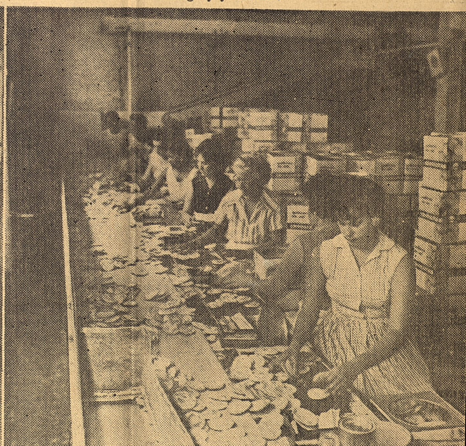
Mientras el pueblo se moviliza para hacer sus aportes de ayuda a los damnificados, los trabajadores han redoblado sus esfuerzos, trabajando horas extras, para aumentar la producción con destino a las zonas afectadas. En la composición gráfica aparecen tres aspectos de la cooperación obrera: en primer término, un trabajador acelera la preparación del chocolate; a continuación una vista de la actividad que se despliega en la panadería "Los Pinos Nuevos"; y por último, la galletería "Gilda" en plena producción.