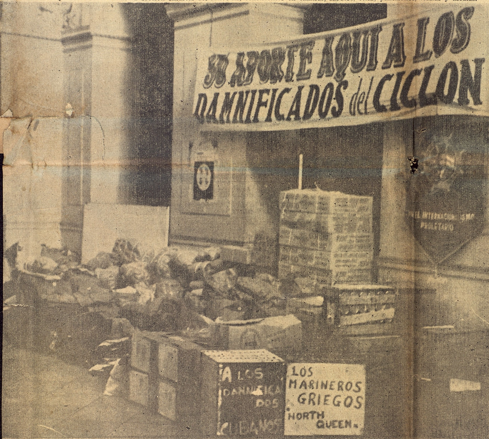
En la foto aparecen los aportes recogidos entre los trabajadores portuarios, consistentes en alimentos, ropas y medicinas, que serán enviados inmediatamente a las zonas afectadas por el huracán "Flora". También los portuarios tomaron el acuerdo de incrementar más aún la ayuda a los damnificados.