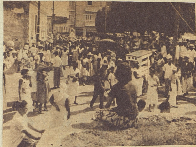
El cabildo enfile por la calle Maceo en dirección al cementerio. Centenares de creyentes siguen la ruta de los santos de "Omi-Toqué".